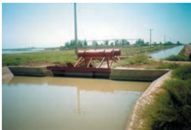
شکل ۵-۴- انهار اصلی آبیاری

انهار اصلی: آب را از منبع تولید به محل کشت می رسانند. انهار درجه یک: آب را از انهار اصلی گرفته، به قسمتهای مشخصی از زمینهای زراعی منتقل می کنند. برای احداث نهر درجه یک می توان از دستگاه نهرکن استفاده نمود.