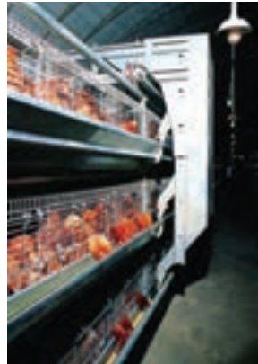
تصویر ۹-۴- دان‌خوری خودکار

آب‌خوری‌های چکه‌ای و فنجان‌ی می‌توانند به نحوی نصب شوند که مرغ‌های دو قفس مجاور از آن استفاده کنند. آب‌خوری چکه‌ای مرسوم‌ترین نوع آب‌خوری در سیستم قفس است. میزان هدر رفتن آب در این سیستم به حداقل می‌رسد. به ازای هر ۶ تا ۸ قطعه مرغ تخم‌گذار باید یک عدد آب‌خوری چکه‌ای و به ازای هر ۱۰ تا ۱۲ قطعه مرغ تخم‌گذار یک عدد آب‌خوری فنجان‌ی در نظر بگیرید ۴ (تصاویر ۹-۴ و ۱۰-۴).