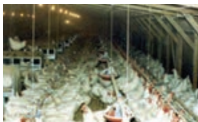
تصویر ۱۱-۴- انواع لانه تخم‌گذاری