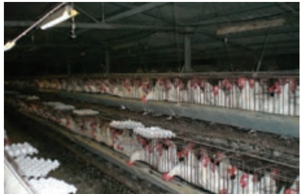
تصویر ۷-۴ - جمع آوری تخم مرغ به روش دستی