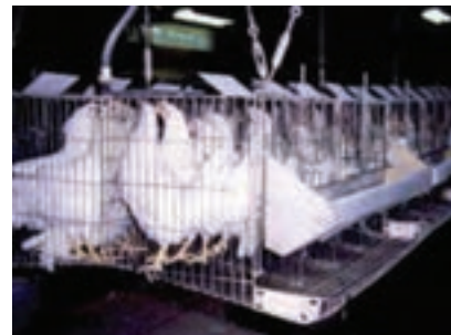
تصویر ۴-۲- قفس مرغ تخم‌گذار