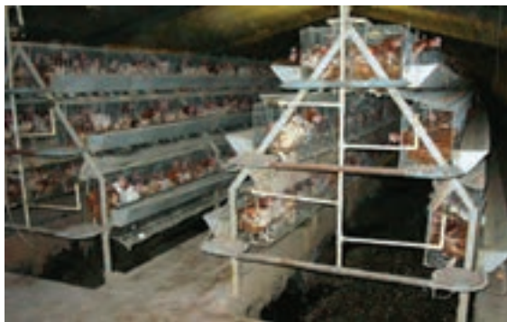
تصویر ۴-۶ - قفس پله ای