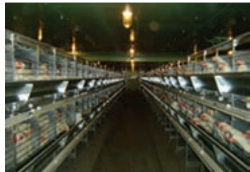
تصویر ۴-۴ - انواع قفس باتری