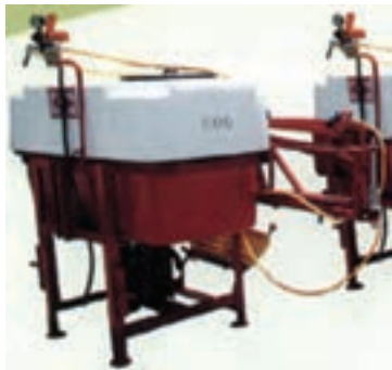
شکل ۱-۶- انواع دستگاه سم پاش