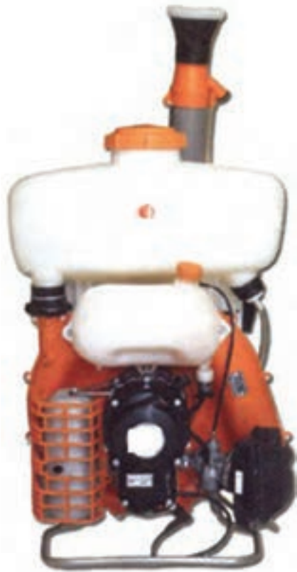
تصویر ۶-۶ - سم پاش پشتی موتوری