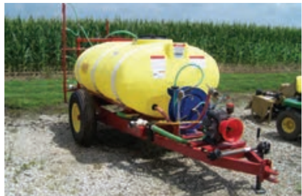
تصویر ۸-۶- سم پاش پشت تراکتوری

این سم پاش، بر روی شاسی سوارند و به تراکتور متصل می شوند. ظرفیت مخزن ۱۵۰ تا ۵۰۰ لیتر است (تصویر ۸-۶).