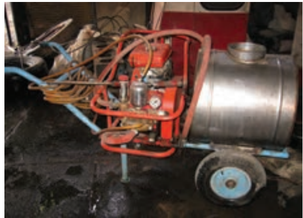
تصویر ۷-۶- سم پاش چرخ دار موتوری

۵- در صورتی که مدت زمان طولانی نیازی به استفاده از سم پاش ندارید، ۱ تا ۲ سانتی متر روغن موتور به درون سیلندر بریزید. لازم است قبل از گذاردن شمع، یک بار استارت را بکشید و رها کنید. به این ترتیب تمام سطح سیلندر روغن کاری می شود. هم چنین افشانک ها و فیلترها را باز کنید و در مکانی مطمئن قرار دهید.