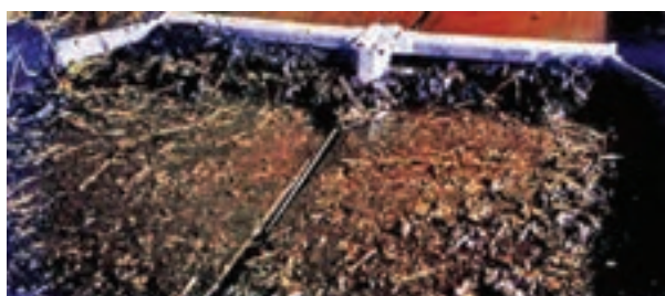
تصویر ۹-۷- تیغه‌ی جمع‌آوری کود