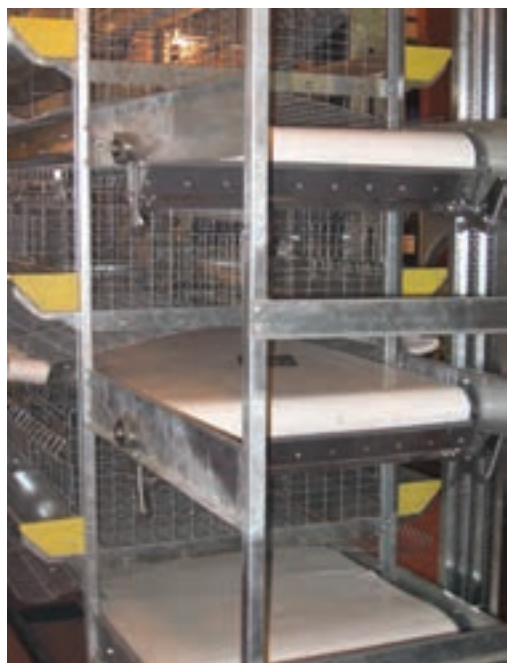
تصویر ۶-۷ انواع نوار نقاله