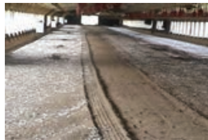
تصویر ۴-۷ تخلیه‌ی قسمتی از کود سالن پرورش به روش مکانیکی