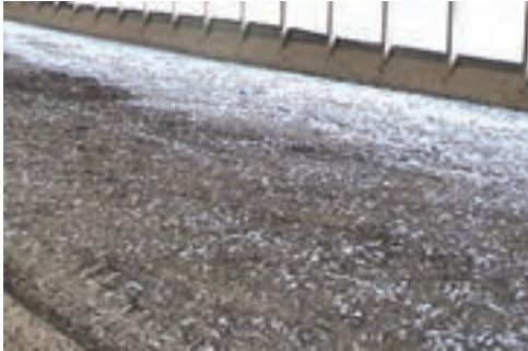
تصویر ۱-۷- کود ناخالص در پایان دوره‌ی پرورش

در پرورش طیور بر روی بستر، کود در پایان دوره توسط کارگران یا به صورت مکانیکی تخلیه می‌شود.