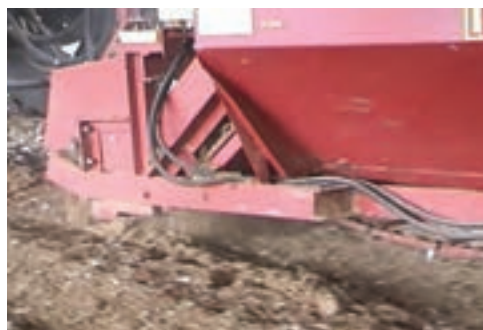
تصویر ۲-۷- جمع‌آوری کود با ماشین‌آلات مکانیکی

* فضولات تولیدی شامل مواد جامد، مایع و پرهاست.