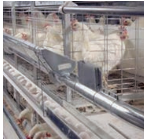
تصویر ۷-۸ - انتهای نوار نقاله در سالن