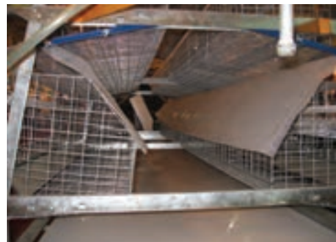
تصویر ۵-۷ صفحات مایل در زیر قفس

در سیستم قفس روش‌های متفاوتی وجود دارد اما دو روش اصلی جمع‌آوری کود به صورت دستی و خودکار است. ۱- دستی: در روش دستی از صفحات مایلی در زیر قفس استفاده می‌کنند. این صفحات سبب می‌شوند کود به راهروی بین قفس‌ها بریزد و سپس کارگران زیر قفس‌ها را با وسایل ابتدایی تخلیه می‌کنند.