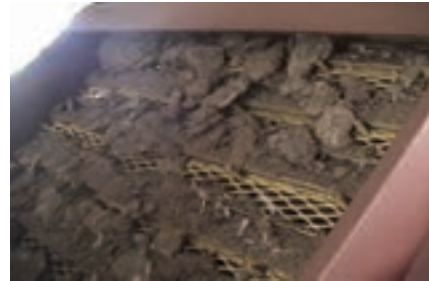
تصویر ۳-۷ کود در حال تخلیه از ماشین‌آلات مکانیکی

نوار نقاله: در قفس‌های دارای نوار نقاله، کود در زیر قفس بر روی صفحه‌ای از جنس پلاستیک ضخیم یا برزنت می‌ریزد. صفحه به صورت نوار بی‌انتهایی است که روزانه یک بار به حرکت درمی‌آید. در انتهای سالن روی هر نوار یک تیغه به صورت ثابت نصب شده است. تیغه کود را می‌تراشد و در چاله می‌ریزد.