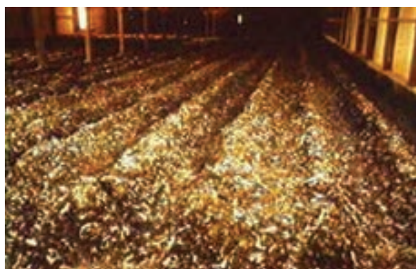
تصویر ۱۰-۷- جمع‌آوری کود در روش گودال عمیق

۳- هرگاه تیغه را بر روی ۵ متر تنظیم نمایید، تیغه از انتهای سالن حرکت می‌کند و تا ۵ متر جلو می‌آید، سپس در نقطه‌ی ۵ متر متوقف می‌شود و به عقب باز می‌گردد و تمام کودهای این فاصله را به داخل کانالی در عرض سالن می‌ریزد.