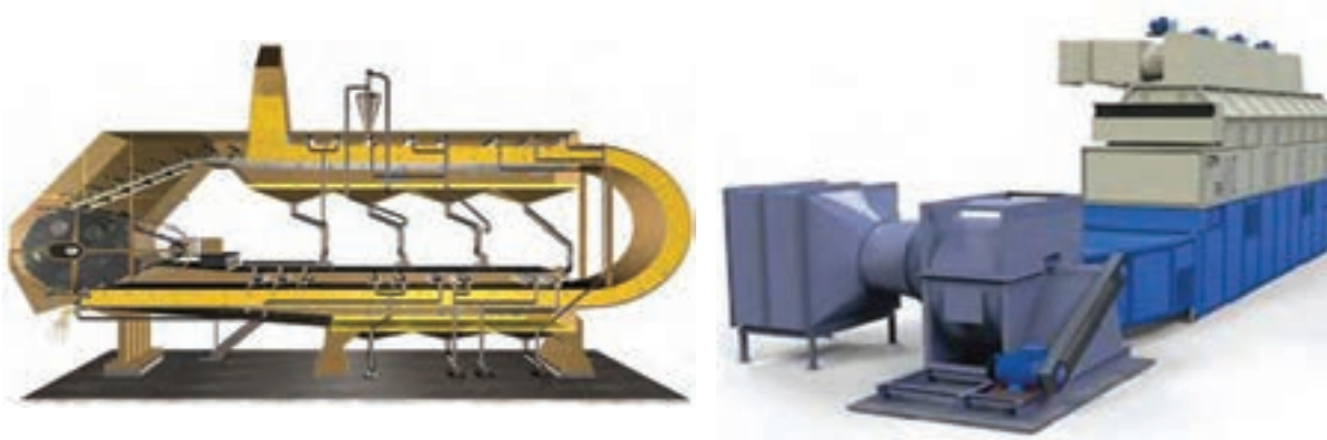
شکل ۸- اکستراکتور سبیدی

۱ اکستراکتورهای سبیدی: این دستگاه از نواری درست شده است که بر روی آن سبدهایی (توری‌هایی) با سوراخ ریز از جنس فولاد ضدزنگ قرار دارد. پرک دانه روغنی در روی توری‌ها ریخته شده و حلال روی آنها پاشیده می‌شود. (شکل ۸)