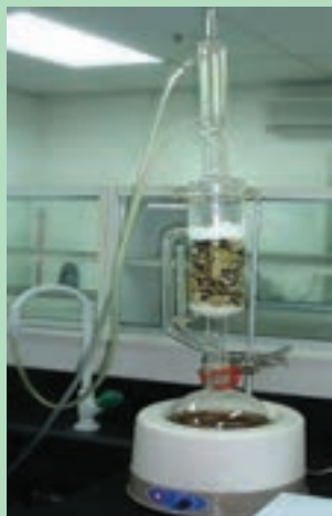
شکل ۱۰- دستگاه سوکسله