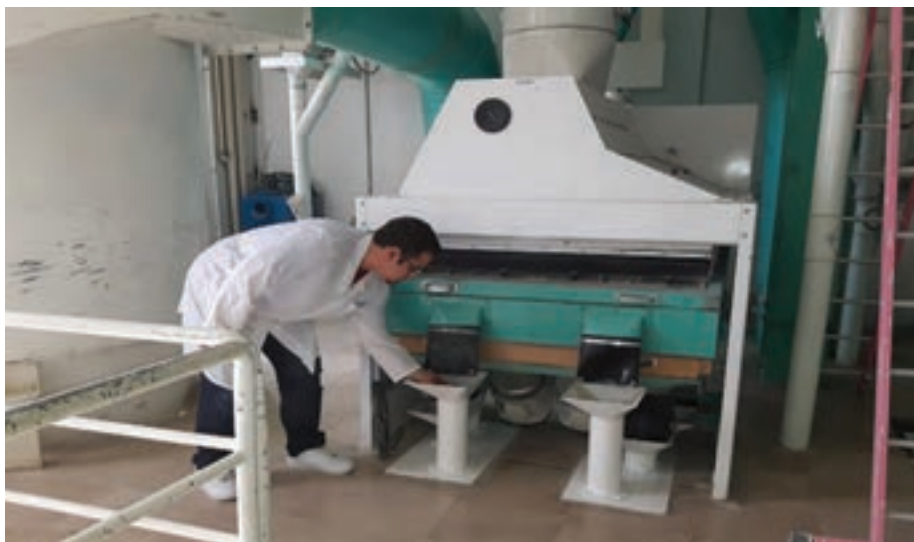
شکل ۶- دستگاه پوست‌گیری