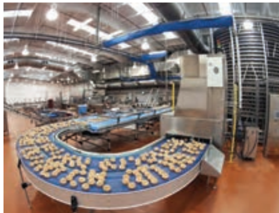
ورودی سرخ کن