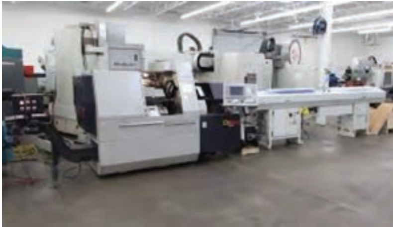
شکل ۹- دستگاه سلوفان پیچ

سلوفان پیچی: اولین مرحله بسته بندی است. تمامی برگرها و کباب لقمه ها در ابتدا سلوفان پیچ می شوند و دو قسمت سر و ته سلوفان با استفاده از دوخت حرارتی، بسته می شود.