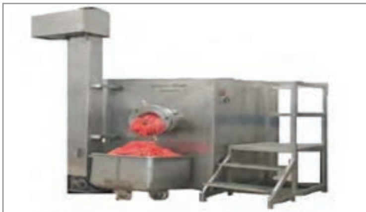
شکل ۵- دستگاه گیوتین چرخ گوشت