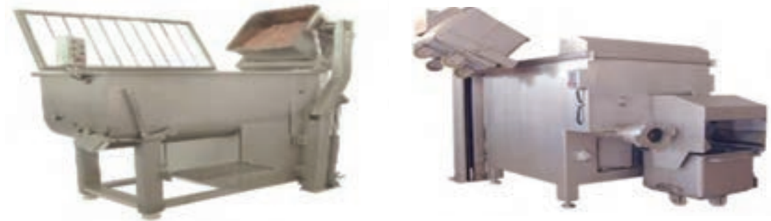
شکل ۶- میکسرهای مخصوص تولید همبرگر

چرا ادویه و نمک را با آرد سوخاری ترکیب کرده سپس به مواد دیگر اضافه می کنند؟