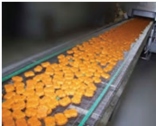
خروجی سرخ کن

پخت با بخار: ناگت مرغ پس از سرخ شدن در روغن، برای انجام پخت کامل از تونل پخت با بخار عبور می‌نماید یا درون اتاق پخت قرار داده می‌شود، به طوری که حداقل دمای مرکز محصول به ۷۲ درجه سلسیوس برسد. به این ترتیب محصول کاملاً پخته شده و آماده مصرف می‌شود.