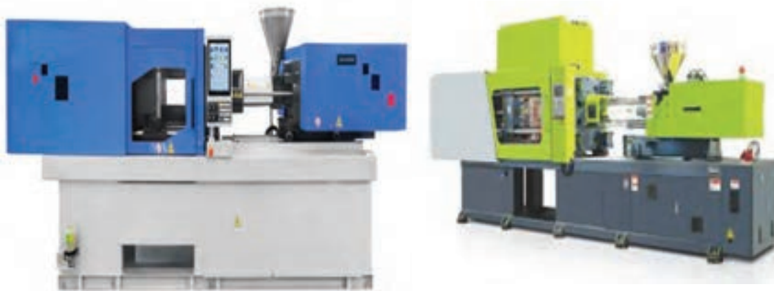
شکل ۷- دستگاه قالب زن برگر و کباب لقمه

معمولاً روی دستگاه‌های قالب زن یک افشانه آب تعبیه شده است که با پاشش آب به پشت قالب، باعث راحت جدا شدن همبرگر و یا کباب لقمه از قالب شده تا شکل ظاهری آن حفظ شود. بعد از اینکه یک‌سری از مواد قالب زده شدند، به صورت اتوماتیک یک لایه محافظ روی آنها قرار می‌گیرد. در پایان این مرحله دمای محصول تولید شده باید حدود ۵ درجه زیر صفر باشد. هر چقدر این دما به صفر و بالای صفر نزدیک‌تر شود احتمال تغییر شکل و کاهش انسجام بافت وجود دارد.