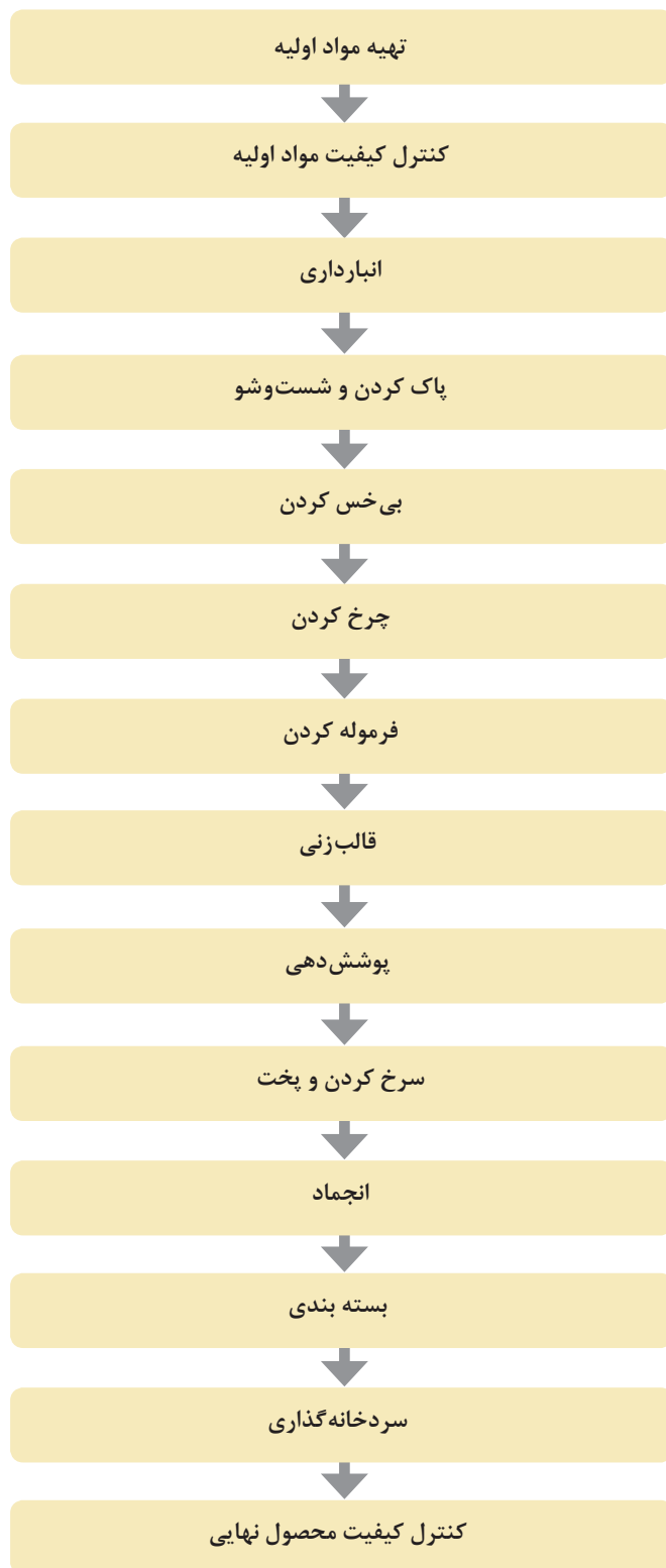
مراحل تولید ناگت مرغ