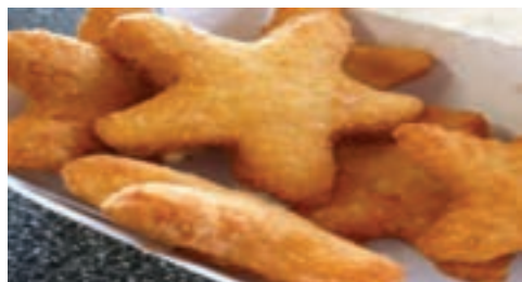
شکل ۱- ناگت مرغ

ناگت مرغ، محصولی است که از فراوری گوشت مرغ تهیه می‌شود و به صورت خام، نیمه پخته و پخته، منجمد می‌شود. همچنین این محصول در بازار به شکل‌های ناگت ساده، پنیری و با سبزیجات عرضه می‌شود.