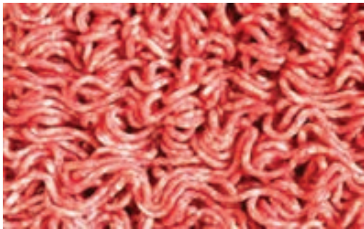
شکل ۲- گوشت چرخ کرده با ۲۰ درصد چربی

گوشت با ۲۰ درصد چربی بهترین گوشت برای تهیه برگرهای بدون سویا و کباب لقمه است. میزان چربی و پروتئین دو عامل مهم در انتخاب گوشت هستند. این دو نسبت عکس با هم دارند. بنابراین بعد از کنترل ظاهری گوشت، مقدار چربی آن از اهمیت زیادی برخوردار است. میزان چربی، پروتئین و رطوبت در قسمت‌های مختلف یک دام با هم متفاوت است. بنابراین پس از چرخ کردن و همگن کردن قطعه‌های بزرگ گوشت مهم‌ترین کار، تعیین میزان چربی آن است.