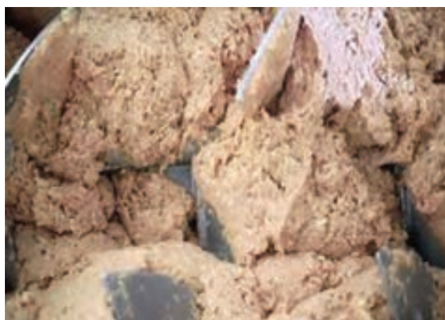
شکل ۲- اختلاط مواد در مخلوط‌کن

اختلاط در دستگاه مخلوط‌کن، باید به نحوی انجام پذیرد، که دمای محصول افزایش نیابد. در کارخانه‌ها، برای جلوگیری از بالا رفتن دمای محصول حین مخلوط کردن، از گوشت مرغ با دمای حدود ۱۰- درجه سلسیوس استفاده می‌شود.