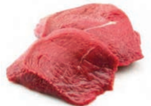
شکل ۴- گوشت مناسب برای تهیه برگر

گوشت باید از مراکز و واحدهای تولیدی مجاز تهیه شود که در همان محل قطعه بندی، شست و شو و بسته بندی شده و به صورت تازه و یا منجمد با مهر دامپزشکی وارد واحدهای تولید کننده فراورده های گوشتی می شود. بنابراین مرحله ای بنام شست و شوی گوشت در واحدهای تولید فراورده های گوشتی وجود ندارد. گوشت ورودی اگر تازه باشد، ابتدا در سردخانه قرار می گیرد تا دمای آن به حداقل ۱۰ درجه زیر صفر برسد. سپس با چرخ گوشت زیر صفر، چرخ می شود و بعد داخل وان قرار گرفته و سطح آن را با نایلون پوشانده و در سردخانه بالای صفر (حدود ۴ درجه سلسیوس) تا زمان مصرف نگهداری می کنند.