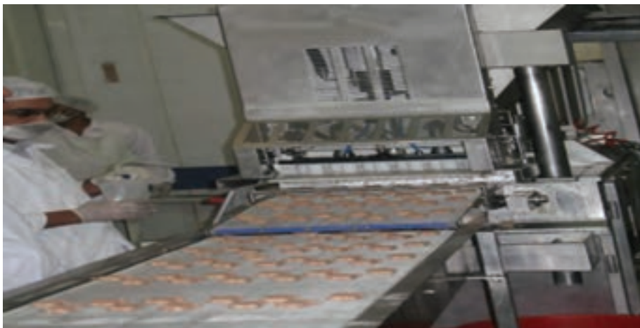
شکل ۳- دستگاه قالب زن ناگت