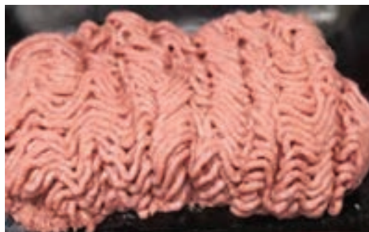
شکل ۱- گوشت چرخ کرده با ۳۰ درصد چربی

چرا برای برگرهای سویا دار (همبرگر ۳۰ درصد گوشت) میزان چربی گوشت اولیه باید بیشتر باشد؟