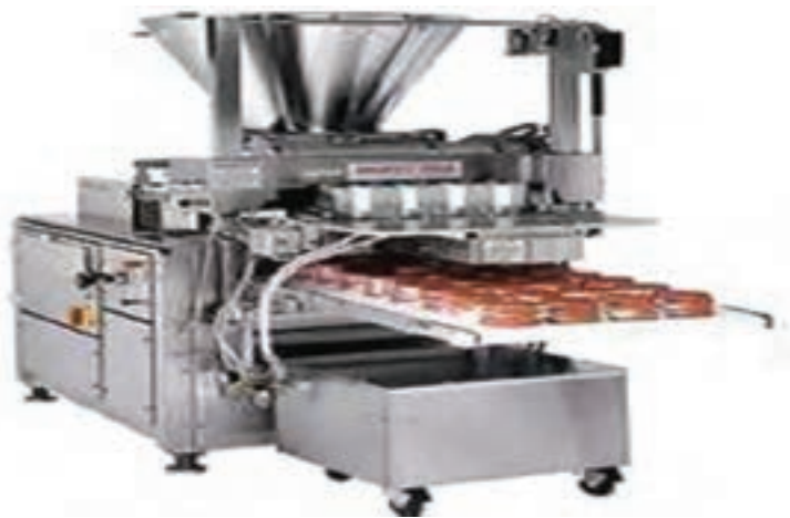
شکل ۸- دستگاه سه کاره پرکن، قالب زن و لایه گذار