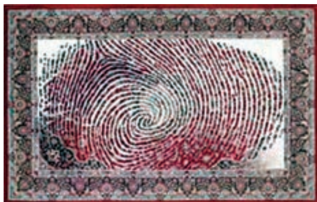
شکل ۱-۲- هویت در فرش

تاکنون برنامه‌های سازمان‌یافته متعددی برای همه‌گیر کردن تولید فرش به همراه شناسنامه به صورت یکسان صورت گرفته است. آیا می‌دانید شناسنامه فرش دارای چه مزایایی است؟ آیا می‌دانید برای ترویج تولید و عرضه فرش به همراه شناسنامه آن چه موانعی وجود دارد؟ اکنون تصویر زیر چه چیزی را در ذهن شما تداعی می‌کند؟