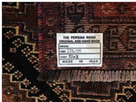
شکل ۱۱-۳- نگارش فهرست عدل بندی

۳ ابعاد اولیه توسط عدل بند با متر اندازه گیری می شود و به نگارنده فهرست اعلام می گردد. سپس محاسبات مساحت و تعیین ارزش گمرکی فرش و محاسبات ارزش کل هر فرش انجام می شود.