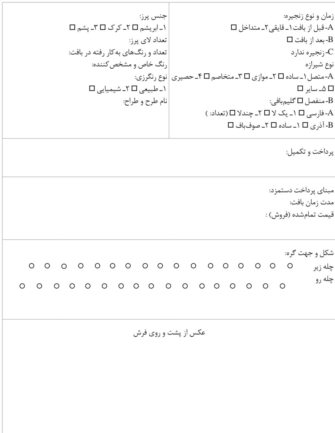
شکل ۵-۳- پرونده کلی برای تهیه شناسنامه فرش