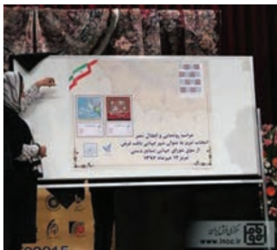
شکل ۳-۳- ثبت تبریز به عنوان شهر جهانی فرش

بسته به اینکه شناسنامه فرش با چه هدفی تهیه گردد می‌توان محتویات آن را مشخص کرد. از این‌رو همه معیارهای فرهنگی، ارزشی، اقتصادی و اجتماعی (مصرفی) برای شناسنامه فرش ایرانی مدنظر است. فرایند تهیه شناسنامه برای افراد یا استانداردهای برندسازی الگوهای مناسبی برای تعیین ویژگی‌های مندرج در شناسنامه فرش است.