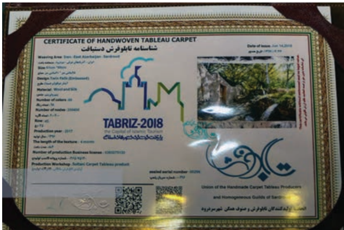
شکل ۲-۳. ثبت شناسنامه به نام یکی از شهرهای قالی‌بافی ایران در سال ۱۳۹۷

در مورد فرش دستباف، حفظ هویت ایرانی و زمینه‌سازی لازم برای جلوگیری از جعل آن توسط کشورهای رقیب و همچنین اطمینان خاطر دادن به مشتریان در هنگام خرید از اهداف اصلی است. چرا که حق مشتری است که بداند هزینه‌ای که برای خرید کالا پرداخت می‌نماید برای چه کالایی و با چه مشخصاتی است. خصوصاً در مورد فرش، که علاوه بر مصرفی بودن، کالایی هنری و سرمایه‌ای نیز محسوب می‌گردد. بسته به اینکه شناسنامه فرش با چه هدفی تهیه گردد می‌توان محتویات آن را مشخص کرد. از این رو معیارهای فرهنگی و ارزشی، اقتصادی و اجتماعی (مصرفی) برای شناسنامه فرش ایرانی همگی مدنظر هستند. فرایند تهیه شناسنامه برای افراد یا استانداردهای برندسازی الگوهای مناسبی برای تعیین ویژگی‌های مندرج در شناسنامه فرش هستند.