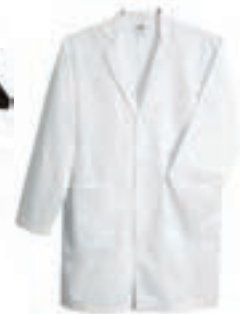
۱. روپوش سفید