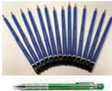
۷. مداد HB و مداد نوکی HB (۰/۵)