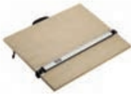
۴. تخته رسم