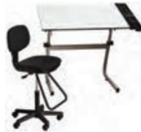
۲. میز و صندلی نقشه کشی