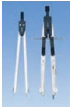
۱۱. پرگار معمولی و پرگار انتقال اندازه