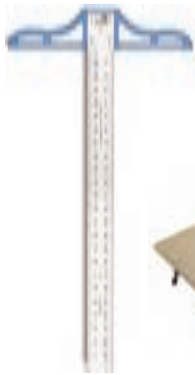
۵. خطکش تی