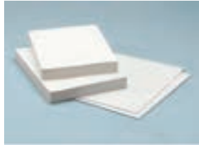
۳. کاغذ A۳ و A۴