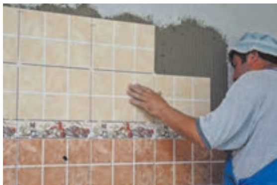
شکل ۴ ▲

در این روش ملات خمیری ماسه و سیمان را در پشت کاشی قرار داده و به دیوار می چسبانند. همان طور که گفته شد از این روش بیشتر برای رچ های آخر که امکان دوغاب ریزی نداشته و نیز زیر سقف ها استفاده می شود. لازم به توضیح است که اگر بخواهند از این روش در کارهای نو همانند زیر سقف ها استفاده نمایند ابتدا باید سطح زیر کار را با اندود ماسه و سیمان هموار نموده، پس از خشک شدن اندود، به نصب کاشی ها اقدام گردد.