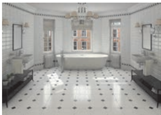
شکل ۲ ▲