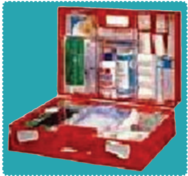
جعبه کمک‌های اولیه