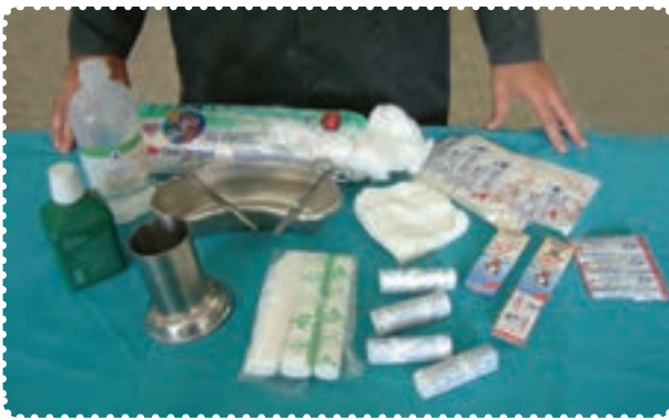
وسایل مورد نیاز در جعبه‌ی کمک‌های اولیه

در حرفه‌های گوناگون استفاده از ابزارها و مواد اولیه همواره می‌تواند برای افراد خطرهایی به وجود بیاورد. استفاده‌ی صحیح و داشتن دقت فراوان هنگام کار، این خطرها را از بین برده و فرد در امان خواهد بود. به همین دلیل لازم است در محیط کارگاه برای جلوگیری از خطرهایی احتمالی به موارد زیر دقت داشته باشید. ۱- در مواقع ضروری از جعبه کمک‌های اولیه‌ی کارگاه استفاده کنید.