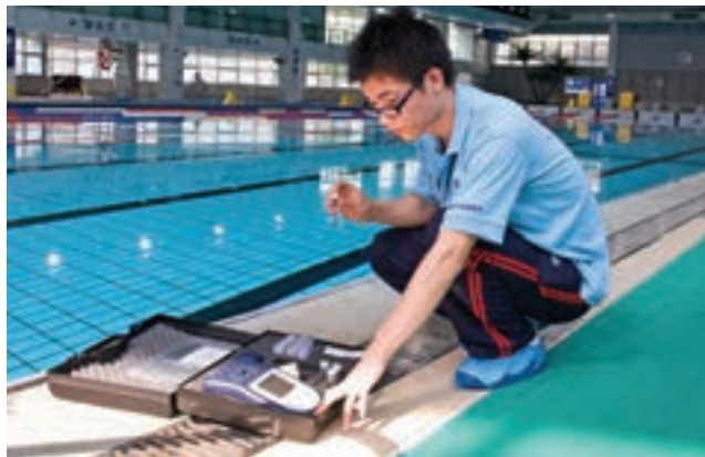
شکل ۶- نمونه برداری از آب استخر

فعالیت ۴: در گروه‌های کلاسی، در مورد انواع روش‌های تصفیه آب استخرها به ویژه روش‌های گندزدایی آب از منابع معتبر علمی جست‌وجو کنید و نتیجه را در کلاس به صورت بروشور ارائه دهید.