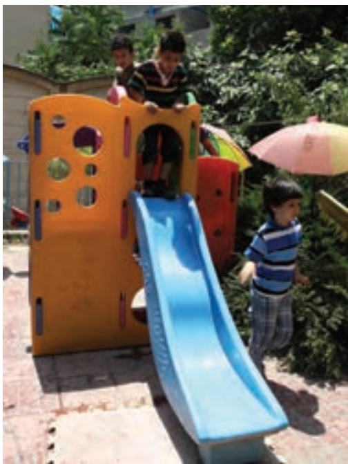
شکل ۶- بازی کودکان در فضای باز مهد کودک