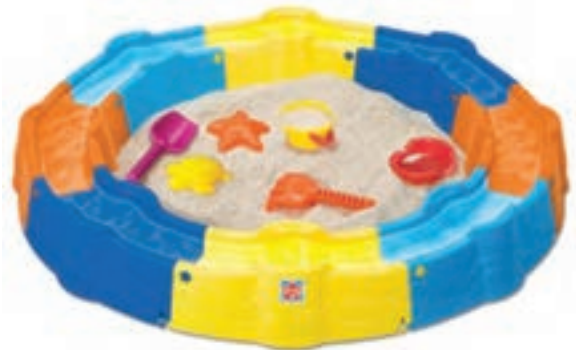
شکل ۲- وسایل و فضای شن‌بازی کودکان

تعریف فضای شن بازی: به فضایی شامل جعبه شن، حوض ساده کم‌عمق، سطل پلاستیکی، بیل و بیلچه و وسایل بازی که برای بازی کودکان با شن طراحی می‌شود، فضای شن‌بازی گفته می‌شود. درون ظرف با شن شسته پر می‌شود (شکل ۲).