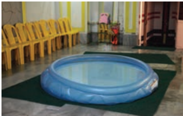
شکل ۲- استخر شنای کودکان خردسال