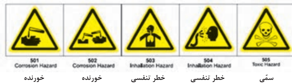
شکل ۶- علائم اخطار بر سموم

■ برای جلوگیری از آلودگی افراد و نیز محیط زیست باید توجه نمود که ظروف خالی آفت کش ها در محیط باز رها نشوند و به روش بهداشتی دفع شوند.