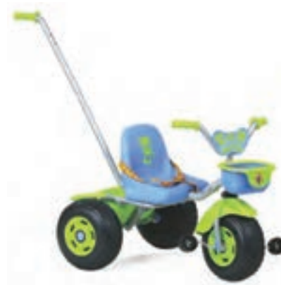
شکل ۵- سه چرخه