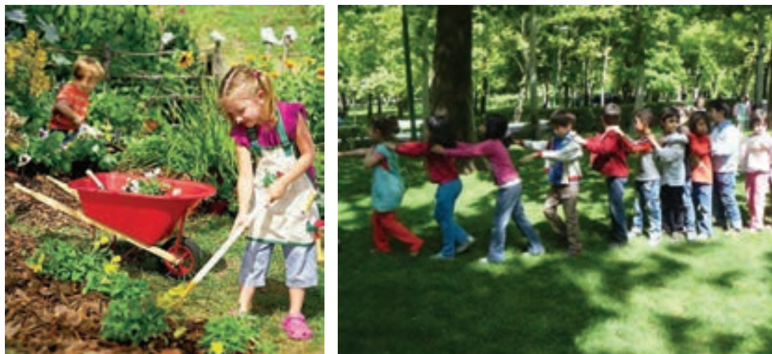
شکل ۱- بازی کودکان در فضای سبز

تحقیقات جدید دانشمندان نشان می‌دهد تماس با فضای سبز شهری به کودکان کمک می‌کند که رشد ذهنی خود را شکوفا کنند و اینکه بخشی از این تأثیر به دلیل اثر فضای سبز در کاهش آلودگی شهری است.