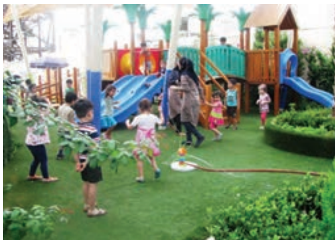
شکل ۲- فضای باز مراکز پیش از دبستان