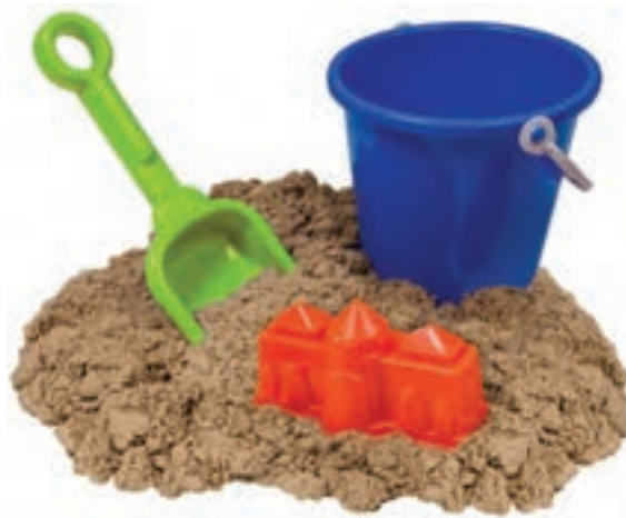
شکل ۴- وسایل شن‌بازی کودکان

فعالیت ۳: در گروه‌های کلاسی، با توجه به تصویر بالا، در مورد ایجاد فضای شن‌بازی و بهداشت آن گفت‌وگو کنید و نتیجه را در کلاس ارائه دهید.