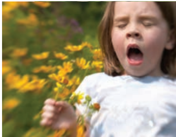
شکل ۴- حساسیت به گیاهان در کودکان