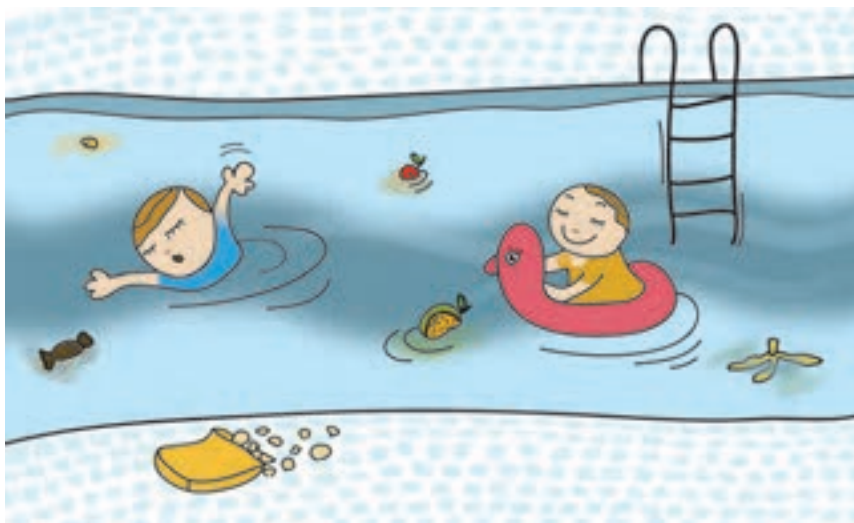
شکل ۳- آلودگی استخر

فعالیت ۲: در گروه‌های کلاسی، با توجه به تصویر بالا در مورد انواع آلودگی‌ها و بیماری‌های ناشی از استخر گفت‌وگو کنید و نتیجه را در کلاس ارائه دهید.