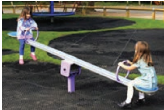
شکل ۴- الاکلنگ

تجهیزات نوسانی یا الاکلنگ: تجهیزاتی هستند که می‌توانند توسط استفاده کننده به حرکت درآیند و عموماً توسط یک جزء که حول یک تکیه‌گاه مرکزی نوسان می‌کند، قرار می‌گیرند (شکل ۴). انواع الاکلنگ شامل نوع محوری، یک نقطه‌ای، چند نقطه‌ای، نوسانی و جارویی است.