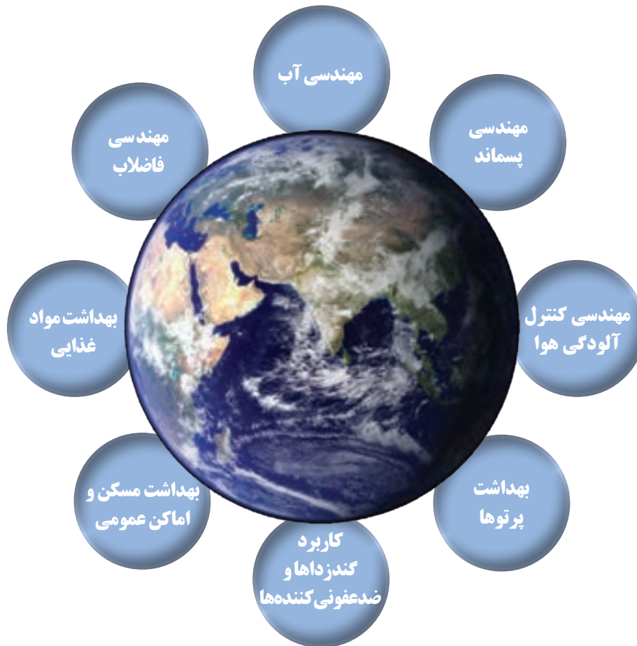
شکل ۱- بهداشت محیط

فعالیت ۱: با توجه به تصویر بالا، در گروه‌های کلاسی در مورد نقش و هدف بهداشت محیط در جامعه گفت‌وگو کنید و نتیجه را در کلاس ارائه دهید.