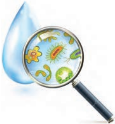
شکل ۴- میکرو ارگانیسم‌های آب استخر

ب) آلودگی‌های شیمیایی: آلودگی شیمیایی آب استخرهای شنا شامل مواد شیمیایی مورد استفاده در تصفیه آب استخر مثل کلر و نیز مواد حاصل از واکنش این مواد، به خصوص گندزداها با مواد آلی و معدنی موجود در آب خام، ایجاد می‌شود. هرچه مواد دفعی آزاد شده از شناگران شامل ترشحات بینی، حلقی و پوستی، کرم‌ها، پمادها و غیره در آب بیشتر باشد، احتمال حضور آلاینده‌های شیمیایی بیشتر است. ج) آلودگی‌های میکروبی: استخرهای خصوصی و عمومی محل مناسبی برای رشد میکرو ارگانیسم‌های بیماری‌زایی هستند که توسط برخی شناگران به آب منتقل می‌شوند و در داخل آب رشد و تکثیر می‌نمایند؛ بنابراین افرادی که دچار بیماری هستند، نباید به این مکان‌ها رفت‌وآمد کنند (شکل ۴).