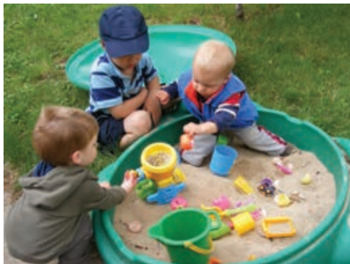
شکل ۶- فضای شن بازی کودکان

فعالیت ۵: در گروه‌های کلاسی، با توجه به تصویر بالا، در مورد آلودگی فضای شن بازی و آب بازی و روش‌های از بین بردن این آلودگی‌ها گفت‌وگو کنید و نتیجه را در کلاس ارائه دهید.