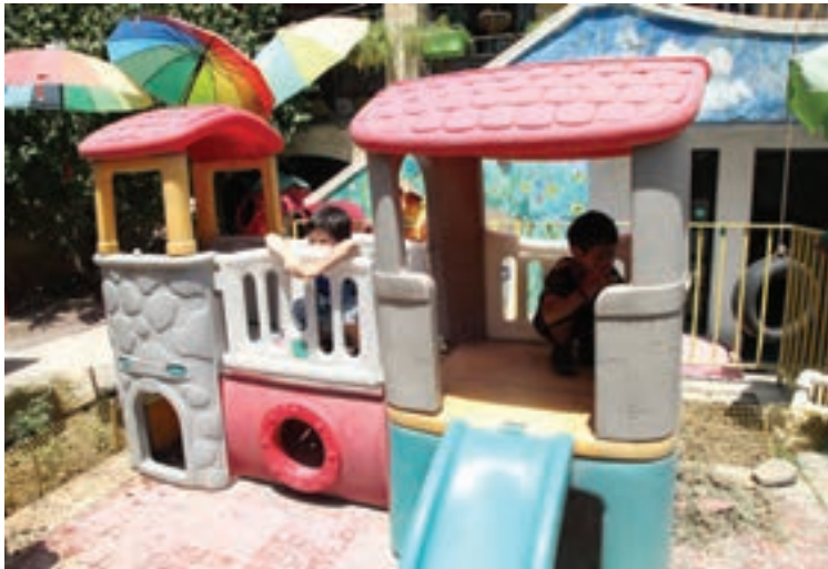
شکل ۶ - بهداشت در فضای باز مرکز آموزشی