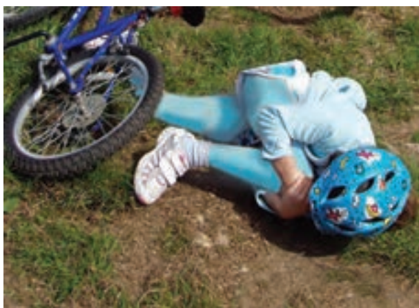
شکل ۳- خطرات فضای سبز

فعالیت ۲: در گروه‌های کلاسی با توجه به تصویر صفحه قبل، در موارد زیر گفت‌وگو کنید و نتیجه را در کلاس ارائه دهید.