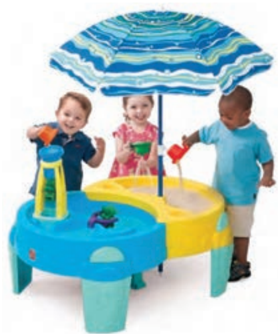
شکل ۳- فضای آب بازی کودکان

تعریف فضای آب بازی: به فضایی شامل تشت بزرگ، استخر کوچک پلاستیکی یا وان، آبپاش، بطری، عروسک و وسایل بازی که برای بازی کودکان با آب طراحی شده است، فضای آب بازی گفته می‌شود (شکل ۳).