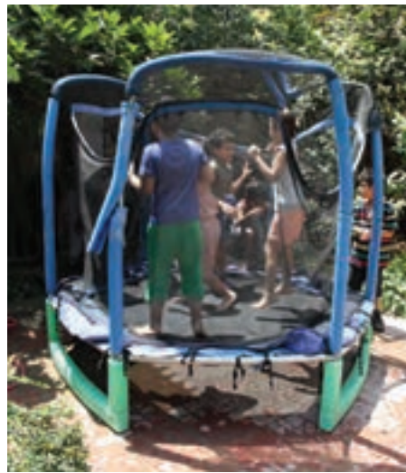
شکل ۵ - فضای ورزشی و فضای سبز

۱-۲- هدف توانمندسازی: بهداشت سطح فضای باز و حیاط را کنترل کند.