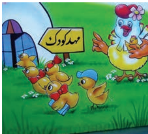
شکل ۴- درب ورودی مرکز پیش از دبستان