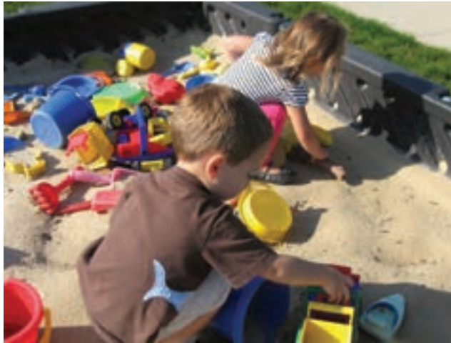
شکل ۱- شن بازی کودکان

فعالیت ۱: در گروه‌های کلاسی، با توجه به شکل ۱ در مورد بهداشت فضای شن بازی و آب بازی کودکان گفت‌وگو کنید و نتیجه را در کلاس ارائه دهید.