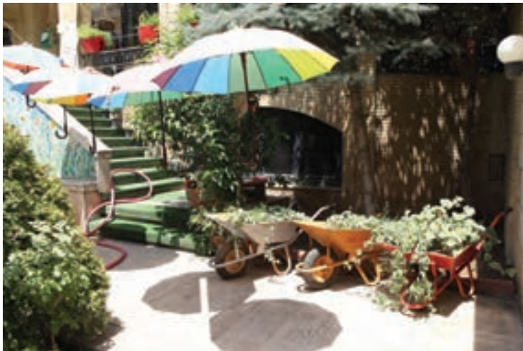
شکل ۲- بهداشت فضای سبز و باغبانی