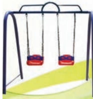
شکل ۳- تاب بازی