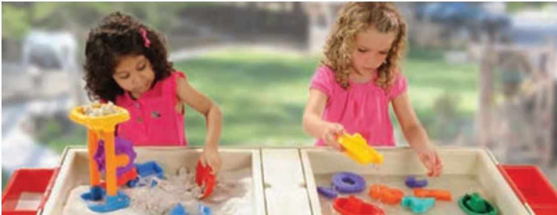
شکل ۷- فضای بهداشتی برای شن‌بازی و آب‌بازی کودکان

فعالیت ۶: در گروه‌های کلاسی، با توجه به تصویر بالا، در مورد روش‌های نگهداری فضای شن‌بازی و آب‌بازی گفت‌وگو کنید و نتیجه را در کلاس ارائه دهید.