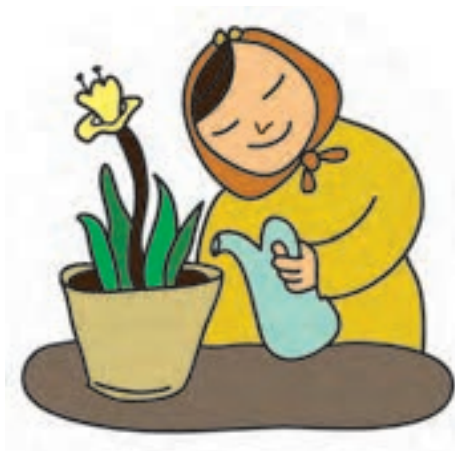
شکل ۵- کودک و نگهداری فضای سبز

برای رعایت بهداشت و نگهداری فضای سبز باید به نکات زیر توجه کرد (شکل ۵):