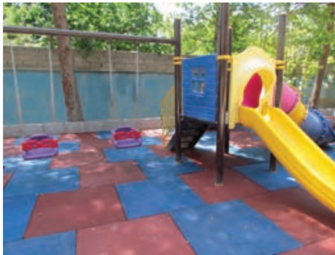
شکل ۱- وسایل بازی فضای باز مراکز پیش از دبستان

فعالیت ۱: در گروه‌های کلاسی، با توجه به تصویر بالا، در مورد اهمیت بازی و انواع وسایل بازی کودکان گفت‌وگو کنید و نتیجه را در کلاس ارائه دهید.