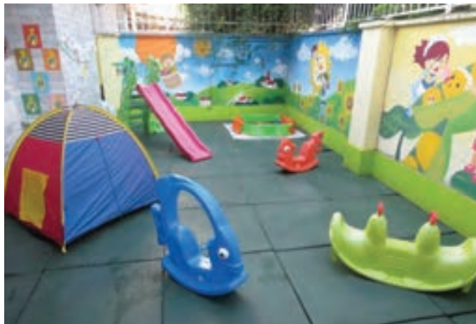
شکل ۳- وسایل بازی در فضای باز مراکز پیش از دبستان

فعالیت ۳: در گروه‌های کلاسی، در مورد اهمیت بهداشت وسایل بازی در فضای باز گفت‌وگو کنید و نتیجه را در کلاس ارائه دهید.