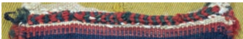
نمونه سربندی قایقی تصویر ۲-۳ ▲

در هنگام تمام شدن پود رنگی در میانه بافت، پود رنگی جدید روی کدام چله درگیر می شود؟ چرا؟