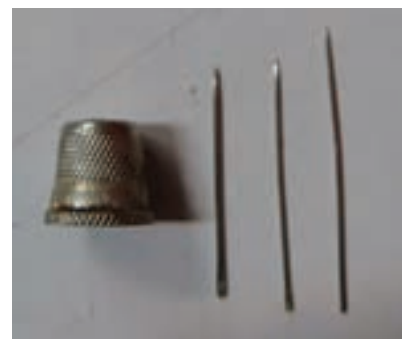
انواع سوزن و انگشتانه تصویر ۳-۴ ▲

سفید برای قسمت های تیره کار از روی طرح، نقش ها را با دست بر روی زمینه گلیم منتقل می کنند. ۳- پس از پایان انتقال طرح بر زمینه گلیم بافته شده، نقش ها در جاهای مختلف (از نظر کامل بودن و صحیح بودن انتقال)، کنترل می شوند (تصویر ۳-۵).