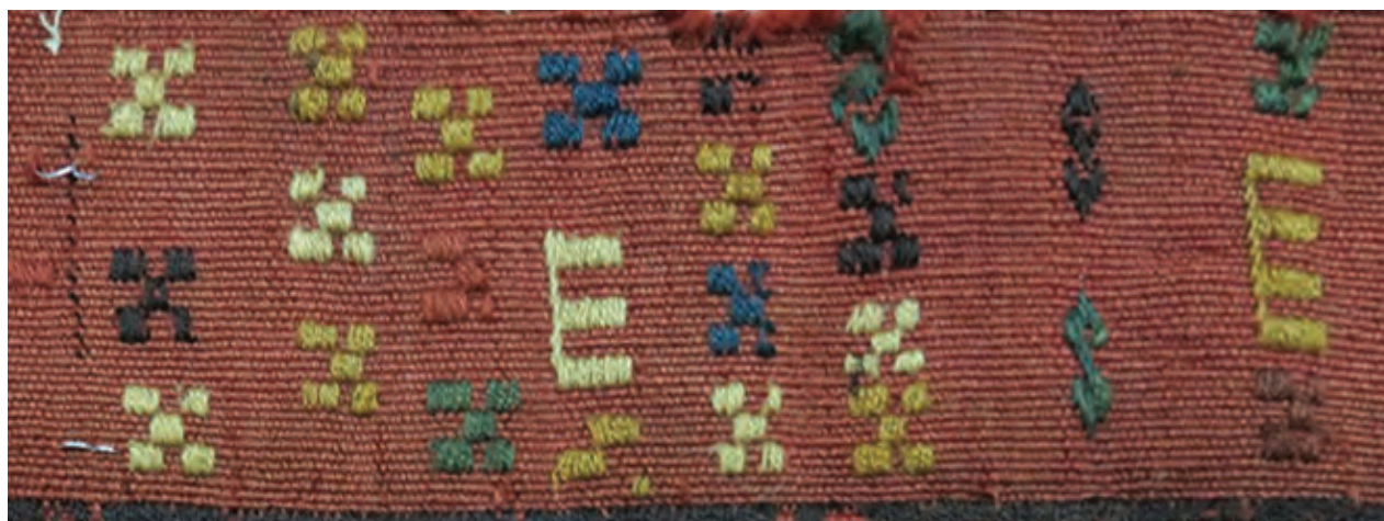
نقش‌های رنگارنگ و متنوع در بخشی از یک گلیم سوزنی تصویر ۹-۳ ▲

- برای دوخت نقوش مجاور هم رنگ، می‌توان پود را از پشت کار از یک نقش به نقش دیگر به شکل عبوری گذرانید. - انتهای پودهای رنگی را پس از دوخت قایقی و تمام شدن نقشه در پشت کار، رها می‌کنند و گره می‌زنند. - اگر جهت دوختن رج‌ها از یک سمت انجام شود دیگر فرم جناغی ایجاد نمی‌شود. اما اگر رفت و برگشت از دو جهت باشد، فرم جناغی شکل می‌گیرد.