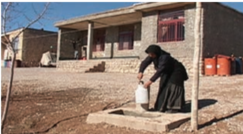
شکل ۱۵-۲- نوسازی روستاها در استان - سمیرم