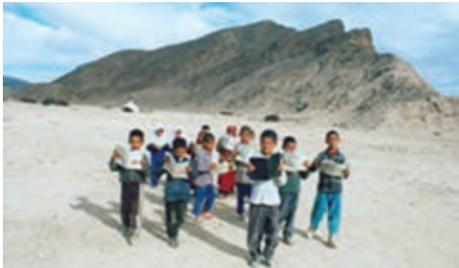
شکل ۱۸-۲- دانش آموزان کوچ نشین