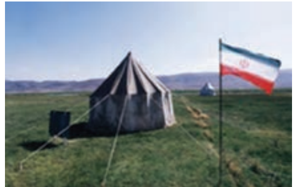
شکل ۱۷-۲- مدرسه کوچ نشینان