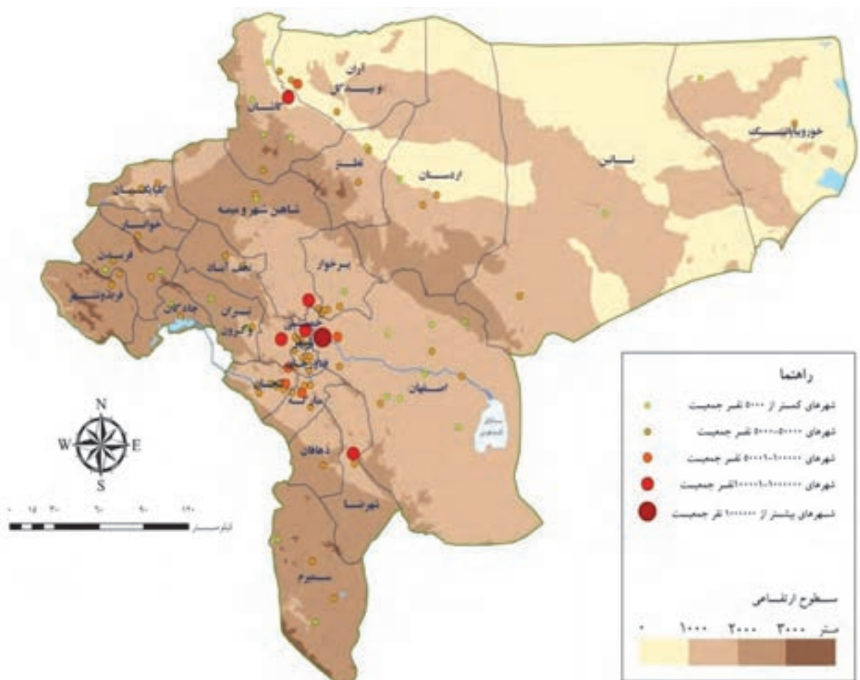
شکل ۲-۶- نقشه پراکنندگی سکونتگاه‌های شهری استان اصفهان