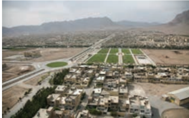
شکل ۱۱-۲- بافت جدید شهری (منظرهٔ خمینی شهر)