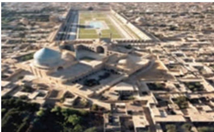
شکل ۲-۳- میدان امام (نقش جهان) - وضعیت کنونی