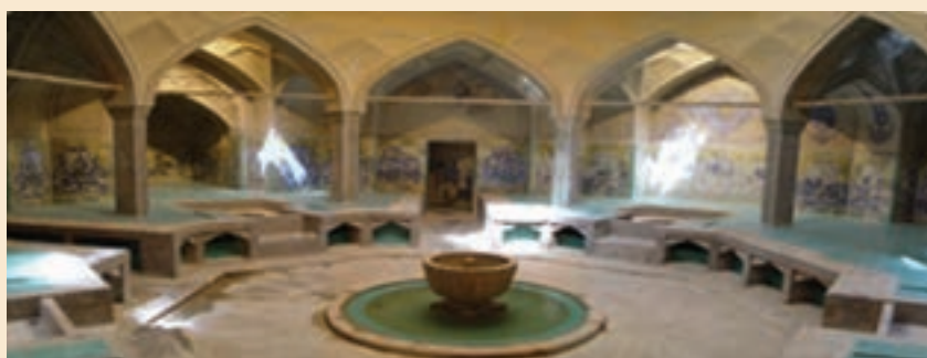
شکل ۲-۸- سربینة حمام علیقلی آقا، هر بخش متعلق به طبقه اجتماعی خاصی بوده است.