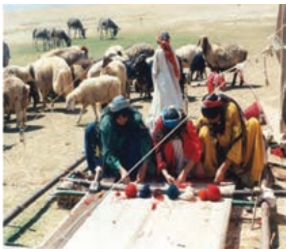
شکل ۲۱-۲ نقش بسیار چشمگیر زنان در زندگی کوچ‌نشینان