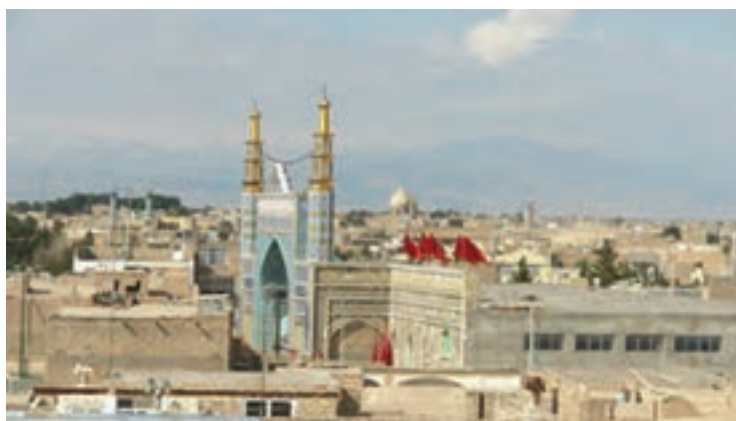
شکل ۲-۵- شهرستان آران و بیدگل