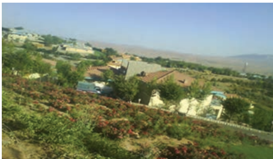
شکل ۴-۲- دهکده تفریحی جادگان

سرد این نواحی همراه با کمبود زمین‌های هموار، طولانی بودن روزهای یخبندان، مشکلات حمل و نقل و ... محدودیت‌هایی برای شهرنشینی و گسترش شهرها در این ناحیه ایجاد کرده است. از سوی دیگر بهره‌گیری از نقش بیابانی و قابلیت‌های استراحتگاهی به ویژه در سال‌های اخیر به عنوان یکی از مناسب‌ترین فعالیت‌ها برای شهرهای کوهستانی محسوب می‌شود؛ مانند ایجاد دهکده تفریحی در جادگان.