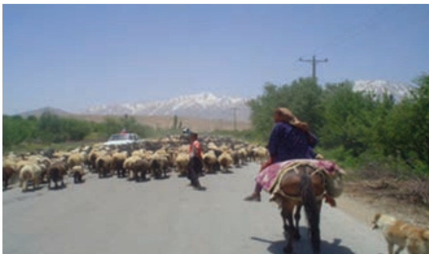
شکل ۱۶-۲- زندگی کوچ‌نشینی در استان اصفهان

کوچ‌نشینان مردمانی هستند که با کمترین هزینه‌های اقتصادی، بیشترین تولید و فایده اقتصادی را برای کشورمان دارند.