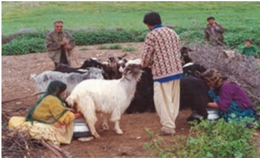
شکل ۱۹-۲- دامداری، مهم ترین فعالیت کوچ نشینان

کوچ نشینان استان اصفهان طبق آمار سال ۱۳۸۷ با جمعیتی بالغ بر ۹۶۰۵ خانوار و ۵۲۹۸۴ نفر از سه ایل قشقایی، بختیاری و عرب جرقویه تشکیل شده اند که با داشتن ۱۲۷۶۰۰۰ رأس دام از ۱/۴ میلیون هکتار مراتع استان بهره برداری می کنند. در دهه های اخیر، از جمعیت کوچ نشین استان کاسته شده و بیشتر آنان در شهرها و روستاهای مجاور مناطق بیلاقی مانند سمیرم، شهرضا، فریدونشهر و فریدن ساکن شده اند و این روند همچنان ادامه دارد. با توجه به مطالعات صورت گرفته، اغلب کوچ نشینان تمایل به یکجانشینی و اسکان دارند؛ زیرا خدمات رسانی به کوچ نشینان اسکان یافته بسیار آسان تر و با هزینه کمتری امکان پذیر است. ورود فتاوری های جدید مانند خودرو و وسایل ارتباط جمعی، تغییراتی را در شیوه زندگی و کوچ این مردم ایجاد کرده است؛ برای مثال، آنان ترجیح می دهند برای کوچ به جای طی کردن، راه های بسیار خطرناک و طولانی، از کامیون برای حمل دام و اسباب و اثاثیه خود استفاده کنند.