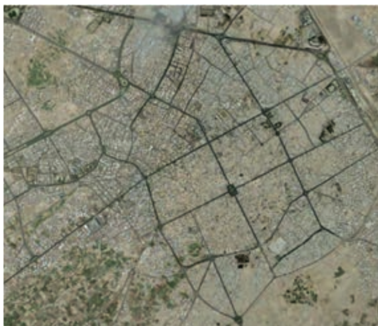
شکل ۱۰-۲- بافت شطرنجی شهر کاشان

در صد سال اخیر، همزمان با ورود وسایل نقلیه موتوری، ایجاد خیابان‌های متقاطع و شطرنجی، افزایش جمعیت و رشد شهرنشینی، مصرف‌گرایی، ورود الگوهای شهرسازی غیربومی، سیمای شهرهای اصفهان دگرگون شد و در اغلب آن‌ها بافت غیربومی در کنار بافت اصیل و سنتی حالتی دوگانه را به وجود آورد. در این شهرها، منطقه‌بندی جدید موجب کمرنگ‌شدن نقش محله‌ها شد.