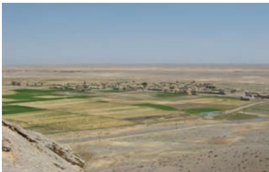
شکل ۱۳-۲- روستایی در منطقه جرقویه، این روستا چه شکلی دارد؟