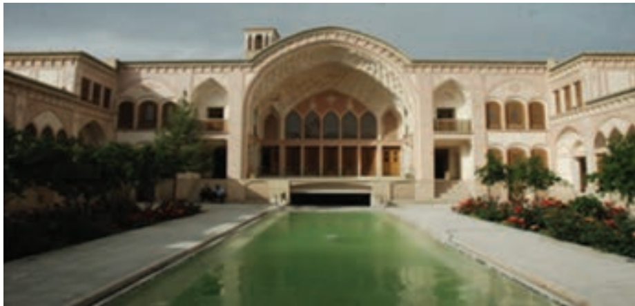
شکل ۹-۲- کاشان شهر خانه‌های بی‌نظیر با کارایی، زیبایی و هندسه شگفت آور

خانه‌ها به عنوان فراوان‌ترین عنصر شهری به گونه‌ای ساخته می‌شدند که بیشترین هماهنگی را با محیط طبیعی و فرهنگی خود دارا باشند. در طراحی آنها، استفاده از پدیده‌های اقلیمی مانند باد، خورشید و ... به خوبی در نظر گرفته می‌شد تا خانه با مصرف حداقل انرژی در تابستان و زمستان، شرایط مناسبی را برای زیستن ساکنانش فراهم آورد. توجه به خلوت (عدم اشراف دیداری و شنیداری نسبت به همسایگان و درون‌گرایی ساختمان)، زیباسازی (استفاده از باغچه، حوض آب، گچ‌بری، شیشه‌های رنگارنگ، آینه کاری و ...)، تفکیک فضای خصوصی، تفکیک فضای زمستانی و تابستانی و اختصاص هر فضا به کاربری خاص، از موارد دیگری بود که در ساخت خانه‌ها به آن توجه می‌شد.