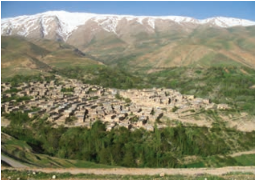
شکل ۱۴-۲- روستای کوهستانی در سمیرم

۲- به نظر شما چه تفاوتی بین شکل و فعالیت‌های اقتصادی روستا در این نواحی وجود دارد؟