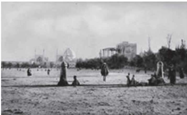
شکل ۲-۲- میدان امام (نقش جهان) در ۱۵۰ سال قبل