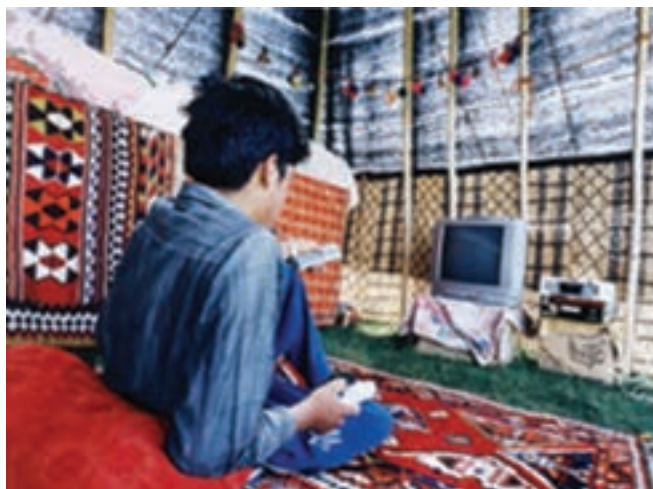
شکل ۲۰-۲ ورود فناوری ارتباطی در زندگی کوچ‌نشینان

با توجه به جدول ۱-۲ می‌توان محلّ گذران تابستان و زمستان کوچ‌نشینان استان را به تفکیک استان و شهرستان مشاهده کرد.