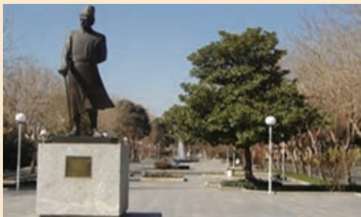
شکل ۲-۷- تندیس استاد علی اکبر اصفهانی یکی از سازندگان شهر اصفهان در زمان صفویه

شکل‌گیری اصفهان جدید: اصفهان در زمان شاه عباس اول به پایتختی ایران انتخاب شد و در معماری آن آمیزه‌ای از باغات متعدد، مادی‌های فراوان، پل‌های چند منظوره، کاخ‌ها، مساجد بزرگ و زیبا، مدارس، بازار، خیابان‌های وسیع و ... و بارعایت اصول مکان‌گزینی بهینه، زیباشناختی، پایداری شهر، حفظ مسائل زیست محیطی و حفظ بافت قدیم در کنار بافت جدید شکل گرفته است. بزرگانی چون شیخ بهایی و استاد علی اکبر اصفهانی که خود برنامه‌ریز، فیلسوف، عارف، معمار و شهرساز بوده‌اند، در طراحی و ساخت چنین فضاهایی نقش اصلی را به عهده داشته‌اند.