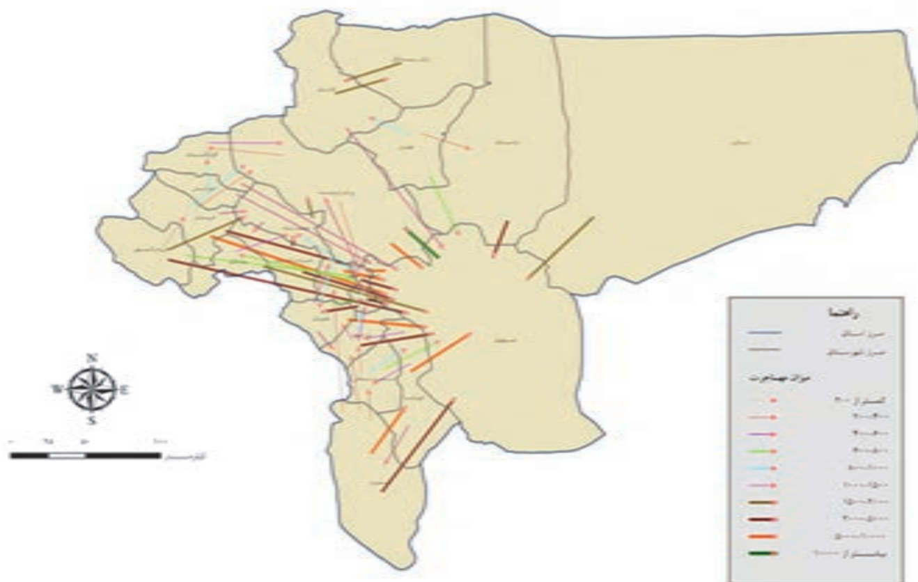
شکل ۲۵-۲- نقشه میزان مهاجرت بین شهرستان‌های استان

با آن که در طول سال‌های ۸۵ - ۱۳۴۵ استان اصفهان همواره مهاجرپذیر بوده است اما مقایسه شهرستان‌های مختلف نشان می‌دهد که وزن آنها در پذیرش مهاجر یکسان نیست. در فاصله سال‌های ۸۵ - ۱۳۷۵ شهرستان برخوار و میمه بیشترین مهاجرپذیری را به خود اختصاص داده و البته سایر مناطق صنعتی استان نیز عمدتاً مهاجرپذیر بوده‌اند. در مقابل، مناطق کوهستانی (به‌ویژه فریدون‌شهر و فریدن) و مناطق حاشیه بیابان و کویر مهاجرفرست بوده‌اند؛ چرا؟