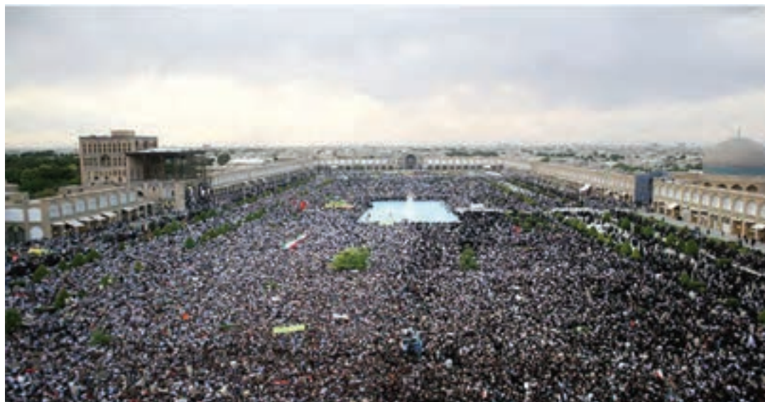
شکل ۲۴-۲- انبوهی جمعیت در میدان امام (نقش جهان) اصفهان