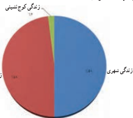
شکل ۲-۲- نمودار شیوه زندگی در هرمزگان در سال ۱۳۸۵ برحسب درصد

دانش آموزان عزیز! آیا می‌دانید که مردم استان ما به چه شیوه‌هایی زندگی می‌کنند؟ در کشور ما ایران سه شیوه زندگی کوچ‌نشینی، روستایی و شهری وجود دارد و هر سه شیوه زندگی در استان هرمزگان دیده می‌شود که در این درس بیشتر با آنها آشنا خواهید شد.