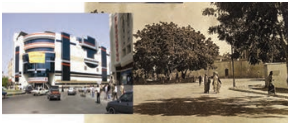
شکل ۵-۲- توسعه شهر بندرعباس (میدان ۱۷ شهریور)

به نظر شما شهرنشینی در استان نسبت به گذشته چه تفاوتی یافته است؟ به دو تصویر زیر که مربوط به نقطه‌ای از شهر بندرعباس است توجه کنید. چه عواملی سبب این تغییرات شده است؟