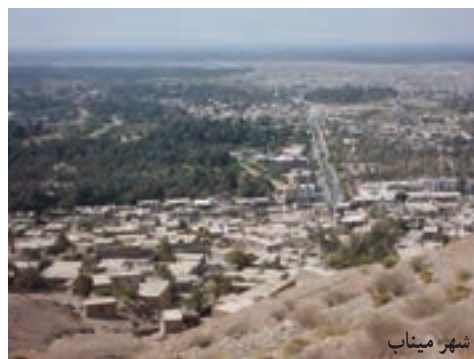
شکل ۶-۲- چشم اندازی از شهر اهوموسی، بندرعباس، میناب و قشم