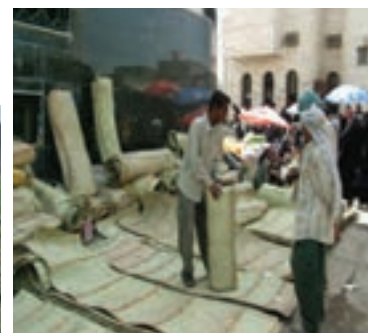
شکل ۳-۲- نمونه‌ای از منابع درآمد روستائیان استان