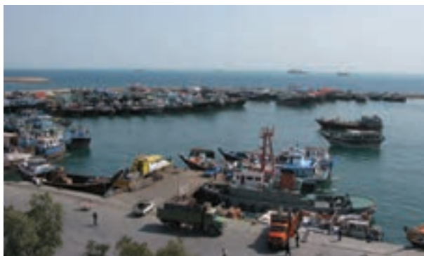
شکل ۱۲-۲- بندر لنگه

بندر لنگه: بندر لنگه جنوبی ترین مرز ساحل خشکی خلیج فارس است از این رو این بندر کمترین فاصله را با سایر کشورها و بنادر حاشیه جنوب خلیج فارس دارد. اتصال از سه جهت به شبکه جاده‌ای کشور، موقعیت مناسب قرارگیری بندر به لحاظ جغرافیایی، نزدیکی به تنگه هرمز و آب‌های بین‌المللی، وضعیت مساعد شرایط حوضچه بندر، ارتباطات قوی ساکنان با اتباع کشورهای حاشیه خلیج فارس و فاصله کوتاه بندر تا کشورهای مذکور بندر را از لحاظ ارتباطات دریایی در جایگاه ویژه‌ای قرار داده است.