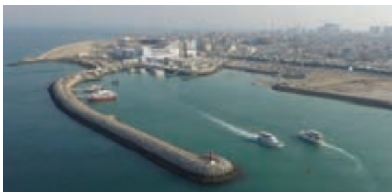
شکل ۸-۲- جزیره قشم

جزیره کیش : جزیره‌ای آباد و زیبا واقع در تپه‌های مرجانی برآمده از دل آب‌های نیلگون خلیج فارس است. عمده تجارت کیش در گذشته مروارید بوده است. این جزیره از لحاظ وسعت مقام دوم را در میان جزایر خلیج فارس دارد و از لحاظ تاریخی دارای سوابق بازرگانی می‌باشد به طوری که مرکز ارتباطات بازرگانی بین هندوستان، ایران و بین‌النهرین به شمار می‌آمده است.