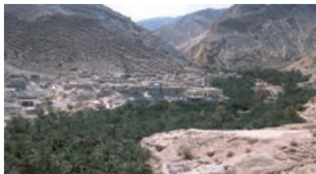
شکل ۴-۲- شکل روستای طولی و متمرکز