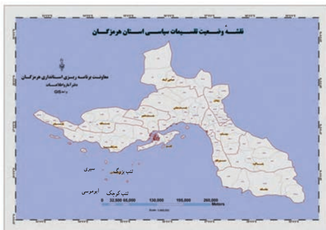
شکل ۱-۲. نقشه تقسیمات سیاسی استان هرمزگان به تفکیک شهرستان

استان هرمزگان بر اساس آخرین تقسیمات کشوری ۱۳ شهرستان که ۹ شهرستان آن ساحلی است، ۳۸ شهر، ۸۵ دهستان، ۳۸ بخش و ۲۹۱۰ آبادی و ۱۴ جزیره دارد.