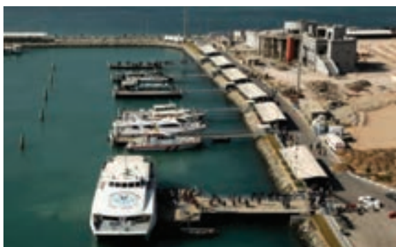
شکل ۱۰-۲- بندرعباس

بندرعباس : بندرعباس به عنوان مرکز استان امروزه یکی از شهرهای بزرگ ایران و مرکز مهم فعالیت‌های اقتصادی و تجاری است. این شهر که در قسمت انتهایی خلیج فارس و در فصل مشترک شاهراه خلیج فارس و دریای عمان واقع شده است، نقش مهمی در زمینه صادرات و واردات کشور ایفا می‌کند. تأسیسات مهم دریایی و زیربنایی کشور همچون بندر شهیدرجایی، پالایشگاه نفت بندرعباس، کارخانه آلومینیوم المهدی، کارخانه آلومینیوم هرمزگان، کشتی‌سازی خلیج فارس، فولاد و سیمان هرمزگان از این جمله می‌باشند.