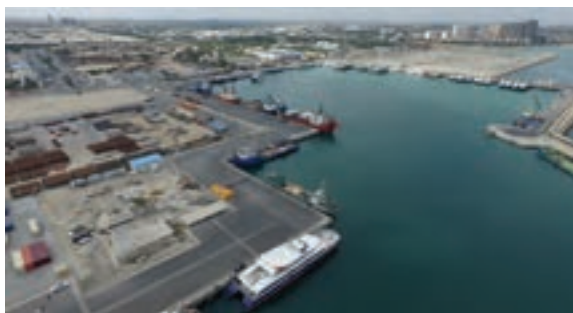
شکل ۹-۲- جزیره کیش

جزیره کیش : جزیره‌ای آباد و زیبا واقع در تپه‌های مرجانی برآمده از دل آب‌های نیلگون خلیج فارس است. عمده تجارت کیش در گذشته مروارید بوده است. این جزیره از لحاظ وسعت مقام دوم را در میان جزایر خلیج فارس دارد و از لحاظ تاریخی دارای سوابق بازرگانی می‌باشد به طوری که مرکز ارتباطات بازرگانی بین هندوستان، ایران و بین‌النهرین به شمار می‌آمده است.