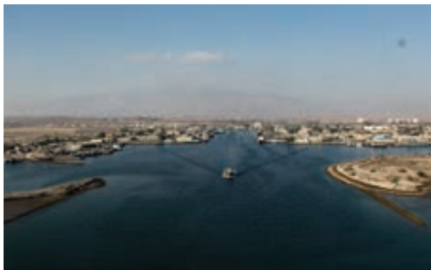
شکل ۱۱-۲- بندر شهید رجایی

بندر شهید رجایی: مجتمع بندری شهید رجایی، با برخورداری از موقعیت منحصر به فرد جغرافیایی در نزدیک ترین نقطه به تنگه هرمز و دهانه ورودی خلیج فارس، به دلیل فاصله کوتاه از مسیر اصلی تردد بین قاره‌ای کشتی‌ها، با قرار گرفتن در محل تلاقی کریدور ترانزیتی شمال - جنوب، مهم ترین دروازه واردات و صادرات جمهوری اسلامی ایران محسوب می‌شود.