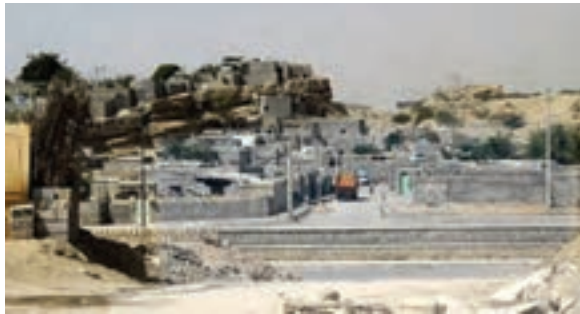
شکل ۱۵-۲- حاشیه نشینی در بندرعباس