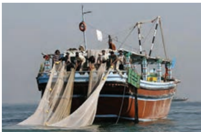
شکل ۷-۲- صیادی

مهم‌ترین منابع درآمد جزیره نشینان: ویژگی‌های طبیعی جزایر، کمبود آب شیرین و عدم خاک حاصلخیز، نزدیکی آنها به امارات متحده عربی و سهولت رفت و آمد موجب شده که شغل بیشتر جزیره نشینان خرید و فروش کالا، صیادی و دریانوردی باشد و همین عوامل باعث شده که در گذشته، گروهی از مردم این جزایر برای پیدا کردن کار مناسب و درآمد بیشتر جزیره را ترک نمایند؛ اما با اقداماتی که دولت در سال‌های اخیر انجام داده است؛ مانند ایجاد مناطق آزاد تجاری، بازارچه‌های مرزی، دستگاه‌های آب شیرین‌کن، فروشگاه‌های زنجیره‌ای، بانک‌ها و غیره، تحولی در زندگی مردم زحمت‌کش بومی پیش آمده است که چشم‌انداز روشنی را در پیش‌رو خواهند داشت.