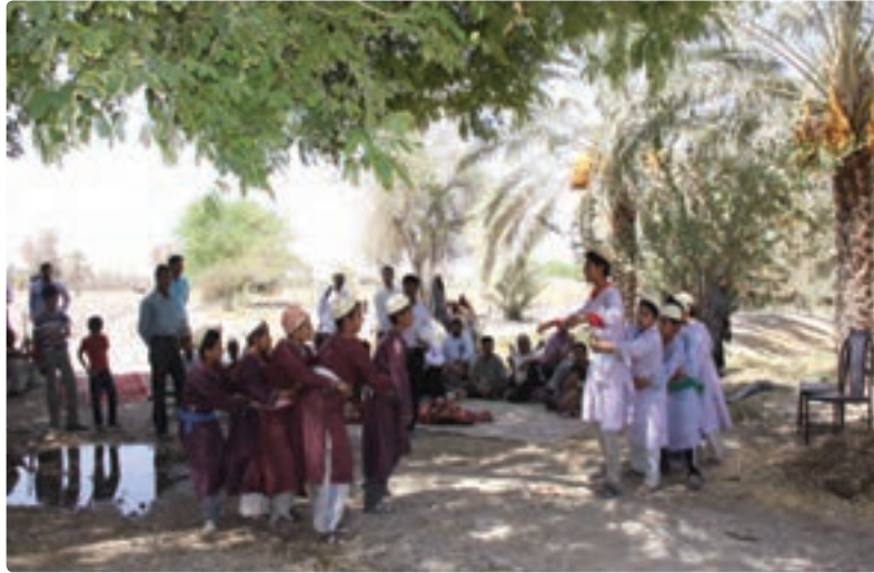
شکل ۱۴-۹- بازی هل هله گرگ چنبری