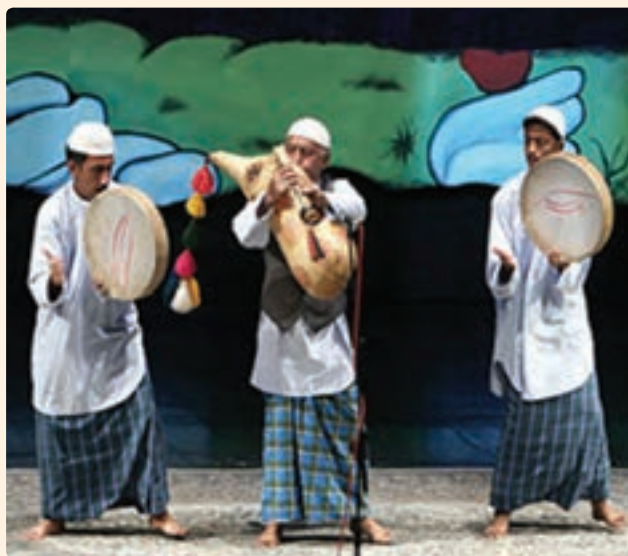
شکل ۱۶-۹- اجرای ساز نی امیان

البته موسیقی استان متقابلاً بر موسیقی ملی ایران تأثیر گذار بوده است، از جمله در ردیف موسیقی سنتی ایران، بسیاری از گوشه‌های آواز دشتی در ردیف سنتی متأثر از شروه و آوازهای رایج در منطقه دشتی، دشتستان و تنگستان و... می‌باشد.