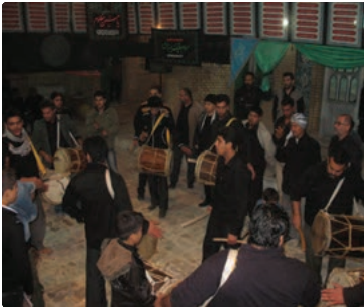
شکل ۹-۹- مراسم دمام زنی

جشن ها و آیین های استان بوشهر به جشن های مذهبی و ملی تقسیم می شوند. جشن های بزرگ مذهبی شامل جشن میلاد حضرت محمد (ص)، میلاد حضرت علی (ع)، میلاد حضرت امام زمان (عج)، عید فطر، عید قربان از جمله اعیاد مذهبی هستند که باشکوه خاصی برگزار می شوند. مراسم عید نوروز به عنوان جشن ملی مانند دیگر استان های کشور در استان بوشهر اجرا می شود. مراسم سنج و دمام زنی: استفاده از سنج، دمام و بوق که هم زمان در مراسم عزاداری نواخته می شود، ابتدا برای خبر کردن از آن استفاده می شد که بعدها جزئی از مراسم عزاداری گردیده است.