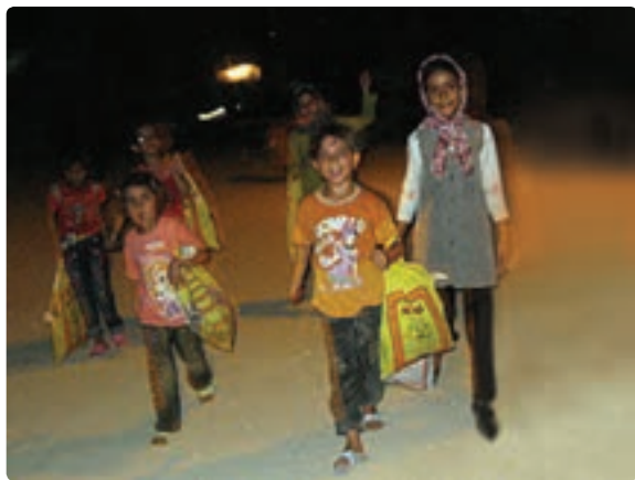
شکل ۱۱-۹- مراسم گره گشو در شهرستان دیر

به سبب آنکه این رسم در ماه مبارک رمضان صورت می‌گیرد می‌توان انجام آن را در اعتقادات مذهبی شیعیان جست و جو کرده و به روز تولد امام حسن مجتبی علیه السلام مربوط دانست.