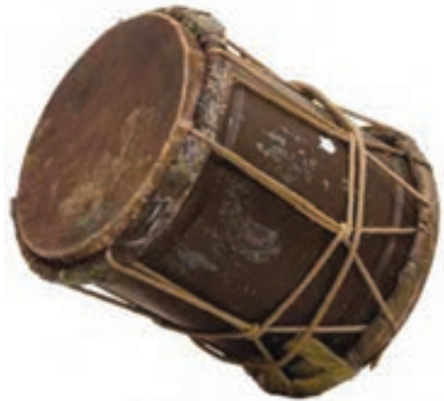
شکل ۸-۹- دمام

مراسم سینه زنی: این مراسم مذهبی با نوحه خوانی شخصی که به عنوان پیش خوان یا سرخوان شناخته شده آغاز می شود. در ابتدای مراسم، نوجوانان، جوانان و دست اندرکاران مسجد، گرد پیش خوان حلقه ای دایره ای شکل تشکیل می دهند که به آن «بر(Bor)» می گویند. سینه زنی در تعزیت پیشوایان دینی و مذهبی در شهرها و روستاهای استان برگزار می گردد.