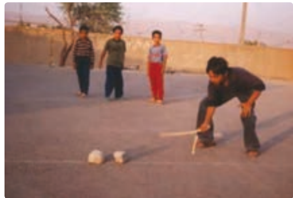
شکل ۱۵-۹- بازی چوکیلی