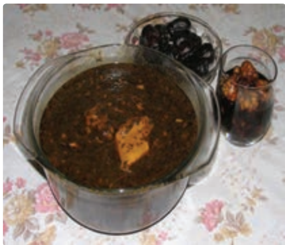
شکل ۹-۶ - قلیه ماهی

در استان بوشهر به دلیل نزدیکی به دریا اکثر غذاهای سنتی از آبریان تهیه می‌شود و مردم منطقه کوهستانی و دشت نشین از غذاهایی استفاده می‌نمایند که بیشتر در آنها گندم، لبنیات و خرما به کار رفته است. قلیه ماهی و میگو، تنداز ماهی، گمنه(للك)، رشته، لخ لاخ، عدس، مرغ شکم گرفته، ماهی شور، شکرپلو، قیمه، پهتی، برنجوش، دال عدس، کشکنه و... از انواع غذاهای استان است و رنگینک، حلوا خرمایی و... به عنوان پیش غذا در میان مردم استان رایج است.