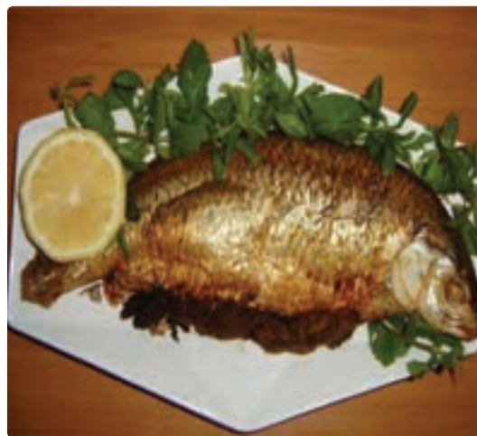
شکل ۹-۵ - ماهی شکم پر