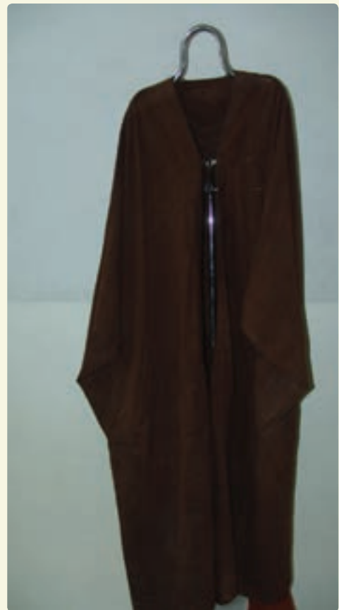
شکل ۴-۹- تصاویری از صنایع دستی استان بوشهر