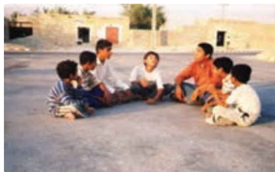
شکل ۱۳-۹- تصاویری از بازی‌های محلی در استان بوشهر