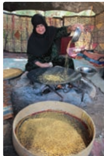
شکل ۹-۳- برخی خوراکی های محلی استان