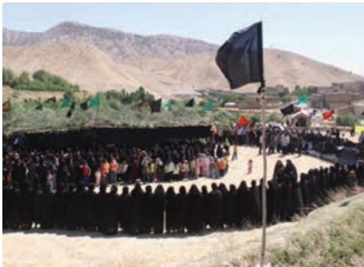
شکل ۳-۴- مراسم سنتی چه مه ر