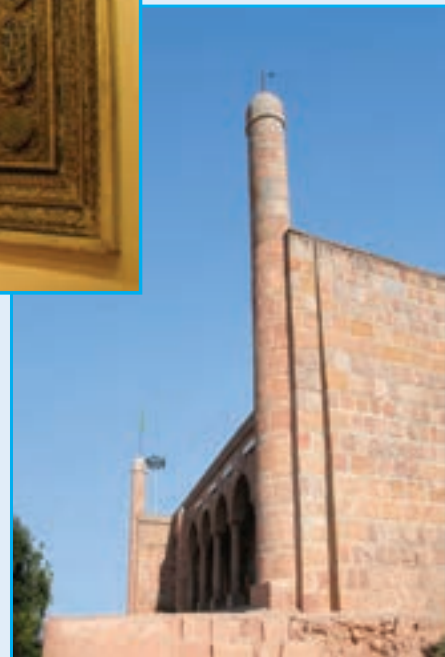
شکل ۱۹-۴- نمایی از امامزاده عون بن علی - قلعه عون بن علی مربوط به قرن هشتم و مرمت شده در دوره های بعدی