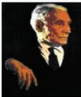
جبار باغچه بان