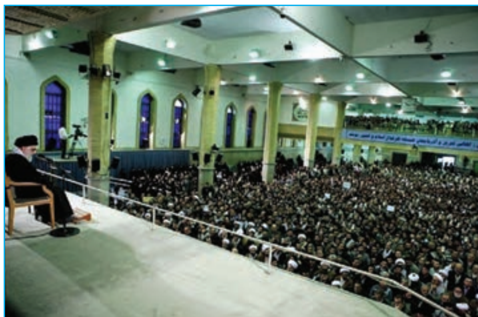
شکل ۲۳-۴ دیدار جمعی از مردم استان بارهبر معظم انقلاب اسلامی در سالروز ۲۹ بهمن، قیام مردم تبریز

مردم آذربایجان شرقی، بارها مخالفت خود را با برنامه‌های ضداسلامی دولت پهلوی‌ها چه در موضوع تغییر لباس و کشف حجاب و چه در اجرای برنامه «اصلاحات ارضی» ابراز نمودند و از حریم اسلام و روحانیت دفاع کردند. اعتراض آنها در قیام پانزده خرداد ۱۳۴۲ ه.ش به رهبری امام خمینی (ره) بعد از انقلاب مشروطه و نهضت ملی شدن نفت، قدرت ایمان و عزم ملی مردم آذربایجان را به نمایش گذاشت. قیام توفنده مردم تبریز در ۲۹ بهمن سال ۱۳۵۶ ه.ش که به مناسبت گرامیداشت چهلمین روز شهادت شهدای ۱۹ دی ماه ۵۶ شهر قم اتفاق افتاد، لرزه بر بنیاد دولت پهلوی انداخت و این اعتراض بدر انقلاب را در سراسر کشور پاشید.