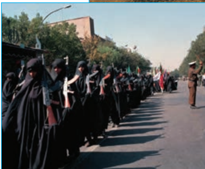
شکل ۳۱-۴- بسیج خواهران در استان