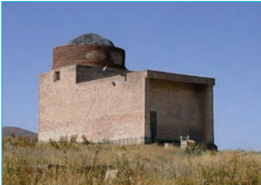
شکل ۱۲-۴- مقبره شیخ اسحق هریس- دوره صفوی ۹۹۰ ه.ق