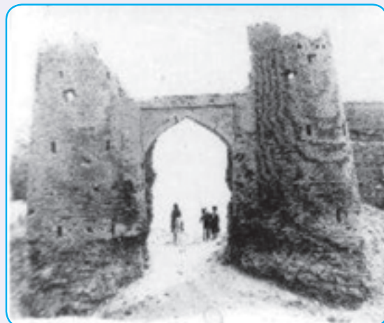
شکل ۱۴-۴- نمایی از ربع رشیدی اولین دانشگاه ایران در دوره مغول