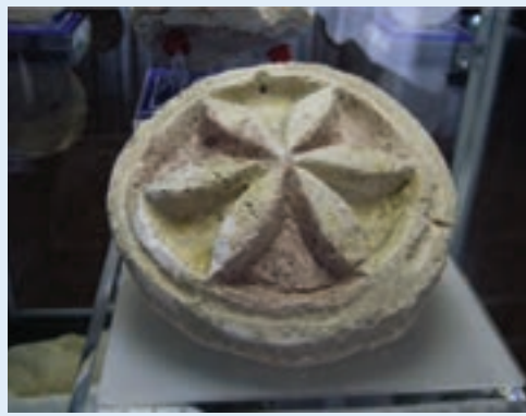
شکل ۶-۴. گچ‌بری‌های نقش خورشید و شیر آثاری متعلق به دوره اشکانی (قلعه ضحاک - اشکانی - هشترود)