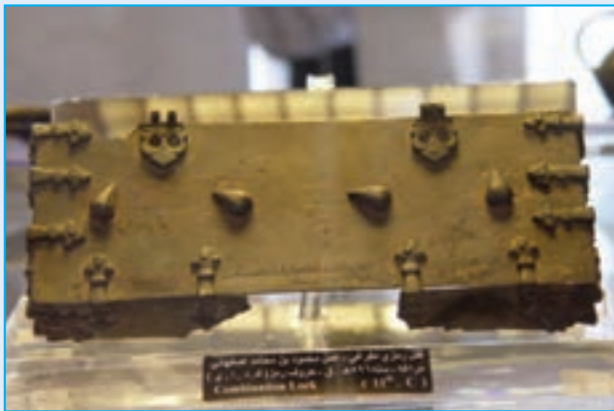
شکل ۴-۲- قفل رمزخوان اثری متعلق به قرن ششم ه.ق - عجب‌شیر

شده بودند. بعد از اتحاد با دولت «ماننا» دولت آشور را شکست دادند و نخستین دولت آریایی را به رهبری «دیا اکو» (۷۰۱ یا ۷۰۸-۶۵۵) ایجاد کردند و به این خاطر آذربایجان را کشور «ماد» می‌گفتند.