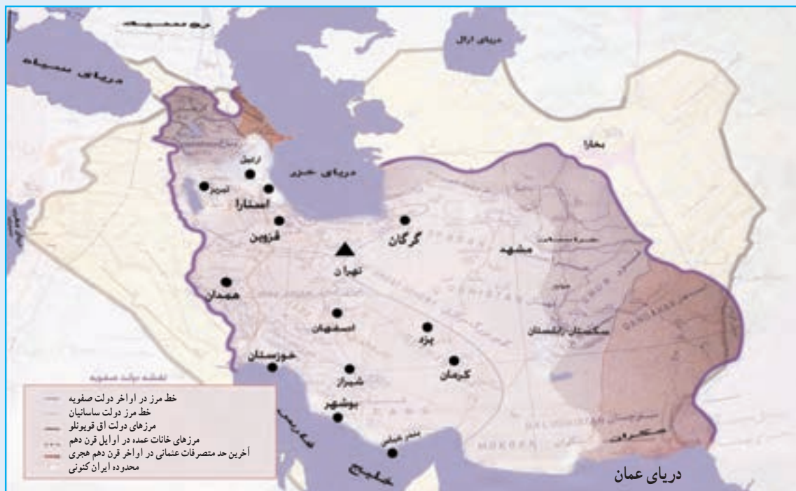
شکل ۲۰-۴- نقشه ایران در دوره صفویه که در آن تبریز به‌عنوان اولین پایتخت جهان تشیع محسوب می‌شد.

قاجاریه در سال ۱۳۰۴ هـ. ش ادامه داشت. در جنگ‌های ایران و روسیه، (۱۲۱۸-۱۲۴۳ هـ. ق) آذربایجان اهمیت سیاسی و نظامی فراوانی داشت. مردم آذربایجان با دادن کشته‌های زیاد از این آب و خاک دفاع کردند و در جریان جنگ‌های دوره اول و دوم ایران و روسیه علاوه بر شهرنشینان و روستاییان، عشایر آذربایجان نیز نقش عمده‌ای داشتند. این ایالت بعد از شکست قشون ایران، از قوای روسیه در سال ۱۲۴۳ هـ. ق به وسیله نیروهای روسی اشغال شد و بعد از پذیرش عهدنامه ترکمن‌چای و از دست دادن مناطق شمالی رود ارس، از قوای بیگانه تخلیه گردید. در نهضت تنباکو اعتراض از آذربایجان و شهر تبریز آغاز شد و در جریان انقلاب مشروطه در سال ۱۳۲۴ هـ. ق آذربایجان از ایالات پرچمدار آزادی بود و تبریز از شهرهای پیشگام در انقلاب و مرکز فعالیت آزادی‌خواهان مشروطه طلب محسوب می‌شد. پس از مرگ مظفرالدین شاه و اعلان سلطنت محمد علی‌شاه، تبریزی‌ها، با توجه به شناختی که در دوران ولیعهدی از او داشتند، به سلطنت وی روی خوش نشان ندادند. لذا پس از به توپ بستن مجلس اول در سال ۱۳۲۶ هـ. ق به وسیله محمد علی‌شاه و آغاز دوره استبداد صغیر، تبریز مرکز مقاومت ملی علیه شاه مستبد شد. ستارخان و باقرخان دو تن از سرداران غیور آذربایجان، با کمک مردم و علمای آزادی‌خواه آذربایجان مدت ۱۱ ماه در مقابل نیروهای دولتی مقاومت کردند و با برکناری پادشاه مستبد از سلطنت در سال ۱۳۲۷ هـ. ق دوباره نظام مشروطه را برقرار نمودند.