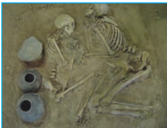
شکل ۲-۴- آثار مکشوفه هزاره اول ق.م در محل محوطه مسجد کبود

در جواب این سؤال که آذربایجان کی و چگونه محل سکونت شد و ساکنان اولیه آن از کدام اقوام بوده‌اند، اطلاع دقیقی در دست نیست. برخی از دانشمندان، با توجه به اشکال سفالینه‌های به دست آمده، در کاوش‌های باستان‌شناسی ساکنان اولیه آذربایجان را مردمی دامدار و از نژاد مدیترانه‌ای می‌دانند. در آغاز هزاره اول ق.م. دره آجی چای و ناحیه کنونی تبریز متعلق به قوم متمدن دالیان بوده است. کاوش‌های باستان‌شناسی در این منطقه کم‌انجام گرفته و مدارک قابل استناد در این زمینه بسیار ناچیز است. تپه‌های فراوان مکشوفه و غیرمکشوفه باستانی، سنگ‌نگاره‌های متعلق به پادشاهان اورارتی و وجود قبرستان‌های کلان‌سنگی در نقاط مختلف استان که به قبرهای «گور» معروف‌اند، بیانگر سکونت طولانی انسان در این استان است. از سویی آذربایجان در طول تاریخ، دالان جابه‌جایی اقوام از شرق به غرب و بالعکس بوده و نقش عمده‌ای در تبادلات فرهنگی اقوام گوناگون داشته است. در نتیجه کاوش‌های باستان‌شناسی سال‌های اخیر آثار فراوانی در جنوب شرقی استان به دست آمده که متعلق به عهد حجر قدیم است و قدمت تمدن آذربایجان را به هزاره چهارم ق.م می‌رساند.