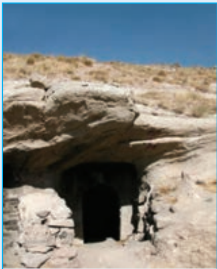
شکل ۵-۴. اثری متعلق به دوره اشکانی (غار قدمگاه - اشکانی - آذرشهر)

به دست اسکندر مقدونی، خشتریوان والی ماد، آتروپات (آذربد) فرمانده طلایه قشون داریوش سوم در جنگ گوگمل بود. بعضی‌ها او را مرد روحانی می‌دانند، او و بازماندگانش با تدبیر توانستند استقلال ماد و حاکمیت خاندان خود را تا سال ۲ ق.م حفظ کنند، در طول دوره‌ای نزدیک به هفت قرن فرمانروایی اشکانیان و ساسانیان، آذربایجان جزء جدایی ناپذیر ایران و از ایالات بسیار مهم این دو دولت محسوب می‌شده است. آذربایجان در عهد ساسانیان به دلیل استقرار پایتخت تابستانی آنها در شهر «شیز» ۱ یا «گنزک» ۲ و وجود آتشکده مقدس «آزرگشنسب» ۳ در این محل از تقدس خاص و اهمیت فوق‌العاده‌ای برخوردار بوده است.