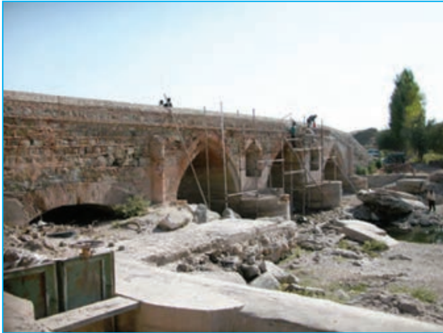
شکل ۱۱-۴- پل دختر- ملکان- دوره صفوی ۹۵۱ ه.ق