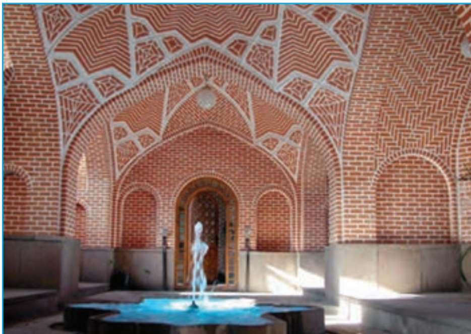
شکل ۱۰-۴- خانه بهنام (دانشکده معماری) - دوره قاجار