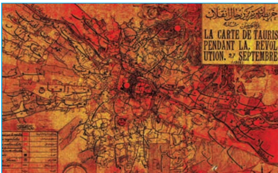
شکل ۲۲-۴- نقشه قدیمی تبریز در سال ۱۲۸۶ هجری شمسی

با دشمن تا آخرین نفس تأکید می‌کردند و عباس میرزا را به ادامه آن و عدم قبول شرایط روس‌ها تشویق می‌کردند. در این میان رفتار پیرزنی از زنان آذربایجانی از همه افتخارآمیزتر بود. این زن سالخورده با شنیدن خبر متارکه جنگ، از قیمت ریسمان دست تاب، مقداری لوازم جنگ و خواروبار برای سربازان تهیه کرده و به مقر فرماندهی عباس میرزا آورده بود تا در تجهیز سربازان وطن در مقابل دشمن سهمی داشته باشد.