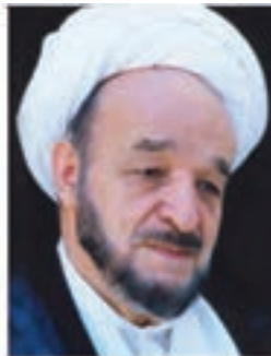
علامه محمدتقی جعفری