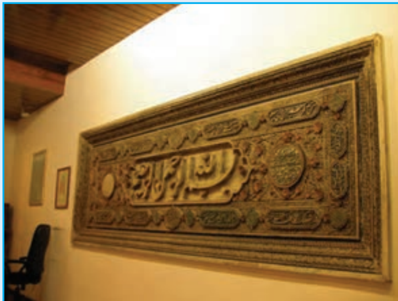
شکل ۱۸-۴- سنگ «بسم الله» - قرن دهم هجری

۶- دوره قاجاریه : در زمان سلطنت فتحعلی شاه قاجار، آذربایجان به دلیل همسایگی با دو کشور بزرگ روسیه و عثمانی، از اهمیت فراوانی برخوردار بود. به همین جهت شهر تبریز ولیعهد نشین شد. این سنت تا انقراض