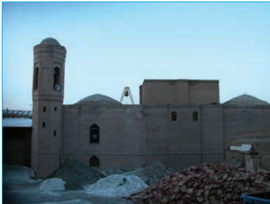
شکل ۹-۴- مسجد جامع مرند دوره اتابکان قرن ۶ هـ.ق