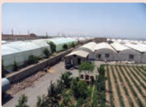
شکل ۴-۱۳- سایت گلخانه‌ای در شهر جدید هشتگرد