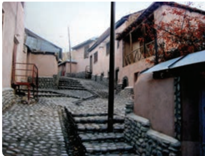
شکل ۱۱-۱۲- روستای نمونه (هدف) گردشگری گلیرد