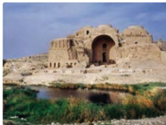
شکل ۲۳-۵- کاخ اردشیر - فیروز آباد