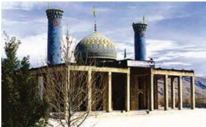
شکل ۱۴-۵- امامزاده شهید - فراشبند

— جاذبه‌های فرهنگی: سعدیه - حافظیه - سیبویه در شیراز و مقبره شیخ بیضاوی در سروستان.