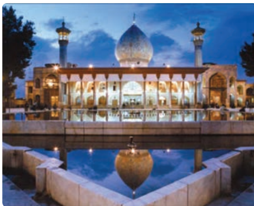
شکل ۴-۵- حرم متبرک حضرت احمد بن موسی (ع) معروف به شاهچراغ - شیراز

جالب است بدانیم که از این سه اصل، اولین و مهم‌ترین عنصر را گردشگری به حساب آورده‌اند. استان فارس در این زمینه توانمندی‌های زیادی دارد (با دو مورد دیگر در فصل‌های بعد آشنا می‌شوید).