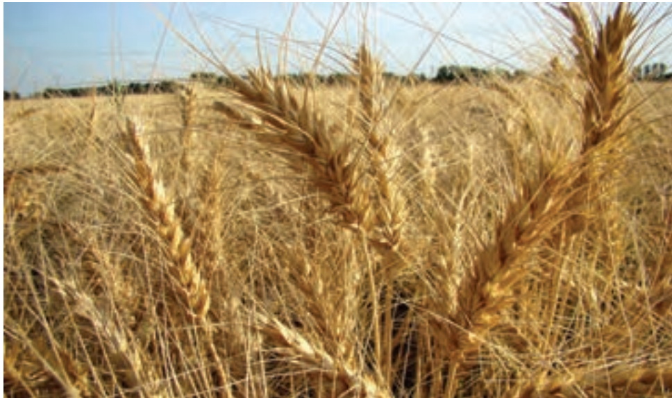
شکل ۲۵-۵- گندم، نماد کشاورزی در فارس