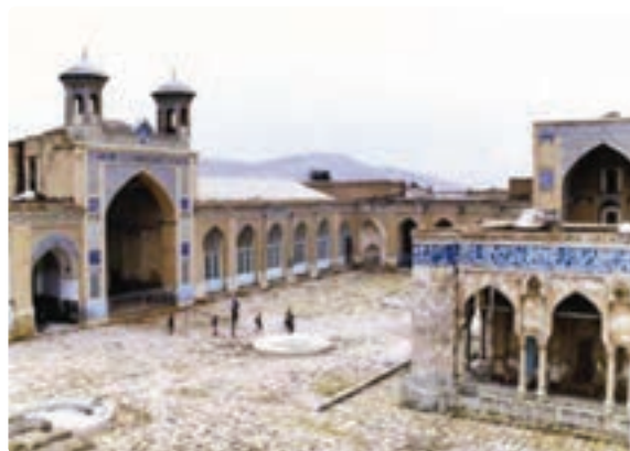
شکل ۲۱-۵- مسجد جامع عتیق - شیراز