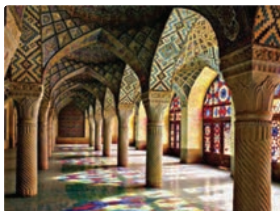
شکل ۲۲-۵- مسجد نصیرالملک - شیراز