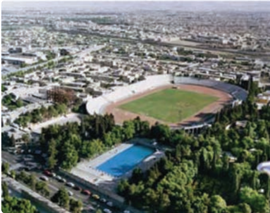
شکل ۲۴-۵- نمایی از استادیوم حافظیه - شیراز

تاکنون فعالیت‌های زیادی برای جذب گردشگر انجام گرفته است، اما برخی راه‌کارهای دیگر می‌تواند به رونق و توسعه این صنعت در استان بینجامد که عبارت‌اند از: