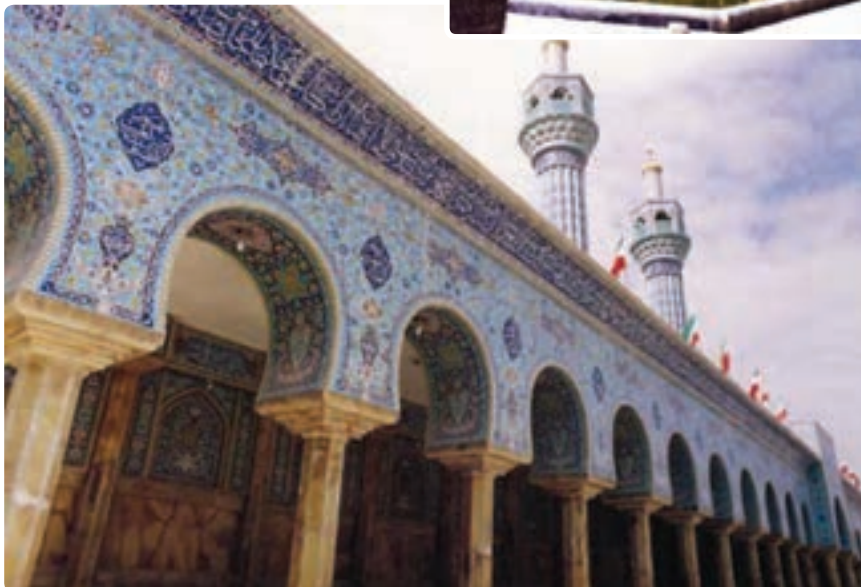
شکل ۹-۵- مسجد اعظم گراش