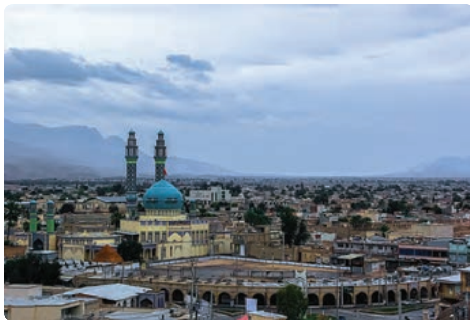
شکل ۵-۵- بازار و مسجد جامع لار

در کشور ما گام‌های نخست در توسعه این بخش برداشته شده است، به گونه‌ای که اکنون بیش از ۵۰ هزار نفر به‌طور مستقیم در زمینه گردشگری مشغول به کارند. از این تعداد در استان فارس در حال حاضر ۴۵۰۰ نفر در این صنعت شاغل‌اند. گردشگری و خودباوری: نهر، نخست‌وزیر هند در کتاب نگاهی به تاریخ جهان می‌نویسد: من هرگاه در برابر ایران و تمدن ایران قرار می‌گیرم، ناخودآگاه سر تعظیم فرود می‌آورم.