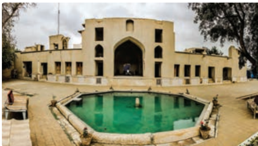
شکل ۱۹-۵- باغ نشاط لار