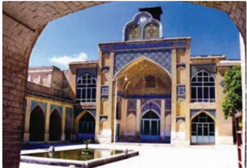
شکل ۸-۵- مسجد مشیر شیراز