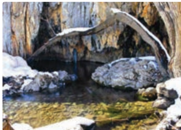
شکل ۲۰-۵- سرچشمه رودخانه نشن پیر- سپیدان