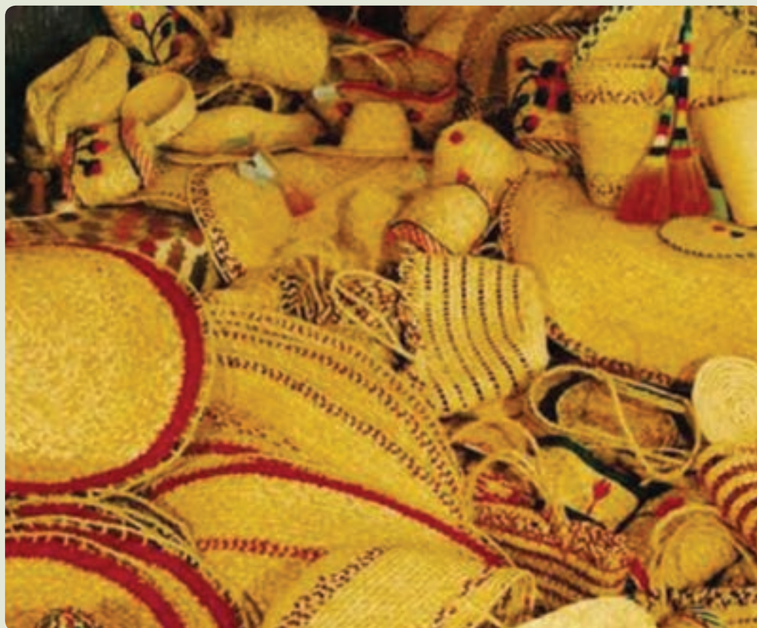
شکل ۵-۶- صنایع دستی