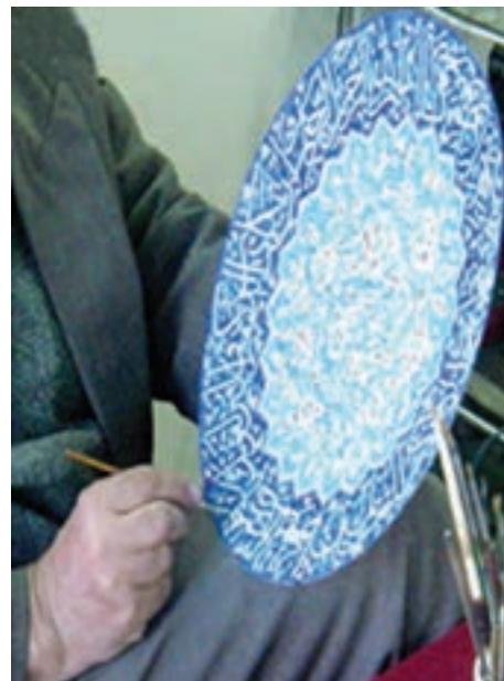
شکل ۱۴-۵- صنایع دستی و فرهنگ