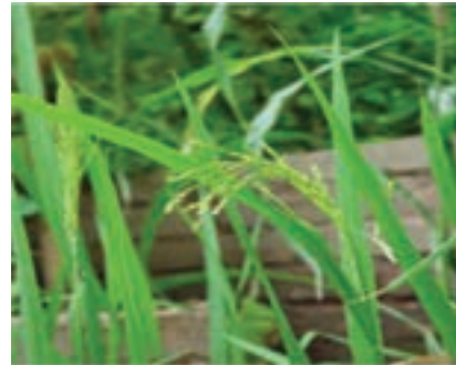
شکل ۱۶-۶- شلتوک (دوم)