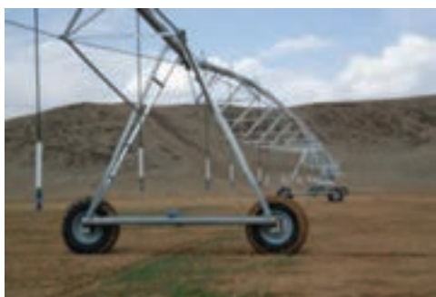
شکل ۱۳-۶- آبیاری به سبک سنتریبیود در امان آباد

۱۰- کشاورزی و دامداری : استان ما با برخورداری از آب هوای مناسب و موقعیت ترابری و اراضی حاصل خیز، ظرفیت مناسبی در دامداری و کشاورزی داراست.