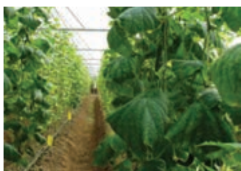
شکل ۱۶-۶- مجتمع گلخانه‌ای صیفی‌جات در امان آباد