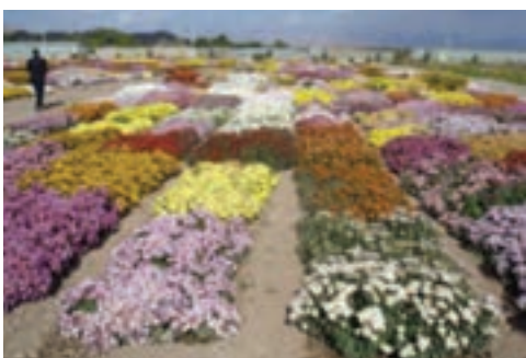
شکل ۱۵-۶- پرورش گل در محلات