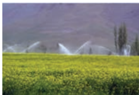
شکل ۱۲-۶- آبیاری بارانی در محلات