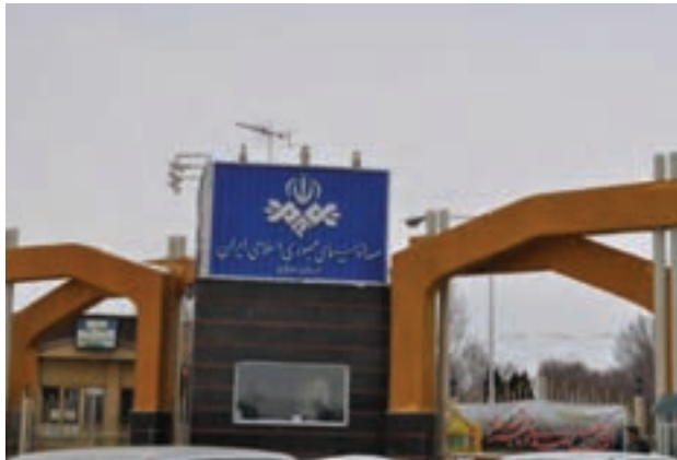
شکل ۵-۶- صدا و سیما استان مرکزی

– صدا و سیما استان امکان استفاده از ۸ شبکه تلویزیونی را با پوشش مناسبی برای تمام شهرها و روستاهای استان فراهم کرده است و شبکه استانی «آفتاب» ۸۲ درصد از جمعیت استان را پوشش می‌دهد.