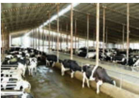
شکل ۱۷-۶- پرورش دام به صورت مکانیزه در مجتمع زرین خوشه