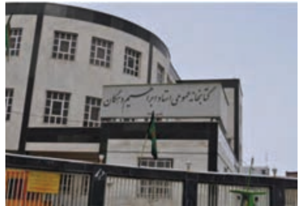
شکل ۴-۶- کتابخانه عمومی در اراک