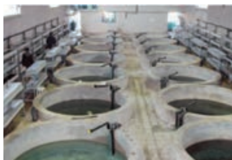
شکل ۱۴-۶- پرورش ماهی به سبک مکانیزه در گارخانه