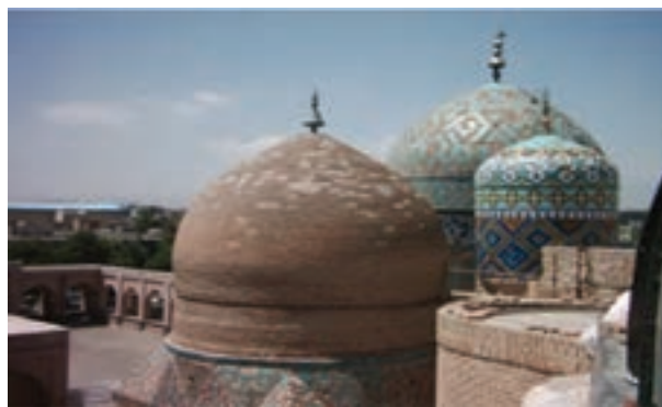
شکل ۱۱-۶ بقعه شیخ صفی در اردبیل