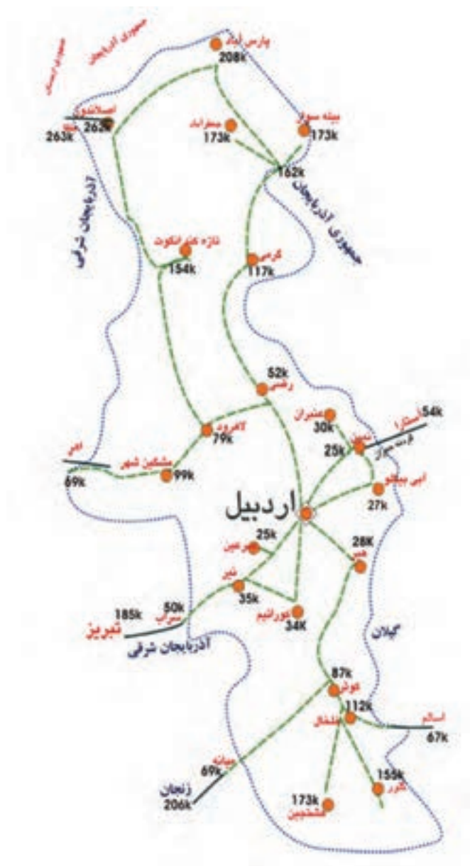
شکل ۱۶-۶- نقشه راه‌های استان اردبیل