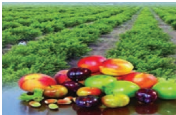
شکل ۱۴-۶- محصولات باغداری کشت و صنعت مغان

امروزه استان اردبیل با شرایط خاص جغرافیایی، تنوع محیطی، شرایط آب و هوایی، جاذبه‌های توریستی، قابلیت کشاورزی و باغداری از توان بالایی در مسیر توسعه فضایی یکپارچه برخوردار است. از طرفی همجواری با کشور جمهوری آذربایجان و ایجاد بازارچه مرزی و گمرک، ارتباط کشورمان ایران را با منطقه قفقاز و اروپا تسهیل کرده و جایگاه استان را در سطح فنی و بین‌المللی بهبود بخشیده است. با وجود قابلیت‌ها و مزیت‌های یاد شده، استان ما مسائل و مشکلاتی به شرح زیر دارد: - مرزی بودن استان و داشتن فاصله زیاد از مناطق مرکزی و توسعه یافته‌تر کشور - کوهستانی بودن استان و به تبع آن ضعف پیوند فیزیکی، اقتصادی و اجتماعی - طولانی بودن دوره سرما و یخبندان - عدم تجهیز فرودگاه‌های اردبیل و پارس آباد - نبود شبکه راه آهن