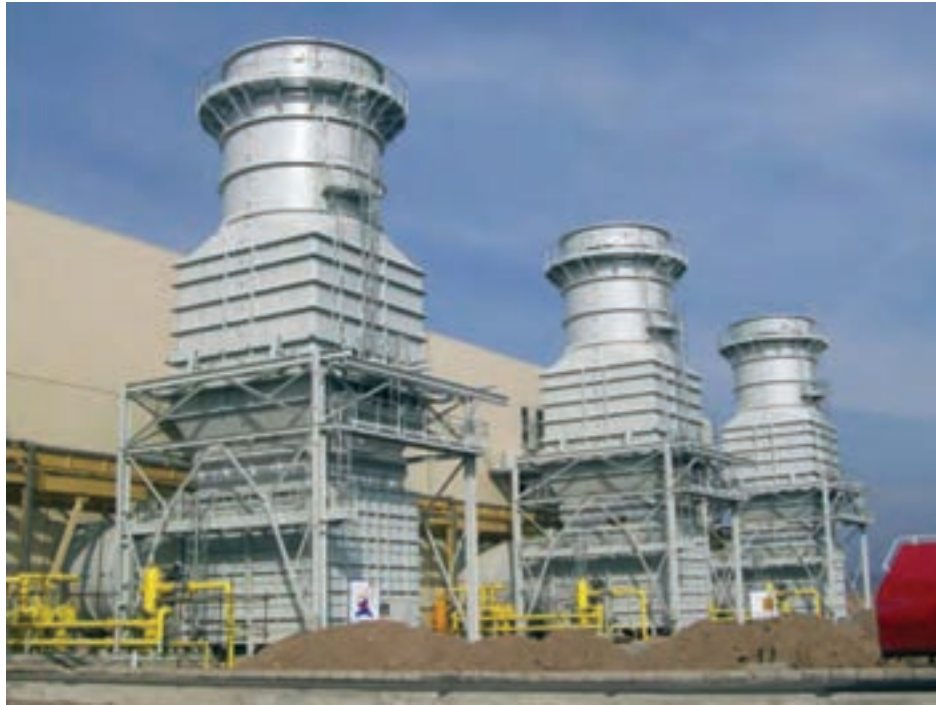
شکل ۵-۶- نیروگاه گازی سبلان اردبیل واقع در کیلومتر ۲۵ جاده اردبیل به مشکین شهر