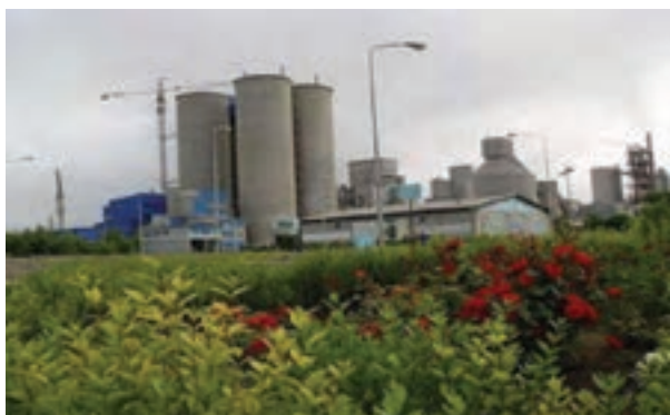
شکل ۱۰-۶ کارخانه سیمان در اردبیل

تصاویر پایین نشانگر بخشی از توانمندی‌های استان اردبیل در زمینه‌های کشاورزی و گردشگری و صنعتی و باغداری است. به نظر شما هر تصویر مربوط به کدام توانمندی‌های استان است؟ آیا می‌دانید استان اردبیل با وجود چنین توانمندی‌ها، با کدام موانع و محدودیت‌هایی در جهت توسعه مواجه است؟ این درس ضمن شرح وضعیت موجود، شما را با چشم انداز و برنامه‌های آتی توسعه استان آشنا می‌سازد.