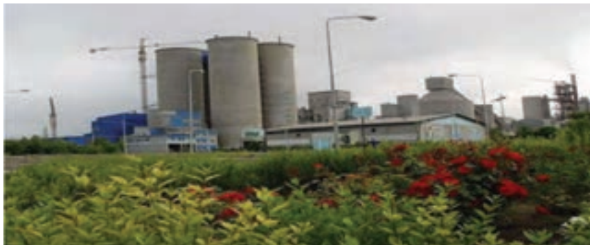
شکل ۱-۶- کارخانه سیمان آرتا اردبیل

پس از انقلاب شکوهمند اسلامی ایران نیز به‌علت مشکلات سیاسی مخصوصاً جنگ تحمیلی، تحول عمده‌ای در صنعت استان رخ نداد. اما پس از استان شدن اردبیل و با شروع برنامه اول توسعه اقتصادی، مسئولان منطقه در صدد توسعه صنعتی استان برآمدند و با تشکیل ادارات کل اقتصادی مخصوصاً اداره کل صنایع و معادن و شرکت شهرک‌های صنعتی، رغبت و علاقه برای سرمایه‌گذاری افزایش یافت به طوری که با راه اندازی واحدهای صنعتی بزرگ در کنار واحدهای صنعتی و معدنی کوچک، کارخانجاتی مانند: سیمان، لاستیک، خودرو، شیرخشک صنعتی، رنگ و ابزار آلات صنعتی، ریسندگی، پنبه پاک کنی، فولاد، نئوپان سازی، قطعات خودرو، ... احداث و به مرحله بهره‌برداری رسید.