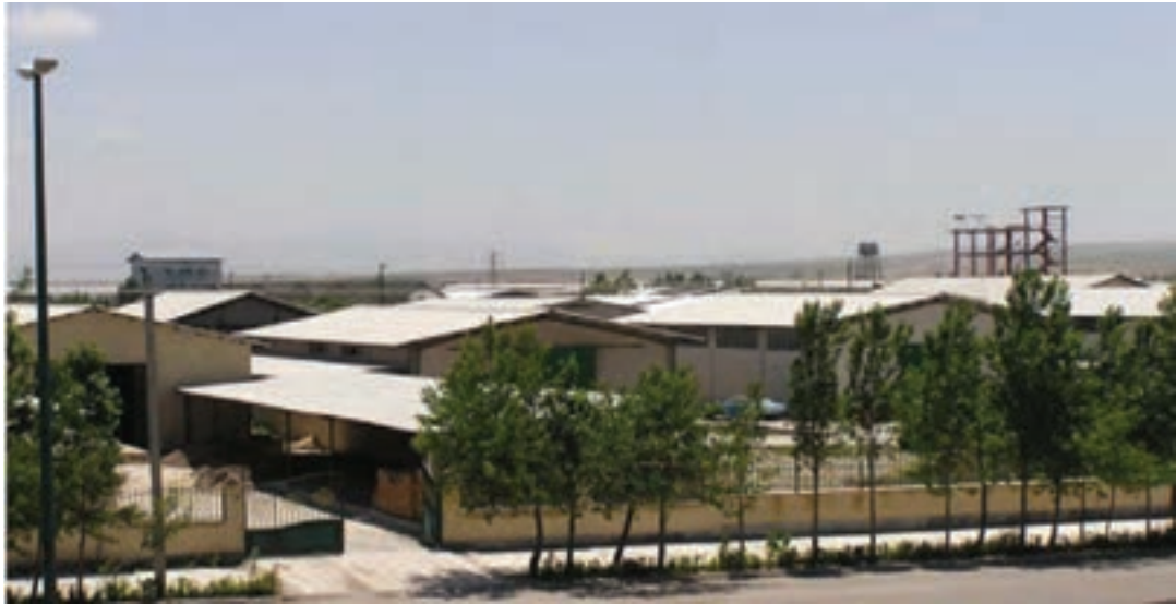
شکل ۲-۶- شهرک صنعتی اردبیل ۱

۲- شهرک صنعتی اردبیل (۲): عملیات اجرایی این شهرک از سال ۱۳۸۰ در زمینی به مساحت ۶۰۰ هکتار (امکان توسعه تا ۷۰۰ هکتار) آغاز شد. این شهرک که بزرگ‌ترین شهرک صنعتی استان است در فاصله ۱۳ کیلومتری بزرگراه اردبیل- آستارا واقع شده است همجواری این شهرک با گمرک و فرودگاه و نیز واقع شدن در مسیر بزرگراه اردبیل به تهران و نداشتن محدودیت‌های زیست محیطی برای استقرار واحدهای صنعتی مختلف از مزایا و جاذبه‌های این شهرک می‌باشد.