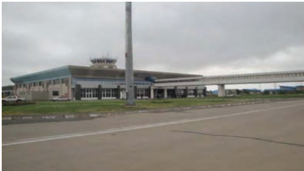
شکل ۴-۶- فرودگاه اردبیل