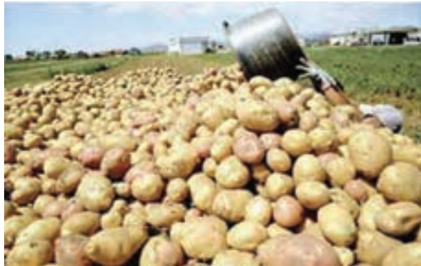
شکل ۱۳-۶- محصول سیب زمینی در دشت اردبیل