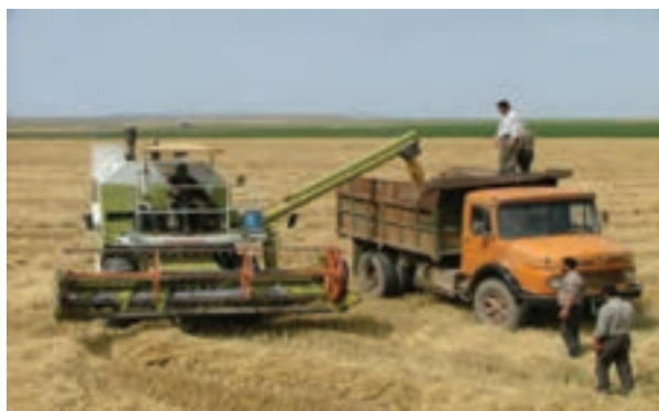
شکل ۹-۶ برداشت محصول گندم در جلگه مغان