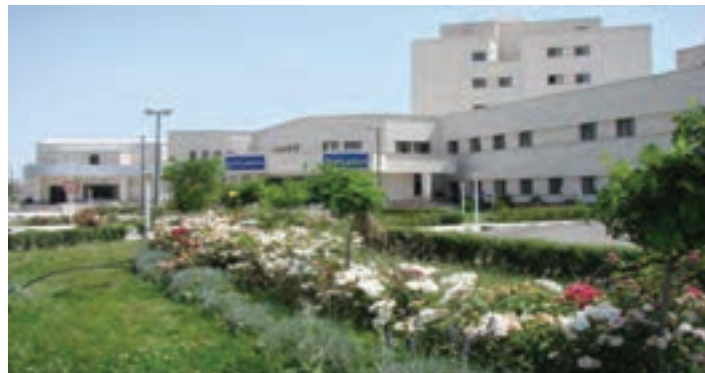
شکل ۸-۶ - بیمارستان امام خمینی اردبیل