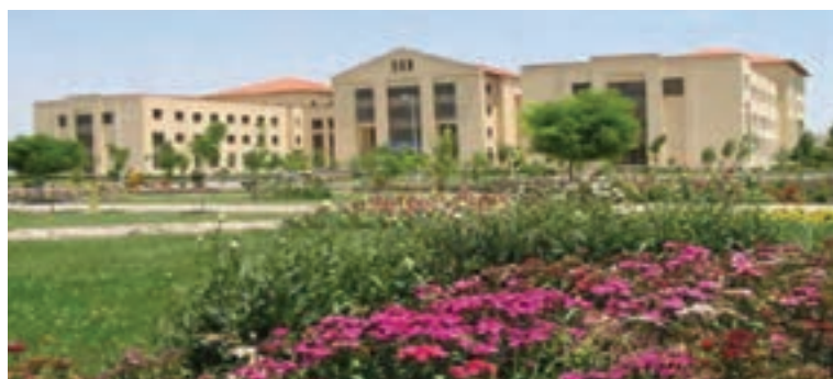
شکل ۶-۷- دانشگاه محقق اردبیلی