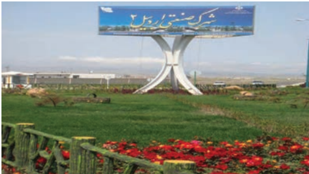
شکل ۳-۶- شهرک صنعتی اردبیل ۲

۲- شهرک صنعتی اردبیل (۲): عملیات اجرایی این شهرک از سال ۱۳۸۰ در زمینی به مساحت ۶۰۰ هکتار (امکان توسعه تا ۷۰۰ هکتار) آغاز شد. این شهرک که بزرگ‌ترین شهرک صنعتی استان است در فاصله ۱۳ کیلومتری بزرگراه اردبیل- آستارا واقع شده است همجواری این شهرک با گمرک و فرودگاه و نیز واقع شدن در مسیر بزرگراه اردبیل به تهران و نداشتن محدودیت‌های زیست محیطی برای استقرار واحدهای صنعتی مختلف از مزایا و جاذبه‌های این شهرک می‌باشد.