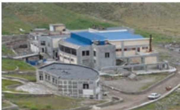
شکل ۱۲-۶ آبگرم قینرجه در مشکین شهر