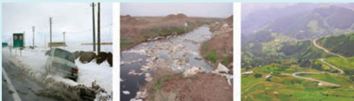
شکل ۱۵-۶- نمونه‌هایی از محدودیت‌ها و مشکلات توسعه در استان

در شکل ۱۵-۶ نمونه‌هایی از مشکلات و محدودیت‌های استان به تصویر کشیده شده است. هر تصویر کدام یک از مشکلات و محدودیت‌های استان را نشان می‌دهد؟ راهکارهای خود را برای حل این مشکلات بیان کنید.