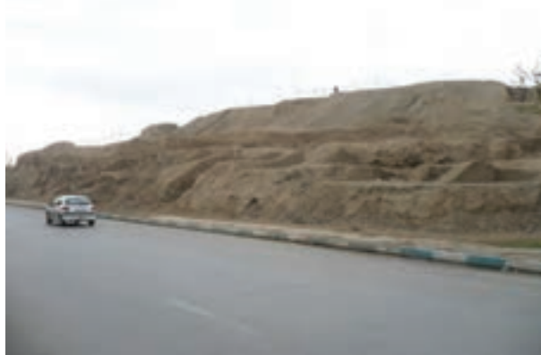
شکل ۴-۶- تپه اشرف باقی مانده بنای کهن سارویه (نزدیک پل شهرستان اصفهان)

از اصفهان پیش از اسلام؛ یعنی زمان هخامنشیان، اشکانیان و ساسانیان اطلاعات زیادی در دست نیست و آثار چندانی برجای نمانده است ولی آنچه مسلم است، از آنجا که استان اصفهان از لحاظ جغرافیایی در مرکز ایران واقع شده است، وجود دشت‌های وسیع و حاصل خیز و در برخی از مناطق، منابع آب فراوان - مانند زاینده رود - جاذبه‌هایی در آن ایجاد کرده است؛ از این رو، تمامی حاکمان در طول تاریخ نسبت به آن توجه ویژه داشته‌اند و تلاش همه‌جانبه آنها این بوده است که تسلط خود را بر این منطقه حفظ کنند. در دوران اساطیری، وجود داستان‌هایی مانند ماجرای کاوه آهنگر همان چهره آزاده که علیه ستم ضحاک قیام کرد و به کمک فریدون ملت ایران را از بند اسارت آزاد کرد و هم اکنون نیز در منطقه فریدن در روستایی به نام مشهد کاوه، آرامگاهی منسوب به این قهرمان ملی دیده می‌شود، نشان از مرکزیت قدرت سیاسی در این قسمت کشور دارد. وجود دژی بسیار بزرگ همانند اهرام مصر به نام کهندژ سارویه در حاشیه اصفهان امروزی که آثار آن تا هزار سال قبل هنوز برجای بوده و امروزه بخشی از آن در کنار پل شهرستان به نام تپه اشرف باقی مانده است و نیز بقایای آتشکده منسوب به عصر ساسانیان در ماریین اصفهان (کوه آتشگاه)، نمونه‌ای از آثار برجای مانده از پیش از اسلام است.