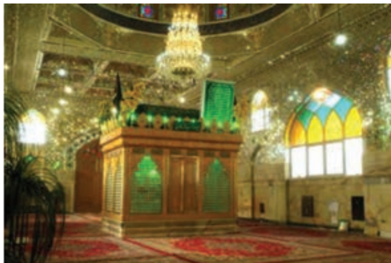
شکل ۶-۶- امامزاده اسحاق - خوراسگان

اسلام از سال ۲۳ هجری قمری وارد استان اصفهان شد. مردم این استان همانند دیگر ایرانیان از دین اسلام استقبال کردند. وجود بقاع سادات و امامزادگان در جای جای این استان، نشان از عشق و ارادت دیرینه این مردم نسبت به پیامبر بزرگوار اسلام و خانواده گران قدر آن حضرت دارد.