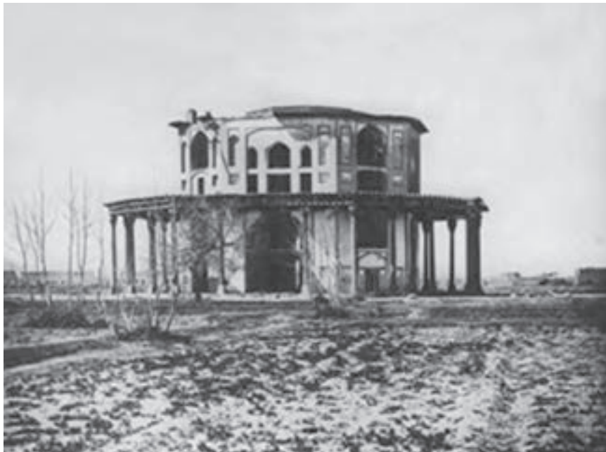
شکل ۱۱-۶- کاخ نمکدان که در زمان قاجاریه از بین رفته است.

به غیر از شهر اصفهان در سایر شهرها و حتی روستاهای استان نیز آثاری از دوره صفویه به چشم می خورد؛ مثلاً کاشان، خوانسار، نجف آباد (ایجاد شهر در زمان صفویه)، کوهپایه و نائین.