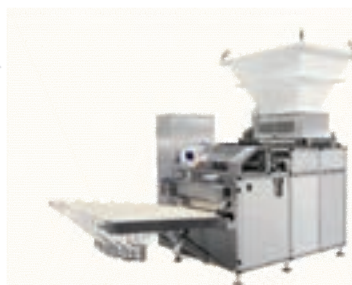
شکل ۱۰- تصاویر دستگاه چانه‌گیر