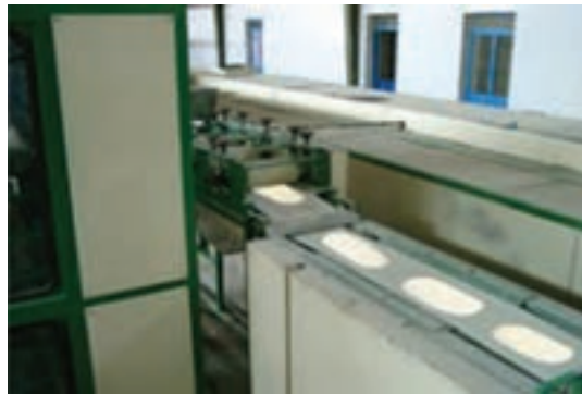
شکل ۱۶- فرم‌گرفتن خمیر نان مسطح

پس از قالب‌گیری تخمیر نهایی انجام می‌گیرد. تخمیر نهایی در اتاقک‌های مخصوص و یا واگن‌های تخمیر با رطوبت نسبی ۸۵-۸۰ درصد و دمای ۳۷-۳۵ درجه سلسیوس به مدت ۳۰ تا ۶۰ دقیقه انجام می‌شود. در این مرحله فرایندهایی به شرح زیر رخ می‌دهد: