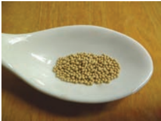
مخمر خشک معمولی

۵ قدرت آرد: آرد حاصل از گندم‌های مختلف دارای مقادیر متفاوت از گلوتن و سایر ترکیبات است. این امر، سبب تفاوت قدرت خمیر حاصل از آردهای گوناگون می‌شود. مخمر نانوایی: انواع مخمر مورد استفاده در تهیه نان به شرح زیر است: - مخمر خشک: مخمر خشک به دو صورت فوری و معمولی تولید می‌شود و رطوبت آن بین ۳ تا ۸ درصد است. نوع معمولی، ابتدا باید آماده‌سازی و فعال شود. به این صورت که مخمر با بخشی از آب و کمی شکر مخلوط شده به مدت ۱۵ دقیقه در دمای ۳۵-۴۰ درجه سلسیوس قرار می‌گیرد. نوع فوری، نیازی به آماده‌سازی و فعال شدن نداشته و می‌تواند مستقیماً به خمیر اضافه شود.