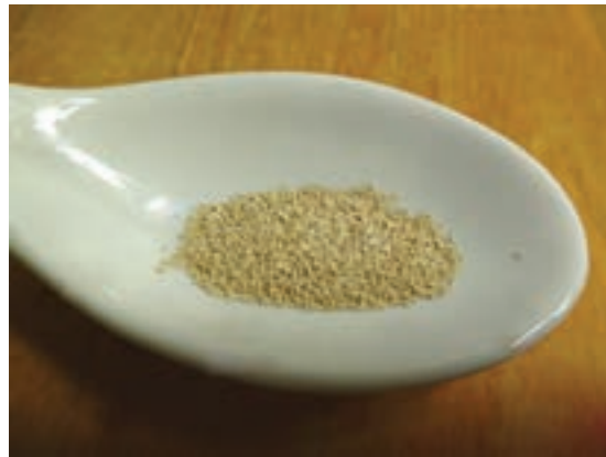
مخمر خشک فوری