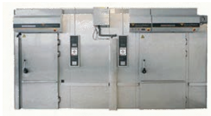
شکل ۱۸- تصاویر فر چندطبقه

۲ فر طبقه‌ای با پایه متحرک: این نوع فر شبیه فر طبقه‌ای است. در این فر، خمیر روی طبقات فلزی قرار می‌گیرد.