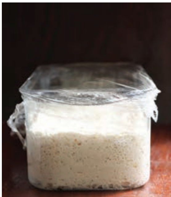
تصویر خمیر بعد از تخمیر اولیه