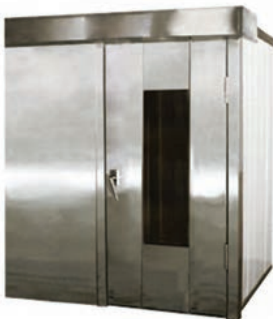
شکل ۸- اتاق تخمیر