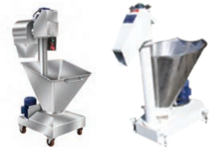
شکل ۴- دستگاه الک آرد

۲ مخلوط کردن انواع آرد: آردهایی که به سیلو و یا انبار وارد می‌شوند، کیفیت یکسانی ندارند و گاهی از نظر کیفی، برای تولید نان مناسب نیستند. به همین منظور برای بهبود کیفیت آرد مصرفی، آرد کم گلوتن با آرد دارای گلوتن زیاد، یا آرد تازه با آردی که به مدت طولانی‌تری ذخیره شده است، مخلوط می‌شود. نسبت اختلاط آردهای مختلف در واحدهای تولیدکننده نان اغلب براساس تجربه صورت می‌پذیرد. ۳ رساندن دمای آرد به حد مطلوب: قبل از مخلوط کردن و زدن خمیر باید برحسب دمای محیط، دمای آرد به حد مطلوب رسانده شود. در تابستان، نیازی به گرم کردن آرد وجود ندارد. در حالی که در زمستان، باید یک روز قبل، آرد را درمحل مناسب به منظور گرم شدن قرار داد.