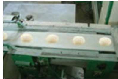
شکل ۱۳- دستگاه گردکننده