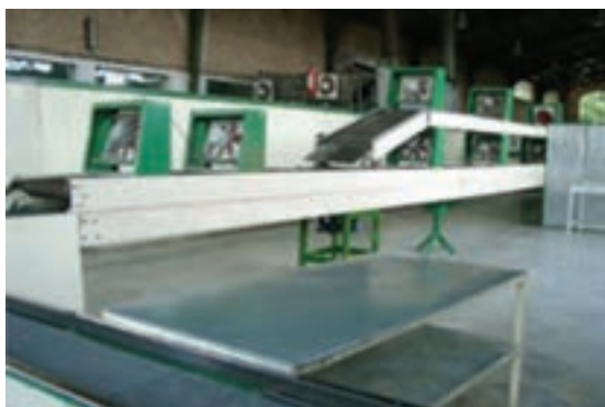
شکل ۲۲- باند خنک‌کننده نان