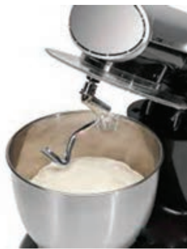
شکل ۵- خمیرگیر مارپیچی

کاربرد روش مداوم نیاز به دانش و تخصص بیشتری دارد. در این روش مواد اولیه توسط دستگاه های توزین به طور خودکار وارد محفظه خمیرگیر شده و عملیات مخلوط شدن و انتقال خمیر به بخش های بعدی به طور پیوسته انجام می شود. (شکل ۷) ظرفیت تولید خمیر این دستگاه ها، در مقایسه با انواع غیرمداوم بالاتر است.