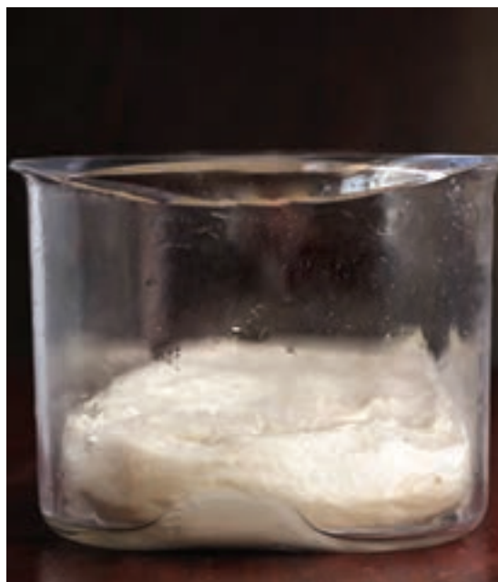
تصویر خمیر قبل از تخمیر اولیه