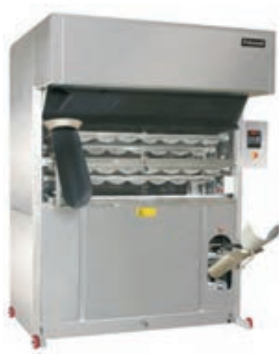
شکل ۱۵- دستگاه تخمیر میانی