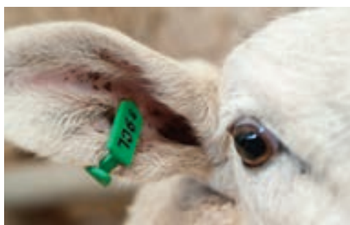
استفاده از پلاک گوش پلاستیکی