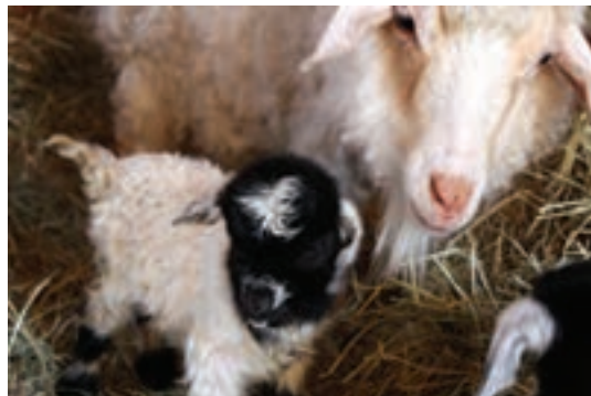
استفاده از اثر بینی در شناسایی دام