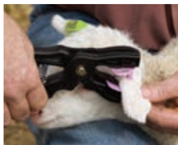
نحوه مهار بره با دست

در زیر برخی از روش‌های مهار کردن گوسفند و بز نشان داده شده است.