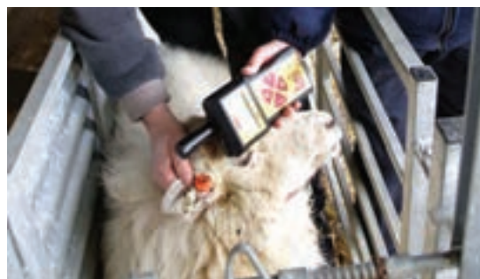
استفاده از میکروچیپ در گوش گوسفند

خمیر قلیایی توسط یک مهر لاستیکی روی پوست خشک قرار داده می‌شود. این روش باعث ایجاد فرورفتگی بدون مو می‌شود. در چند روز اول پس از استعمال، باید حیوان را از باران و رطوبت محافظت نمود.