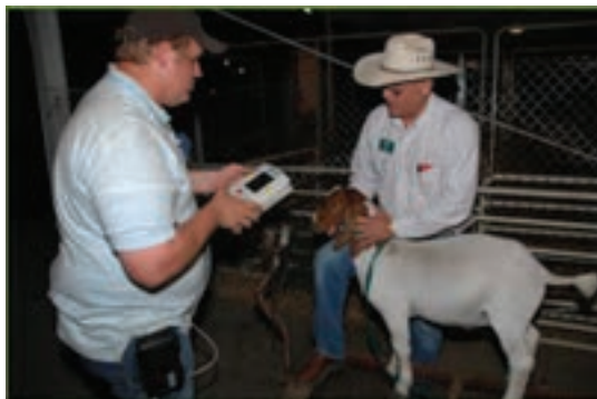
استفاده از اسکن شبکیه چشم در بز