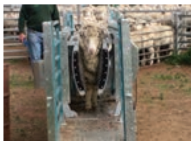
دستگاه مهارکننده ثابت (ایموبایزر) ۱