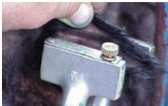
دستگاه خال کوب با حروف الفبایی

برای خال کوبی بره و بزغاله ها، حداقل باید تا سن ۵ یا ۶ ماهگی صبر کرد. در این سن جای کافی برای نصب شماره ها در گوش وجود دارد و گوش به اندازه کافی رشد کرده است. اگر دام را در سنین بسیار پایین خال کوبی کنید با رشد گوش اثر خال کوبی به تدریج محو می شود. به علاوه ضخیم شدن تدریجی بافت های گوش و افزایش مقدار مواد رنگی پوست، خال کوبی را غیر قابل خواندن می کند.