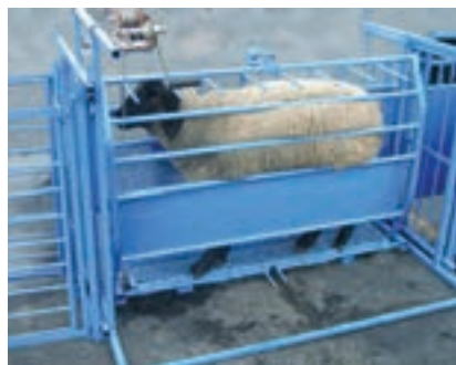
استفاده از نرده و جایگاه انفرادی