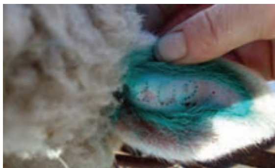
گوش خال کوبی شده

خال کوبی روی سطح داخلی و یا خارجی گوش به وسیله پلاک کوب مخصوص خال کوبی (انبر خال کوبی) انجام می شود. این پلاک کوب دارای حروف و ارقام تغییرپذیر هستند و به شکل سوزن های نوک تیز می باشند. اعداد سوزنی شکل در پلاک کوب مخصوص خال کوبی قرار داده می شود و مخاط داخلی گوش توسط آنها سوراخ می شود. سوراخ های ایجاد شده به شکل شماره یا علامت مورد نظر ظاهر می شود. سپس جوهر مخصوص روی آنها مالیده می شود. پس از چند روز جای سوزن ها بهبود می یابد و جوهر در زیر پوست به صورت نقاط رنگی باقی می ماند و شماره دام با استفاده از جوهر به کار رفته قابل خواندن خواهد بود. در مقایسه با سایر روش های علامت گذاری، خال کوبی نسبتاً پرهزینه است؛ اما اگر به درستی انجام شود تا آخر عمر حیوان، اثر آن باقی می ماند. ولی حیواناتی که پوست گوش آنها سیاه رنگ است، نقش خال آنها واضح نیست.