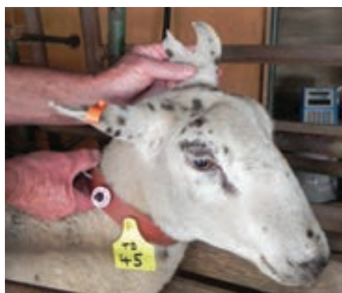
استفاده از پلاک گردن

مخصوص به خود هستند که رنگ آنها به آسانی از بین نخواهد رفت و دوام بسیار خوبی دارند، همچنین به منظور تفکیک سنی، جنسیتی و نژاد دام، دامدار می‌تواند از پلاک‌هایی با رنگ‌های متفاوت استفاده کند.