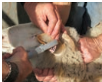
نحوه مهار گوسفند با دست