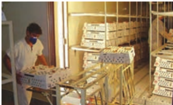
نحوه چیدن کارتن‌ها در ماشین حمل