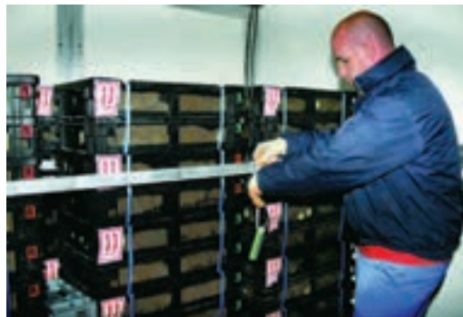
مهار شدن سبد جوجه‌ها در ماشین‌های حمل