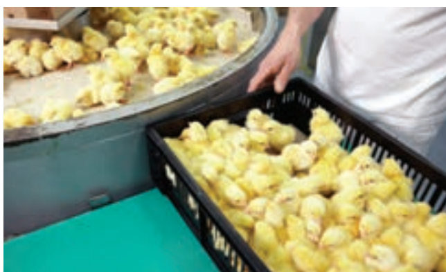
۱. انتقال جوجه‌ها به کارتن‌ها به‌صورت دستی