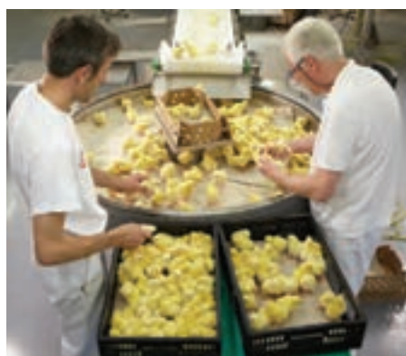
۲. انتقال جوجه‌ها به کارتن‌ها با استفاده از نوار نقاله

معمولاً کارتن مورد استفاده در جوجه‌کشی‌ها به چهار بخش تقسیم می‌شود تا از تجمع جوجه‌ها در یک گوشه کارتن جلوگیری شود. در فصول گرم سال در صورتی که درجه حرارت بالای ۲۱ درجه سانتی‌گراد باشد در کارتن‌ها ۸۰ قطعه جوجه و در صورتی که حرارت از ۲۱ درجه سانتی‌گراد پایین‌تر باشد ۱۰۰ قطعه جوجه را در کارتن‌ها قرار دهید. کارتن‌های آماده‌شده را در گاری بچینید و از قرار دادن کارتن‌ها روی زمین خودداری کنید. وقتی جوجه‌های تازه هچ‌شده در کارتن‌ها قرار می‌گیرند، قسمت شکم آنها نرم است، بدنشان به‌طور کامل کرک ندارد و به‌خوبی قادر به ایستادن نیستند. به‌همین دلیل باید اجازه داد تا بدن جوجه‌ها سفت شود.