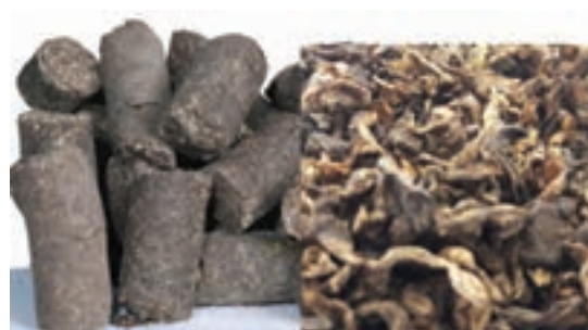
تفاله چغندر قند به صورت پرک و پلت

تفاله چغندر قند: حجیم، خوش خوراک و ارزان است که دارای مواد قندی زیاد بوده و حدود ۹/۶ درصد پروتئین و ۰/۵ درصد چربی است. از نظر کلسیم غنی و از لحاظ فسفر ضعیف می‌باشد. تفاله ممکن است به صورت خشک مصرف شود، اما اکثراً تفاله چغندر را با نسبت مناسب آب مخلوط می‌کنند تا مرطوب شود و بافت مناسبی پیدا کند و سپس در جیره دام وارد می‌کنند.