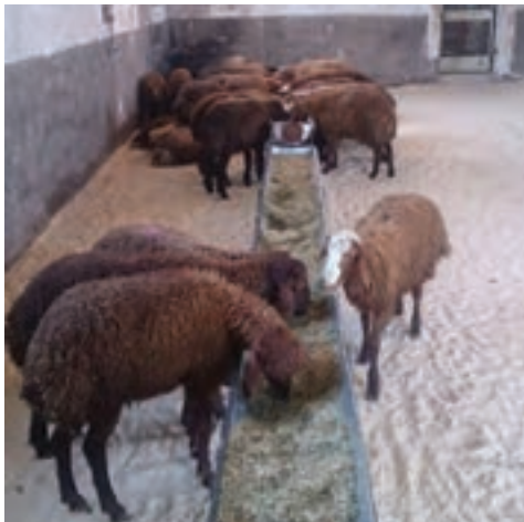
تغذیه یونجه و کاه در آخور

جیره غذایی مخلوطی از چند ماده خوراکی است که دارای مقدار و نسبت صحیحی از انرژی و مواد مغذی مختلف بوده و چنانچه روزانه و به میزان کافی در اختیار دام قرار گیرد، احتیاجات آن را از نظر انرژی، پروتئین، مواد معدنی و سایر مواد مغذی در این مدت تأمین می‌کند.