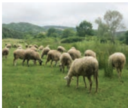
تغذیه از چراگاه

روش های تغذیه را می توان به انواع تغذیه از چراگاه و تغذیه دستی تقسیم بندی کرد.