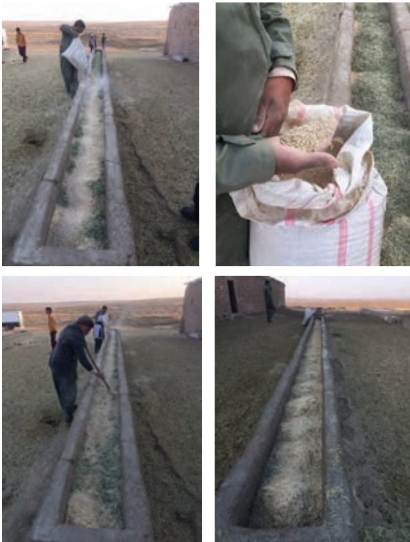
توزیع خوراک در آخورها به روش دستی