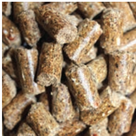
نمونه‌ای از جیره پلت

به طور کلی با توجه به نژاد، جنس، وزن، وضعیت دام و مانند آن چند نوع جیره غذایی وجود دارد: 1 جیره نگهداری: جیره‌ای است که دام با مصرف آن هیچ نوع تولید و افزایش یا کاهش وزنی نخواهد داشت و شرایط دام را از نظر سرزندگی، سلامت و وضعیت طبیعی حفظ می‌کند. جیره مذکور در حقیقت حداقل نیاز یک حیوان است.