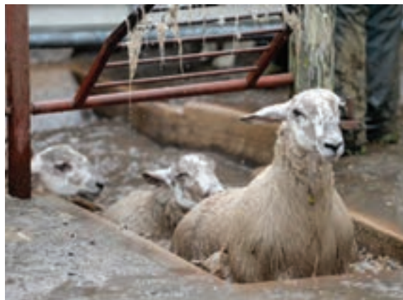
۳- حوضچه یا حمام

با توجه به مطالب بیان شده نام قسمت‌های مشخص شده در تصویر را بنویسید.