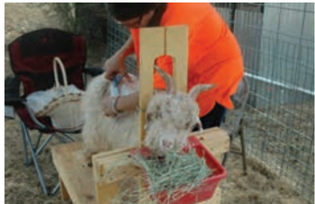
موجینی بز با استفاده از قیچی