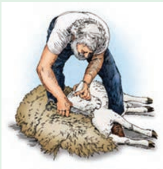
۱۶ یکی از گوش‌ها را با دست چپ نگه دارید و پشم چینی سمت راست گردن را انجام دهید.