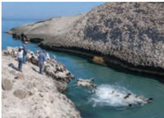
استفاده از منابع آب طبیعی برای شست‌وشوی گوسفند و بز