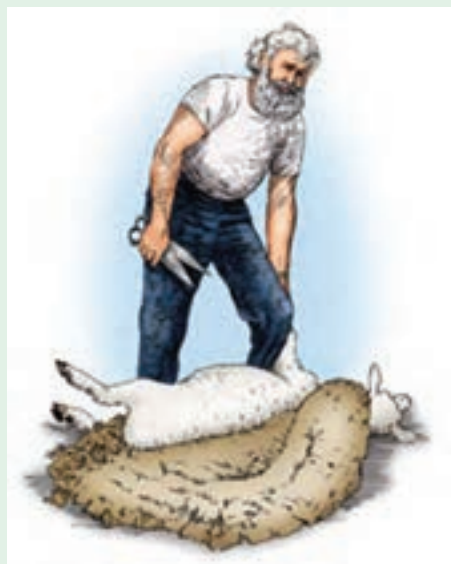
۱۵ در این قسمت نیمی از پشم چینی انجام شده است.