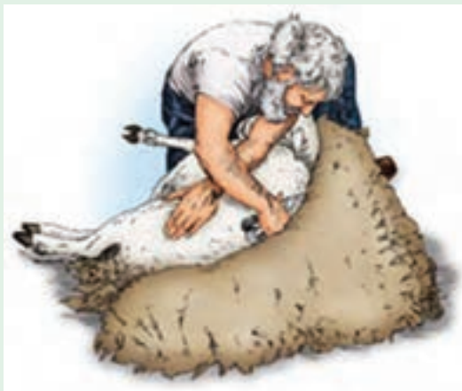
۱۳ در این موقعیت، پشم چینی ستون فقرات و چند سانتی‌متر اطراف آن را هم انجام دهید.