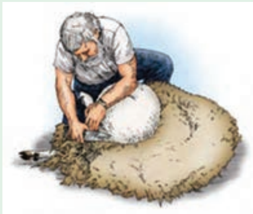
۱۴ با نگه داشتن پای چپ، امکان پشم چینی اطراف ناف فراهم می‌شود.