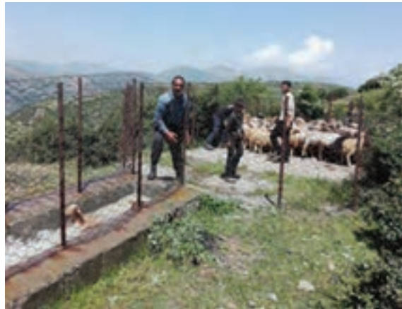
۱- قسمت انتظار