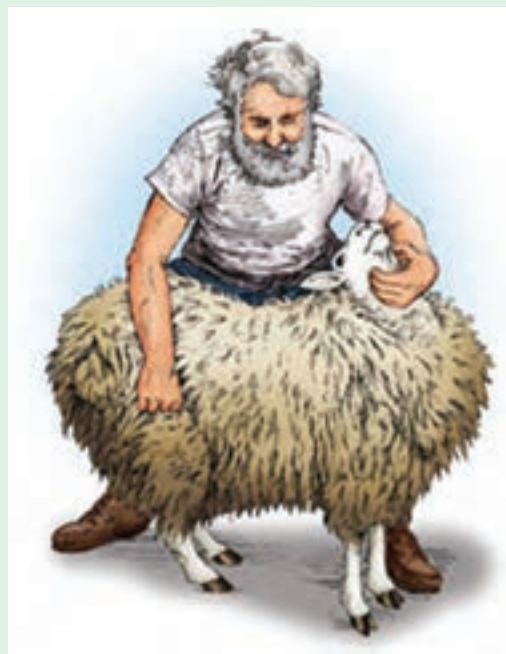
۲ با دست چپ زیر گردن گوسفند و با دست دیگر ران گوسفند را بگیرید.