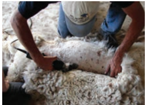
پشم‌چینی گوسفند با استفاده از ماشین پشم‌چینی برقی