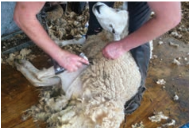
پشم‌چینی گوسفند با استفاده از ماشین پشم‌چین موتوری

برای حفظ مرغوبیت و بازارپسندی پشم باید از ابزارهایی استفاده نمود که پشم را به‌طور یکنواخت از بدن دام جدا نماید. در زیر به روش‌های مختلف اشاره شده است.