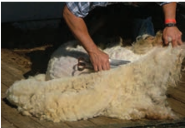
پشم‌چینی گوسفند با استفاده از دوکارد یا قیچی پشم‌چینی