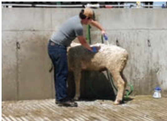
استفاده از شیلنگ آب برای شست‌وشوی گوسفند یا بز