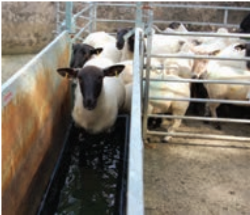
۲- راهرو یا گذرگاه