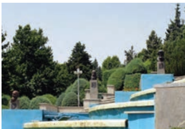
تصویر ۳-۶- لنز واید