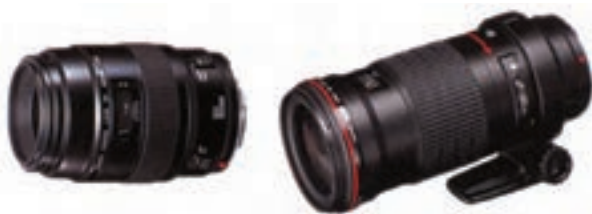
تصویر ۱۳-۶- دو نمونه لنز ماکرو با فواصل کانونی متفاوت

به جز لنزهای ذکر شده لنزهای دیگری هم در عکاسی به کار می رود که بسیار تخصصی است و استفاده همگانی ندارد.