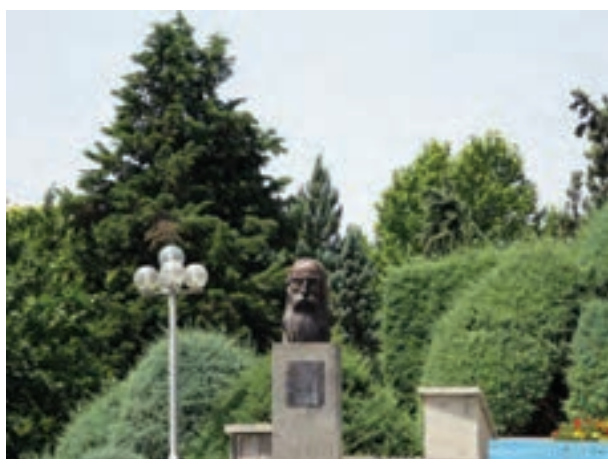
تصویر ۵-۶- لنز تله