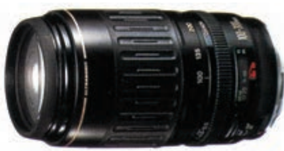
تصویر ۱۲-۶- لنز زوم با مشخصات ، ۱۰۰-۳۰۰ f.4.5-5.6