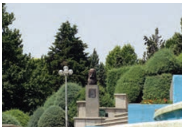
تصویر ۴-۶- لنز نرمال