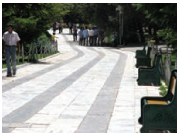
تصویر ۲۰-۶- پرسپکتیو لنز تله