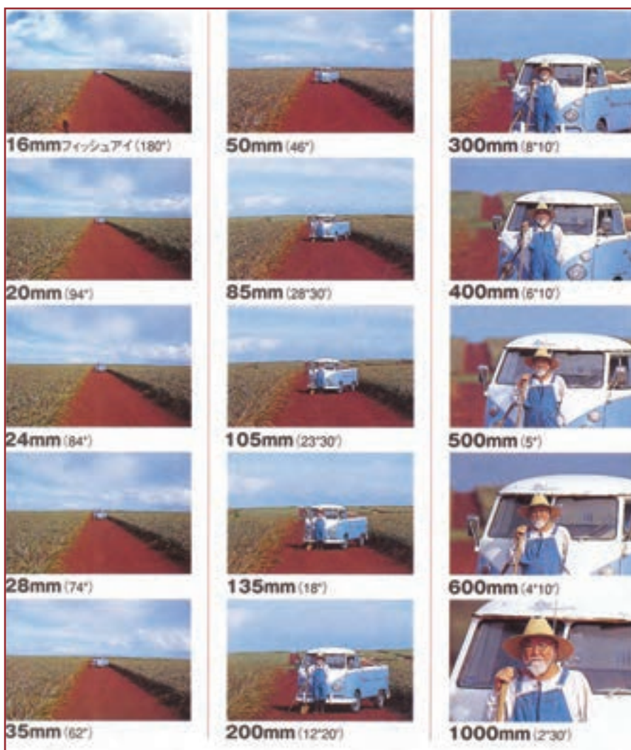
تصویر ۶-۷- تصاویر حاصل از لنزهای مختلف از یک موضوع با زاویه دید هر یک از آن ها