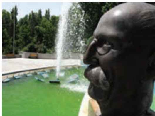
تصویر ۲۴-۶- لنز واید