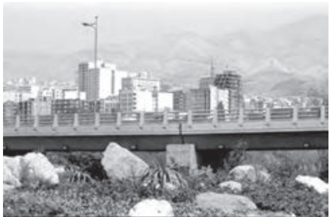
تصویر ۱۶-۶ - لنز واید