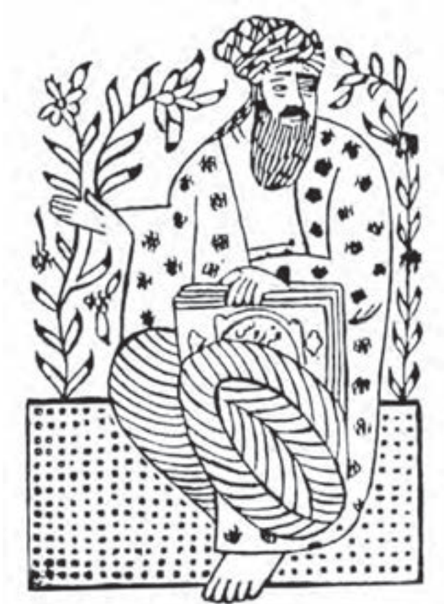
تصویر ۲۳ - نقش فردوسی - حاشیه کتاب چاپ شده با قالب قلمکار - دوره تیموری.

وجود نقش‌های چاپ‌شده بر حاشیه بعضی از کتاب‌های دوره تیموری نیز، نشان از استفاده از قالب‌های چوبی در سده دهم هجری دارد (تصویر ۲۳).