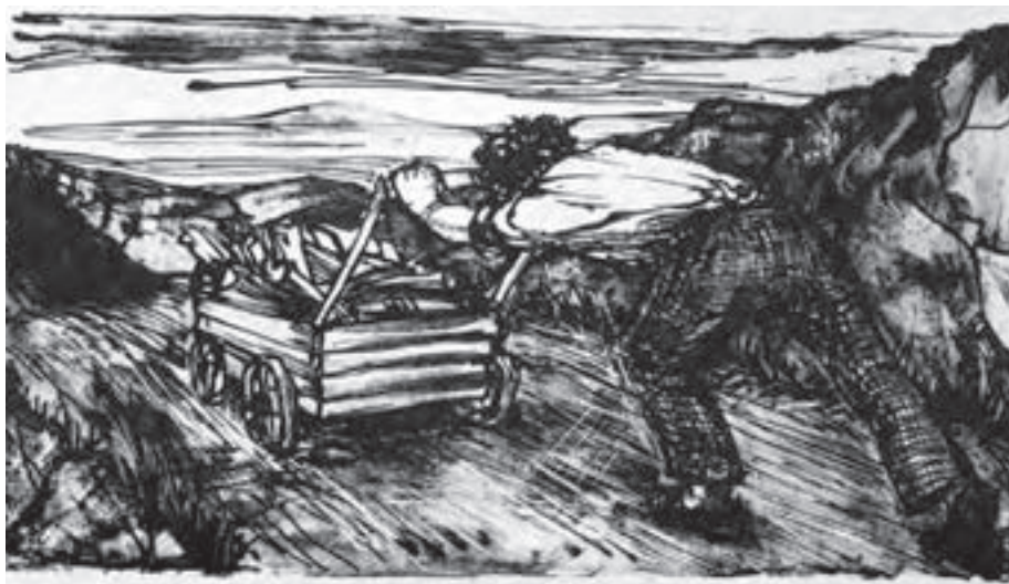
تصویر ۳۷- نیلا امیر ابراهیمی - لیتوگرافی - ۲۷×۱۴/۵ سانتی متر - ۱۳۵۶ شمسی.