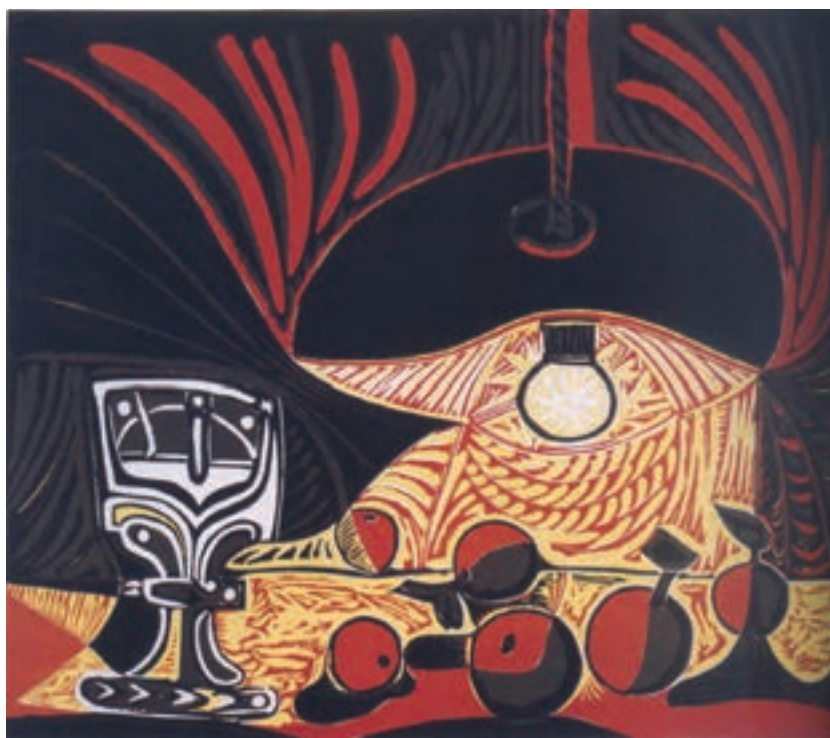
تصویر ۲۲- پابلو پیکاسو- حکاکی روی لیتولوم - ۶۲×۷۵/۳ سانتی‌متر- ۱۸۵۷ م.