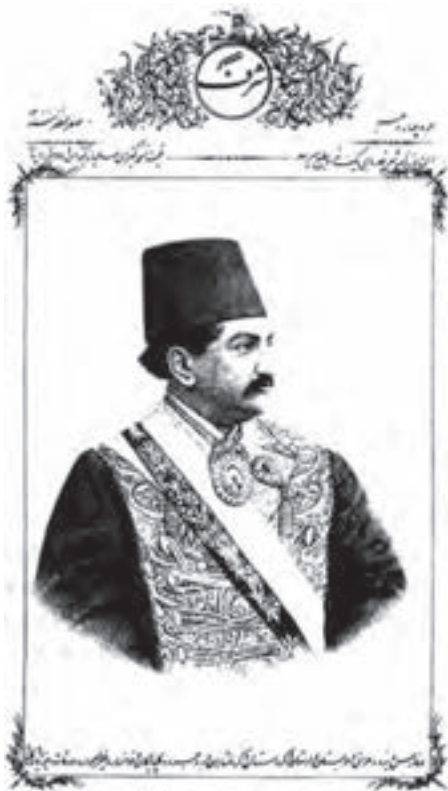
تصویر ۲۷- چهره ابوتراب غفاری - صفحه اول روزنامه شرف - لیتوگرافی - ۱۳۰۱ هجری. به خط نستعلیق با استفاده از حاشیه‌های تزئینی.

در حدود هفده سال بعد (در سال ۱۲۵۰ قمری) با ورود دستگاه‌های چاپ سنگی (لیتوگرافی ۱ )، برای مدت نزدیک به ربع قرن این شیوه چاپی مورد استفاده قرار گرفت. نخستین چاپخانه مجهز به دستگاه‌های لیتوگرافی نیز نخستین بار در تبریز دایر شد و نخستین کتابی که چاپ کرد، قرآن بود. همچنین در این دوره نخستین مطبوعات ایرانی به روش لیتوگرافی چاپ و منتشر شدند.