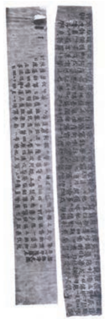
تصویر ۵- طلسم ها و سرودهای بودایی - ژاپن - ۷۷۰ م.

نخستین بول کاغذی نیز در سده نهم میلادی در چین طراحی و چاپ شد. همچنین در سده های نهم و دهم، کتاب های طوماری جای خود را به کتاب های آکاردئونی (دارای ورق های تاخورده) داد و در سده دهم و یازدهم کتاب های دوخته شده پدید آمد. چاپ کارت های بازی نیز شکل دیگری از طراحی گرافیک و چاپ اولیه بود که در چین رواج پیدا کرد. حروف متحرک اولیه در قرن یازدهم ابتدا در چین و سپس در کره به وجود آمد. چاپ در دنیای غرب: قدیمی ترین نمونه چاپ، پارچه ای است مربوط به سده ششم میلادی و به سبک شرقی، که با استفاده از قالب های چوبی اجرا شده و از داخل یک گور در اروپای شمالی به دست آمده است. در شرایطی که در سرزمین چین (و کشورهای مجاور) قرن ها از پیدایش و رواج چاپ می گذشت، روش استفاده از قالب چوبی بر روی کاغذ، در قرن سیزدهم از چین به اروپا منتقل شد. این آثار چاپی با متون مذهبی و تصاویر قدیسان همراه بود که به تدریج به چاپ کتاب های کلیشه ای انجامید (تصویر ۷). قبل از این دوره کتاب ها با دست نوشته می شد و نقاشان و تذهیب کاران آنها را مصور و مزین می ساختند.