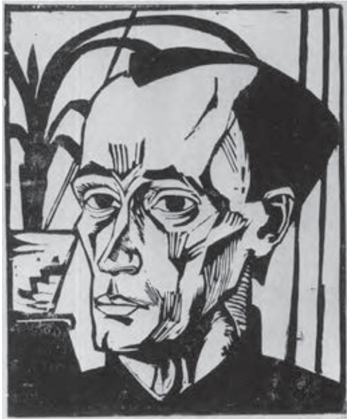
تصویر ۱۹- اریک هکل - حکاکی روی چوب - ۳۶/۵×۲۹/۸ سانتی‌متر - ۱۹۱۷ م.

ثبت اختراع چاپ «سیلک اسکرین» در قرن بیستم میلادی به نام «ساموئل سیمون» ۱ انگلیسی باعث شد عمل چاپ که تا ابتدای سده بیستم بیشتر روی صفحات کاغذی تخت (یا پارچه) انجام می‌گرفت، روی انواع سطوح با جنسیت‌های مختلف و شکل‌های گوناگون ممکن شود.