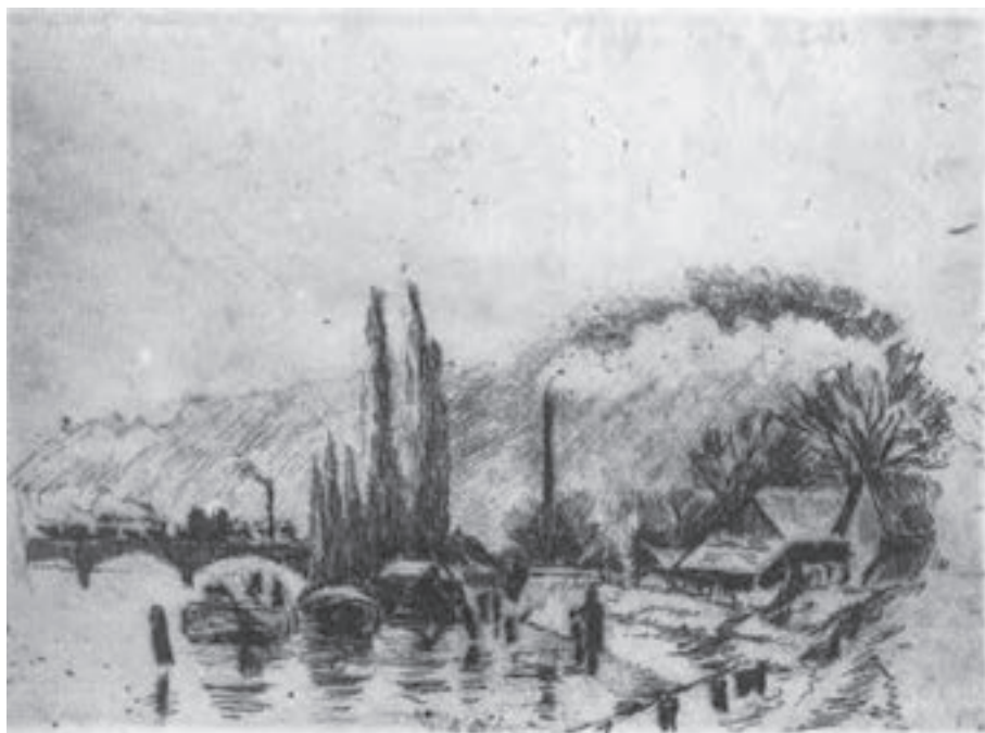
تصویر ۱۳- کامیل پیسارو - حکاکی روی فلز (شیوهٔ اچینگ و درای پوینت) - ۱۲/۸×۱۷/۵ سانتی متر - ۱۸۸۵ م.