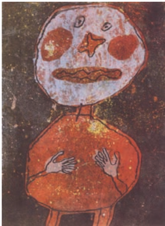
تصویر ۱۴- ژان دو بوفه - لیتوگرافی - ۳۷/۹×۵۲ سانتی‌متر - ۱۹۶۲ م.

از سوی دیگر چاپ به وسیلهٔ باسمه‌های چوبی، در طول سده‌های هفده تا نوزده میلادی در ژاپن به اوج خود رسیده بود و هنرمندان بسیاری از جمله «هوکوسای» ۴ و در سده نوزدهم آثار ماندگاری در این زمینه به وجود آورده است. به دنبال آشنایی هنرمندان اروپایی با حکاکی‌های چوبی ژاپنی در نیمهٔ دوم سده نوزدهم حکاکی روی چوب نیز دوباره رونق گرفت و هنرمندانی چون «پل گوگن» ۵ ، «ادوارد مونش» ۶ ، «موریس اشتر» ۷ و دیگران آثاری را در این زمینه ایجاد کردند (تصاویر ۱۶ و ۱۷ و ۱۸ و ۱۹).