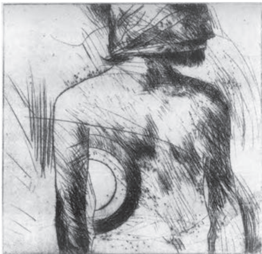
تصویر ۳۲- نیکزاد نجومی - حکاکی روی فلز- ۲۲/۳×۲۲/۳ سانتی متر- ۱۹۷۶ م. (برگرفته از کتاب چاپ دستی تکنیک کالکوگرافی)