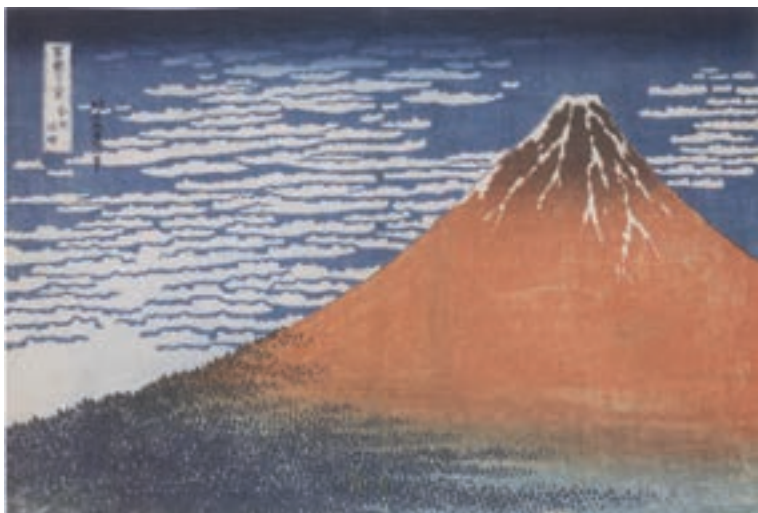
تصویر ۱۷- کاتسوشیکا هوکوسای - از مجموعه ۳۶ منظره از کوه فوجی - ۲۵×۲۸ سانتی متر - بین ۱۸۲۰ تا ۱۸۳۰ م.