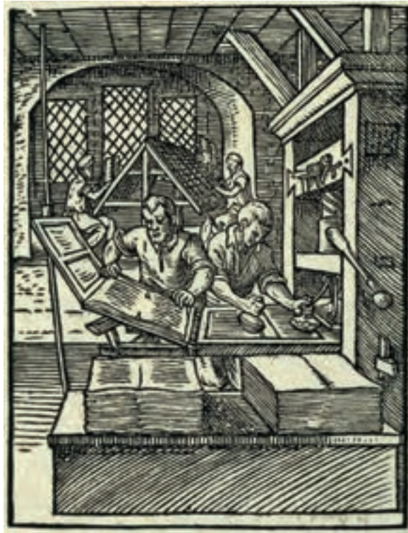
تصویر ۷- صفحه‌ای از یک کتاب کلیشه‌ای - چاپ شده با کلیشه چوبی حکاکی شده.

اختراع چاپ با حروف متحرک فلزی در قرن پانزدهم میلادی به وسیله یوهان گوتنبرگ ۱ آلمانی نقطه عطفی در تاریخ چاپ شد که با طی کردن قرن‌ها به صنعت رسانه‌ای قدرتمندی تبدیل گشت. در فاصله سده‌های پانزدهم تا نوزدهم میلادی استفاده از لوحه‌های فلزی خیلی زود جای خود را در مصور کردن کتاب‌های چایی باز کرد و تقریباً جای قالب‌های چوبی را گرفت. آلبرشت دورر نقاش آلمانی در سال‌های پایانی سده پانزدهم و ابتدای سده شانزدهم میلادی آثار ماندگاری در هر دو زمینه خلق کرده است (تصویر ۸ و ۹). «رامبراند» ۲ (سده هفدهم) و «فرانسیسکو گویا» ۳ (اواخر سده هیجدهم و اوایل سده نوزدهم) و همچنین نقاشان قرن نوزدهم و بیستم چون، (ادوارد مانه) ۴ (کته کولویتس) ۵ ، (واسیلی کاندینسکی) ۶ ، (هنری ماتیس) ۷ ، «پابلو پیکاسو» ۸ و دیگران آثار با ارزشی با تکنیک حکاکی روی فلز از خود به یادگار گذاشته‌اند (تصاویر ۱۰ و ۱۱ و ۱۲ و ۱۳).