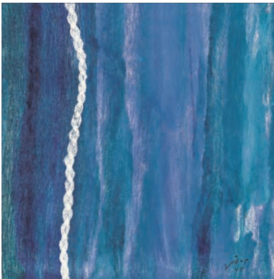
تصویر ۳۴- مینا نوری - مونوپرینت - ۱۹/۵×۱۹/۵ سانتی متر- ۱۳۷۳ شمسی .