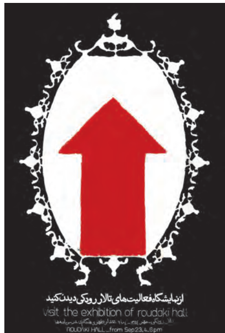
تصویر ۲۸- صادق بریرانی - سیلک اسکرین - دهه ۴۰ شمسی.