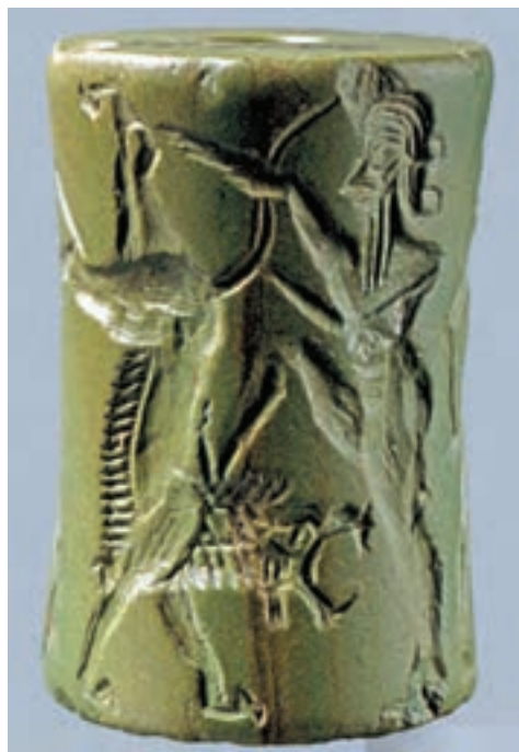
تصویر ۲- مهر استوانه‌ای و اثر نقش آن بر لوحه گلی. بین‌النهرین، ۲۳۵۰ تا ۲۱۵۰ پیش از میلاد.