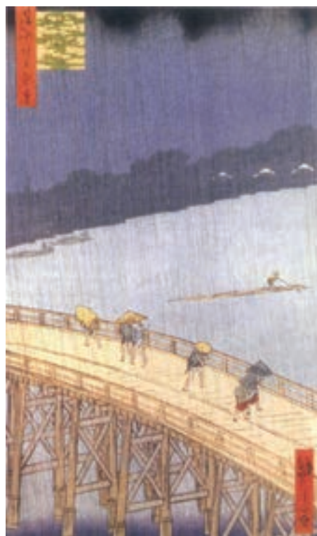
تصویر ۱۶- آندو توکیتارو هیروشیج (هیروشیگه) - رگبار روی پل اوهاشی - حکاکی روی چوب - ۱۸۵۷ م.