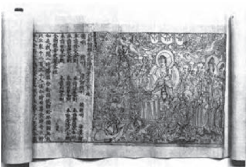
تصویر ۶- دیاموند ساترا- اثر چاپی از باسمة چوبی حکاکی شده - چین - ۸۶۸ میلادی.