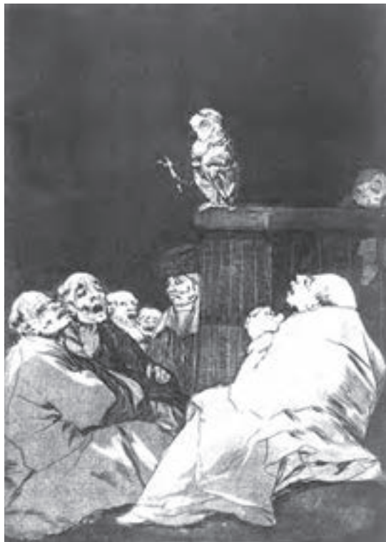
تصویر ۱۱- فرانسیسکو گویا - حکاکی روی فلز - ۱۳/۶×۱۹ سانتی متر - ۱۷۹۹ م.