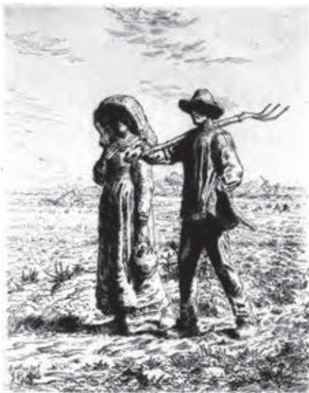
تصویر ۱۲- فرانسوا میله - حکاکی روی فلز (شیوهٔ اچینگ) - ۳۸/۶×۳۰/۵ سانتی متر - ۱۸۶۳ م.