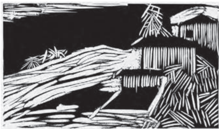
تصویر ۳۵- مینا نوری - حکاکی روی لینولئوم - ۱۳/۵×۲۳/۵ سانتی متر- ۱۳۵۲ شمسی .