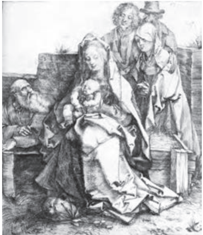
تصویر ۸- آلبرشت دورر- حکاکای روی فلز (شیوه درای پوینت)