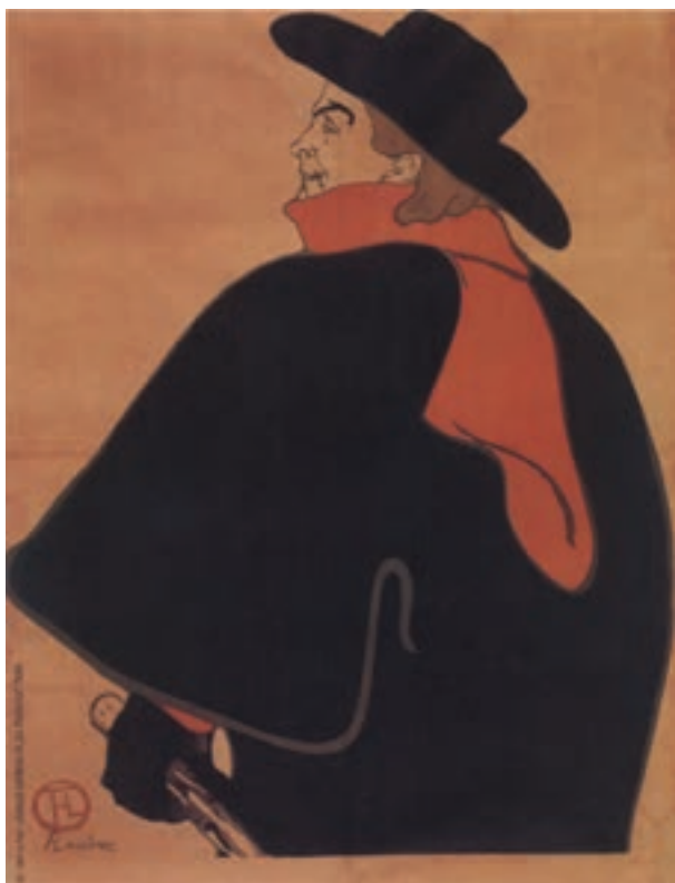
تصویر ۱۵- تولوز لوترک - لیتوگرافی - ۹۵×۱۲۷/۳ سانتی‌متر - ۱۸۹۳ م.

روش «لیتوگرافی» در قرن هیجدهم میلادی توسط «آلويس زنفلدر» ۱ به وجود آمد که بعدها به فراگیرترین شکل چاپ در سده‌های نوزدهم و بیستم تبدیل شد و پس از طی مراحل در شکل صنعتی شده خود به نام «چاپ افست» ۲ معروف گردید. در سده نوزدهم و بیستم روش لیتوگرافی بسیار مورد توجه هنرمندان بود و «فرانسیسکو گویا» «تولوز لوترک» ۳ «ماتیس» «پیکاسو» و دیگران آثار ارزشمندی را در این زمینه به وجود آورده‌اند (تصویر ۱۴ و ۱۵).