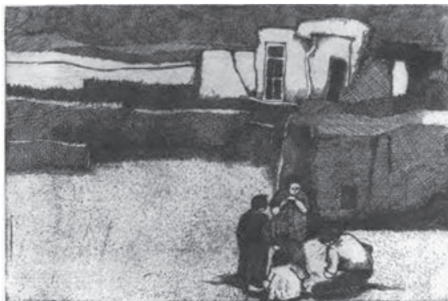
تصویر ۳۳- ناهید حقیقت - حکاکی روی فلز- ۱۵/۱×۲۲/۷ سانتی متر- ۱۹۷۳ م. (برگرفته از کتاب چاپ دستی تکنیک کالکوگرافی)