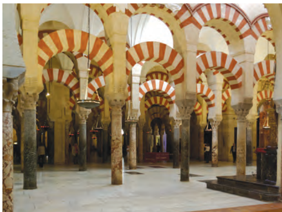
مسجد جامع قرطبه

شکوفایی معماری: اندلس اسلامی در عرصه معماری نیز بسیار شکوفا بود. مسجد جامع قرطبه و کاخ الحمراء غرناطه، دو شاهکار معماری جهان اسلام به شمار می‌روند که سالانه