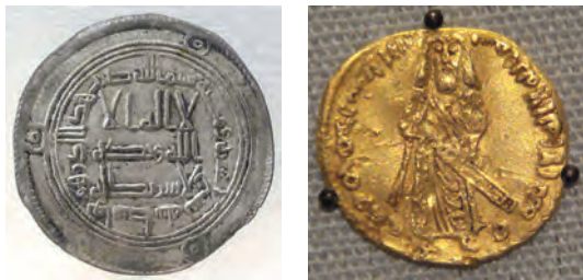
نمونه‌ای از سکه‌های دوره امویان

خلفای اموی، بیت‌المال مسلمانان را همچون خزانه شخصی می‌دانستند و در توزیع درآمدهای عمومی، بیشتر منافع شخصی، خاندانی، قبیله‌ای و قومی خود را در نظر داشتند. برای مثال، امویان شیوه توزیع مساوی عطایا میان مسلمانان را که علی علیه السلام بنا نهاده بود، تغییر دادند و سهم به مراتب کمتری برای مسلمانان غیرعرب (موالی) در نظر گرفتند. همچنین در زمان برخی از خلفای اموی، برخلاف تأکید صریح اسلام، از نومسلمانان در خراسان و مناطق دیگر جزیه گرفته شد.