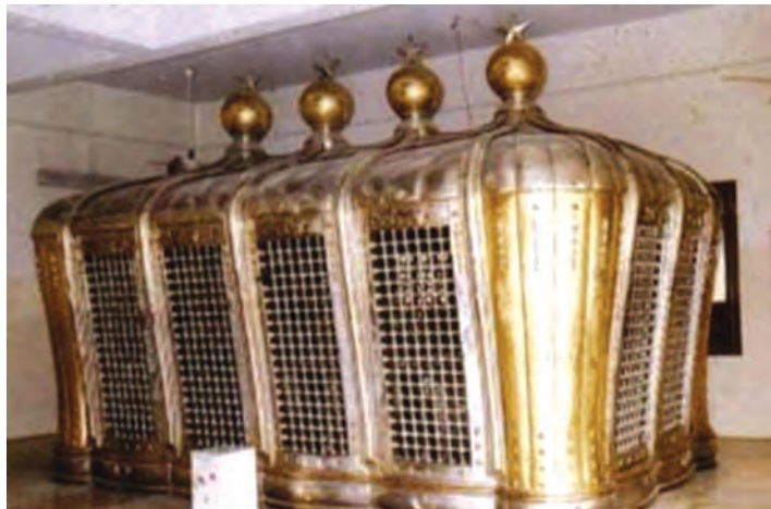
بارگاه و ضریح امامان شیعه در قبرستان بقیع پیش از تخریب