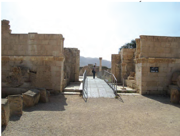
بقایای کاخ هشام بن عبدالملک در اربعا

درباره ارتباط مشروعیت و مقبولیت نداشتن حکومت‌ها با توسل آنها به زور و خشونت گفت‌وگو نمایید.