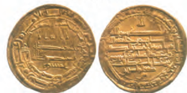
ضرب اصفهان سال ۲۰۴ق

سکه‌هایی که در زمان ولایتعهدی امام رضا علیه السلام به نام ایشان در شهرهای مختلف ضرب شده است.