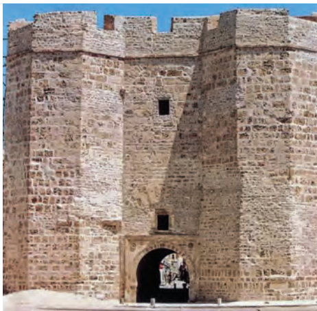
بقایای دروازه مهدیه، نخستین پایتخت فاطمیان در تونس امروزی

امام کاظم، امام جواد، امام هادی و امام حسن عسکری علیهم السلام