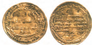
ضرب محمدیه (ری) سال ۲۰۲ق