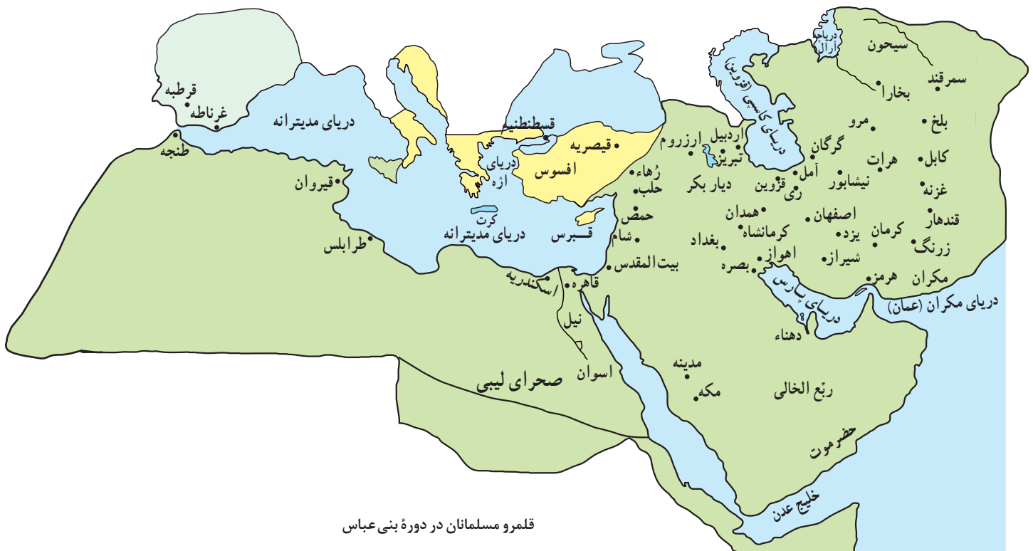
قلمرو مسلمانان در دوره بنی عباس

در این دوره که صد سال نخست حکومت عباسیان را شامل می‌شود، خلفا از قدرت و نفوذ فوق‌العاده‌ای برخوردار بودند و توانستند تا حد زیادی یکپارچگی قلمرو خلافت را حفظ و قیام‌ها