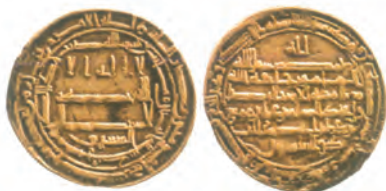
ضرب سمرقند سال ۲۰۲ق

فعالیت امامان بعد از امام رضا علیه السلام ، یعنی امام جواد (محمد تقی)، امام هادی (علی النقی) و امام حسن عسکری علیه السلام تا عصر غیبت امام مهدی علیه السلام (۲۶۰ق) بر تربیت شاگردان و یاران برجسته، مقابله با تحریف مبانی دینی و سنت نبوی، حفظ جامعه شیعی و