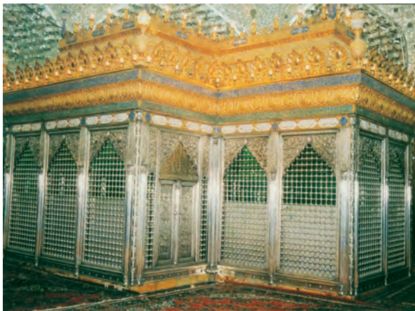
ضریح حرم مطهر امام هادی و امام حسن عسکری علیهما السلام

مبارزه با جریان‌های فکری و فرهنگی انحرافی در شیعه متمرکز بود. آنان به شدت تحت مراقبت جاسوسان و دستگاه امنیتی خلافت عباسی قرار داشتند و ناگزیر به اقامت در سامرا شدند. از زمان امام صادق علیه السلام ، حرکتی در جامعه اسلامی با عنوان جریان وکالت آغاز شد و در دوران امامان بعدی به اوج خود رسید. وکلای ائمه کسانی بودند که در مکتب اهل بیت آموزش دیده بودند و با اجازه آنان به عنوان مرجع امور دینی مردم در شهرهای مختلف ایفای نقش می‌کردند. جریان وکالت در دوران غیبت نیز تا مدتی ادامه یافت و در پی آن مرجعیت شیعی شکل گرفت.