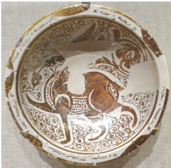
نمونه‌ای از ظروف سفالی عصر فاطمیان

هنر و صنعت نیز در دوران فاطمیان پررونق بود. از جمله هنرهای رایج در آن زمان، می‌توان به نقاشی، شیشه‌گری، کاشی‌کاری، منبت‌کاری، کاغذسازی و فلزکاری اشاره کرد. هنرمندان آن دوره در برخی از هنرها، مانند شیشه‌گری، بلورسازی و سفالگری به نوآوری پرداختند و شیوه‌های جدیدی را ابداع کردند.