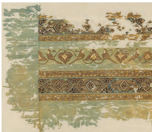
بقایای نمونه‌ای از منسوجات عصر فاطمیان

صنعت پارچه‌بافی در زمان فاطمیان رواج زیادی یافت و مراکز و کارگاه‌های پارچه‌بافی متعددی در شهرهای مختلف مصر از جمله قاهره مشغول تولید انواع منسوجات بودند. برخی از این مراکز، پارچه‌های گران‌قیمت و تزئینی را که مخصوص خلفا و دولتمردان فاطمی بود، تولید می‌کردند. در دربار فاطمیان، خزانه‌ای مخصوص لباس وجود داشت و دارای انباری از لباس‌های متنوع بود که در مناسبت‌های گوناگون و متناسب با فصول مختلف میان کارکنان دربار توزیع می‌شد.