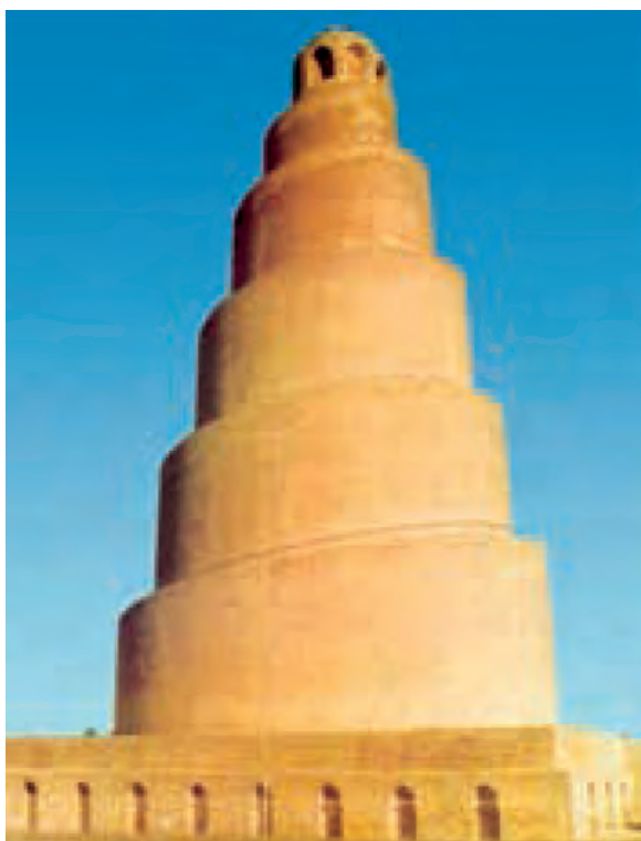
مناره مسجد جامع سامرا که در دوره خلافت متوکل ساخته شد

فراهم آمد، تحول فکری و علمی عظیمی در میان مسلمانان ایجاد شد. آثار و پیامدهای این تحول، پیشرفت فوق العاده مسلمانان در رشته‌های مختلف علوم و معارف و پا به عرصه نهادن دانشمندان و متفکران بزرگی بود که در درس‌های بعدی، شرح حال و آثار آنان، به فراخور حال، بررسی خواهد شد.