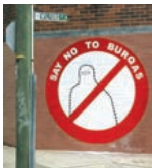
■ مسئله شدن حجاب در کشورهای اروپایی