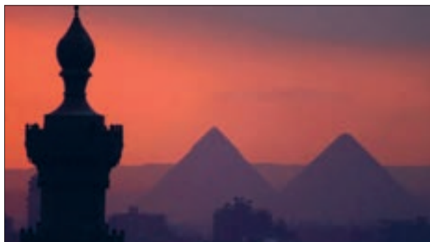
■ مصر در تعامل با جهان اسلام و پذیرش عقاید و ارزش‌های توحیدی آن، دچار تحولات هویتی شد.