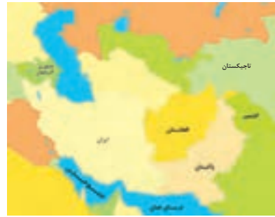
■ نقشه کشورهای فارسی زبان

■ مسلمانان پس از فتح ایران با نظام دیوانی ایرانیان روبه‌رو شدند. آنان سابقه مملکت‌داری چندانی نداشتند و برای اداره قلمرو گسترده، ثبت و ضبط اموال و غنایم و بیت‌المال، از کارگزاران ایرانی و نظام دیوانی آنها استفاده می‌کردند.