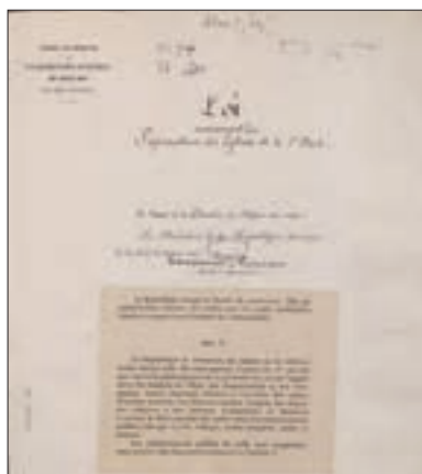
■ جمهوری خواهان لائیک فرانسوی در سال ۱۹۰۵ م قانونی را به تصویب مجلس ملی فرانسه رساندند که براساس آن دین از آخرین عرصه‌های حضور اجتماعی خود حذف شد.

ممکن است جهان اجتماعی در مواجهه با جهان‌های دیگر به «خودباختگی فرهنگی» گرفتار شود. جهان اجتماعی هنگامی به داد و ستد و تعامل می‌پردازد که اعضای آن، به طور فعال و خلاق براساس نیازها، مشکلات و مسائل خود، با جهان اجتماعی دیگر رویارو شوند. اما اگر اعضای آن مبهور و مقهور جهان اجتماعی دیگر شوند و در نتیجه، حالت فعال و خلاق خود را در گزینش عناصر فرهنگی دیگر از دست بدهند، دچار خودباختگی فرهنگی می‌شوند؛ در آن صورت عناصر فرهنگی دیگر را بدون تحقیق و گزینش و به صورت تقلیدی فرا می‌گیرند. جهان اجتماعی خودباخته، به روش تقلیدی عمل می‌کند و ارتباطش را با فرهنگ و تاریخ خود از دست می‌دهد، بنابراین نه می‌تواند فرهنگ گذشته خود را تداوم ببخشد یا گسترش دهد و نه می‌تواند آن را رها کند و از آن بگذرد و به جهان اجتماعی دیگری که مبهور و مقهور آن شده است، ملحق شود. از اینجا رانده و از آنجا مانده!