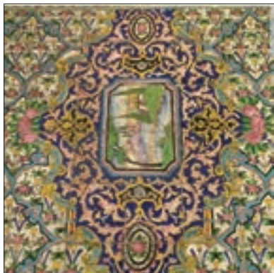
■ کلبه‌ای کوچک به سبک نقاشی‌های اروپایی روی کاشی‌های ایرانی (کاخ گلستان)

بسیاری از جوامع غیر غربی، در رویارویی با جهان غرب، به دلیل اینکه مرعوب قدرت اقتصادی و سیاسی برتر غرب گشتند، به خودباختگی فرهنگی گرفتار شدند. خودباختگی جوامع غیر غربی در برابر جهان غرب را «غرب زدگی» می نامند.