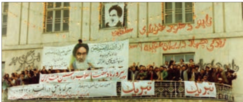
■ تبلور تحولات هویتی در شعارهای انقلابی

انقلاب‌ها از مهم‌ترین تحولات در هر جهان اجتماعی محسوب می‌شوند. یکی از مهم‌ترین بحث‌ها دربارهٔ انقلاب، دستاوردها و پیامدهای آن می‌باشد. پیامدهای انقلاب را به شیوه‌های مختلفی دسته‌بندی می‌کنند. مثلاً پیامدهای کوتاه مدت، میان مدت و بلند مدت؛ یا پیامدهای اقتصادی، سیاسی، اجتماعی و فرهنگی. یکی از مهم‌ترین پیامدهای انقلاب، تحولات هویتی است. انقلاب اسلامی چه آثار هویتی‌ای در ایران و جهان به دنبال آورد؟