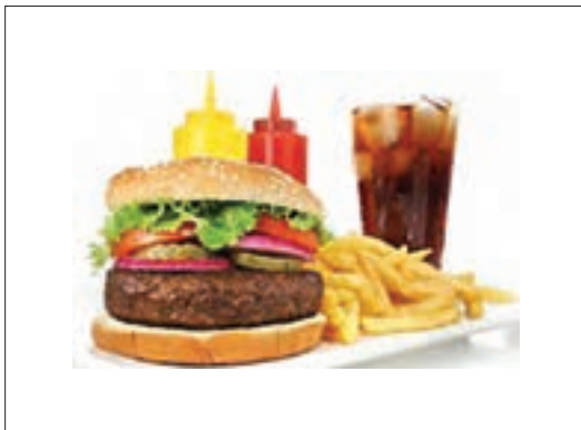
■ رواج غذاهای آماده و نوشیدنی‌های گازدار ناسالم