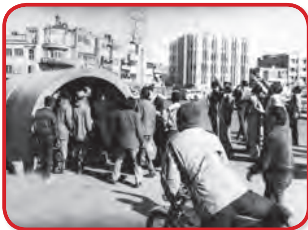
نمونه ای از پناهگاه های عمومی

۵- مکان یابی: از اقدامات اساسی و مهم پدافند غیرعامل، انتخاب محل مناسب برای ایجاد تأسیسات حیاتی و مهم کشور است. ایجاد این تأسیسات در دشت های هموار، کنار بزرگراه ها و جاده های اصلی و در نزدیکی مرزها موجب شناسایی و آسیب پذیری آنها در برابر تهدیدات دشمنان می شود. ۶- مقاوم سازی و استحکامات: یکی از کارهای مفیدی که در زمان صلح می توان انجام داد تا در زمان حادثه از آن استفاده شود، ساخت مکان هایی است که در مقابل بمب و موشک مقاوم باشد و آثار ترکش و موج انفجار را تا حدود زیادی خنثی کند. بنابراین احداث پناهگاه در مجتمع های مسکونی و اداری و همچنین ساخت پناهگاه های عمومی در شهرها، یکی از اقدامات مفیدی است که باعث حفظ جان انسان ها در زمان وقوع حادثه می شود.