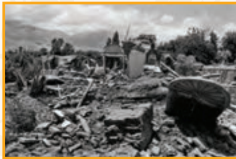
● زمین لرزه رودبار : ساعت ۳۰ دقیقه بامداد روز ۳۱ خرداد ۱۳۶۹ ۷/۴ در مقیاس ریشتر