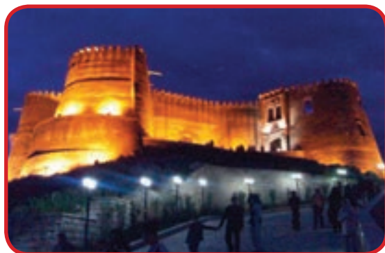
قلعه فلک الافلاک در خرم آباد یکی از اماکن مستحکم در دوران قدیم ایران