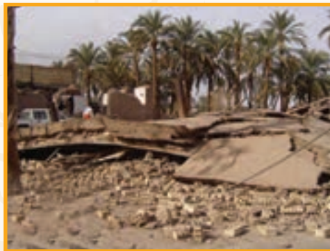
● زمین لرزه بم : ساعت ۵/۲۶ بامداد روز ۵ دیماه ۱۳۸۲ ۶/۵ در مقیاس ریشتر