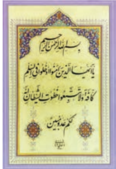
سوره بقره آیه ۲۰۸

یکی از تفاسیر بسیار خوب، تفسیر نمونه نام دارد که با همکاری جمعی از دانشمندان و زیر نظر آیت الله مکارم شیرازی در ۲۷ جلد تألیف شده است.