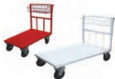
شکل ۲۶- انواع چرخ دستی