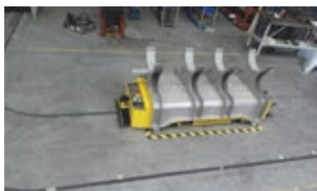
شکل ۲۹- مراحل حرکت ماشین اتوماتیک بر روی ریل