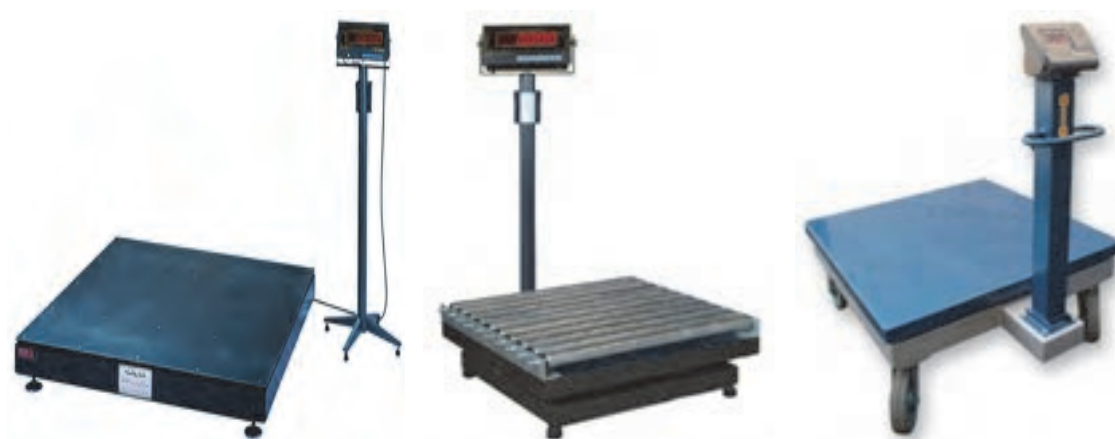
شکل ۳۲ - باسکول کفه‌ای