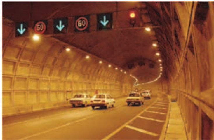
شکل ۱۷- نمایی از تابلوهای محدودیت سرعت

■ تأسیسات ایمنی راه: این بخش شامل روشنایی و تهویه تونل‌ها، روشنایی تقاطع‌ها، یخ‌زدایی مسیر در فصول سرد و ... است.