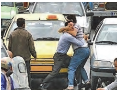
شکل ۲۳- عصبانیت در رانندگی

پس لاجرم دانستن چگونگی رفتار صحیح برای یک راننده واجب و ضروری است. برخی مواردی که یک راننده از آغاز تا پایان روزکاری باید مدنظر قرار دهد به شرح زیر می باشد: