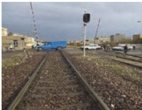
شکل ۱۴- تقاطع همسطح جاده و ریل

■ ایمنی راه و حریم آن: مانند طراحی ایمن راه با توجه به محدودیت‌های سرعت، تقاطع با سایر راه‌ها همچون راه‌آهن و ایمنی در راه‌های دسترسی به تأسیسات و اماکن مجاور.