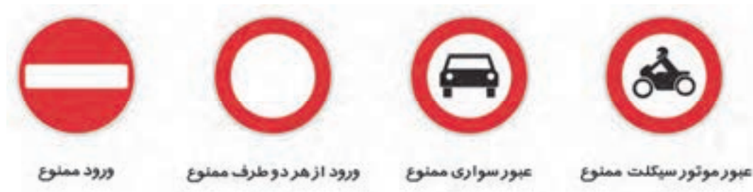
شکل ۲- علائم و تابلوهای راهنمایی و رانندگی

■ آیین نامه: مقرراتی است که توسط دولت تصویب می شود و به تشریح و توضیح قانون بالادستی می پردازد و در مقایسه با قانون از اعتبار کمتری برخوردار است. مانند «آیین نامه اجرایی قانون جلوگیری از آلودگی هوا» که در آن راه های مقابله با آلودگی هوا و وظایف سازمان ها و نهادها را تعیین کرده است. یا آیین نامه اجرایی نحوه انجام معاینه و صدور برگ معاینه فنی خودرو و یا آیین نامه راهنمایی و رانندگی که مقررات، تابلوها و علائم مربوط به رانندگی را مشخص کرده است.