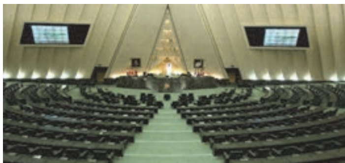
شکل ۱- تصویب قوانین در صحن مجلس شورای اسلامی توسط نمایندگان

■ قانون: مقرراتی است که توسط نمایندگان مردم و در مجلس شورای اسلامی تصویب می‌شود. رعایت قانون برای همه مردم لازم است، همه در برابر قانون مساوی هستند و هر چه‌قدر افراد جامعه قانون مدار باشند انسجام جامعه بیشتر است و کارها بهتر انجام می‌شود. قانون معمولاً شامل دستورات کلی است و عمل نکردن به آن مجازات دارد. مانند قانون «ایمنی راه‌ها و راه آهن» که اصلی‌ترین مقررات مربوط به ایمنی راه را بیان کرده است.