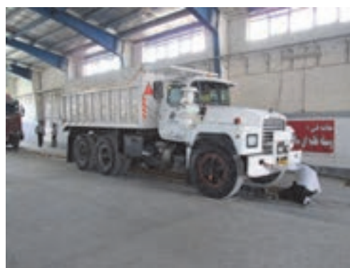
شکل ۱۱- مرکز مکانیزه معاینه فنی خودروهای سنگین