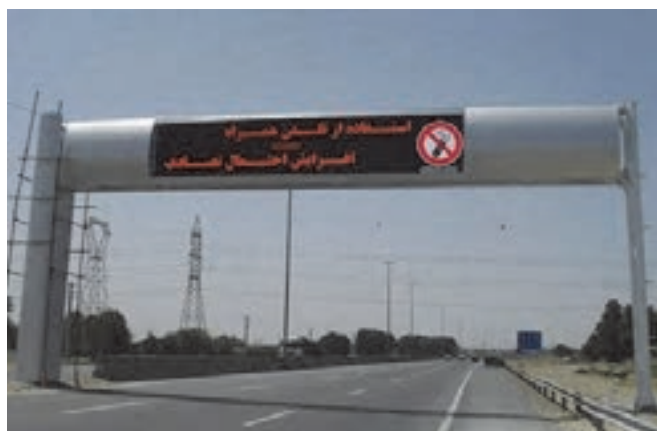
شکل ۱۶- نمایی از تابلوهای پیام متغیر

استفاده از تجهیزات ایمنی در راه‌ها می‌تواند باعث کاهش تلفات جاده‌ای گردد. سرعت‌کاه و سرعت‌گیرها، جداکننده مسیر، حفاظ جاده و ...، تابلوهای پیام متغیر، تابلوهای محدودیت سرعت و ... از جمله تجهیزات مورد استفاده برای افزایش ایمنی در جاده‌ها می‌باشند.