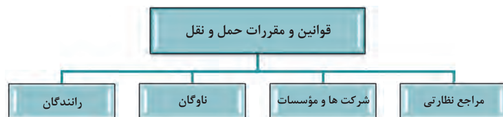
نمودار ۱- طبقه‌بندی قوانین و مقررات حمل و نقل

حمل و نقل نیز مانند بسیاری از موضوعات دیگر دارای قوانین و مقررات خاصی است که طبقه‌بندی‌های مختلفی از آن وجود دارد، یکی از این طبقه‌بندی‌ها به شرح زیر است: