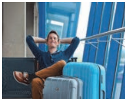
شکل ۲۲- رضایت مسافران

یکی از مشکلاتی که همیشه گریبان‌گیر شیوه‌های مختلف حمل و نقل در بخش ارائه بلیت به مسافران می‌باشد، عدم امکان ارائه بلیت به همه متقاضیان است که همیشه موجب نارضایتی مسافران را به همراه دارد. همچنین در بخش جابه‌جایی کالا نیز مشکلاتی در قسمت‌های پذیرش و تحویل کالا به متقاضی و صاحبان بار وجود دارد. علاوه بر رضایت مشتری از تهیه بلیت موارد زیر نیز بسیار مهم و ضروری هستند: