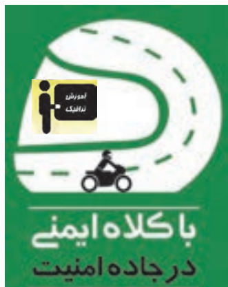
شکل ۱۰- نمونه‌ای از آموزش نکات ایمنی

استفاده از تجهیزات ایمنی برای رانندگی ایمن بسیار مؤثر است. نکات ایمنی بسیار زیادی وجود دارد که یادگیری آنها نیازمند مطالعه منابع تکمیلی و تمرین‌های عملی است.