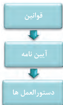
شکل ۳- ساختار سلسله مراتبی

ساختار سلسله مراتبی قوانین، آیین نامه و دستورالعمل های به ترتیب زیر است: