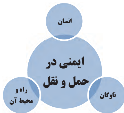
شکل ۹- عوامل کلی مؤثر در ایمنی حمل‌ونقل

در ادامه نمونه‌هایی از عوامل مؤثر در ایمنی به تفکیک عوامل انسانی، عوامل مربوط به ناوگان و عوامل مربوط به راه و محیط آن بیان می‌شود.