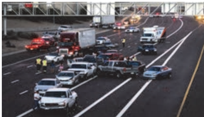
شکل ۷- نمونه‌ای از تصادف ترافیکی

■ تصادف ترافیکی: برخورد یک وسیله نقلیه با وسیله نقلیه دیگر یا حیوان، انسان، اشیاء یا خروج وسیله نقلیه از جاده و یا واژگون شدن آن که منجر به جرح، فوت و خسارت گردد.