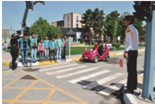
شکل ۴- ایمنی پیاده‌ها با استفاده از تابلوها

مبحث ایمنی به علت ارتباط با جان انسان‌ها از اولویت خاصی برخوردار می‌باشد زیرا جان انسان مورد احترام است. از آن‌جا که انسان موجودی آسیب‌پذیر است رشد و توسعه حمل‌ونقل نیز باید در راستای ایمنی بیشتر انسان‌ها و وسایل نقلیه باشد. از رایج‌ترین خطراتی که در حمل‌ونقل ایمنی افراد را تهدید می‌کند، خطر مربوط به تصادف با وسایل نقلیه است. ما تقریباً مجبور هستیم برای رفع نیازهای خود در شهر و یا بیرون از شهر رفت‌وآمد کنیم و از وسایل نقلیه عمومی یا شخصی استفاده نماییم. بنابراین اولین خطری که ممکن است ما را تهدید کند تصادف با وسایل نقلیه است. هنگام استفاده از وسایل نقلیه عمومی و شخصی (دوچرخه، موتورسیکلت، خودروی سواری)، حتی هنگام پیاده‌روی و عبور از خیابان، خطر تصادف، جان افراد را تهدید می‌کند. بنابراین ایمنی و استفاده از روش‌هایی که بتواند خطرات احتمالی در حمل‌ونقل را کاهش دهد، بسیار مهم است. در ارتباط با ایمنی در حمل‌ونقل مفاهیمی مانند حادثه، خطر، تصادف ترافیکی، شدت تصادف، نرخ تصادف وجود دارد که در این‌جا تعریف می‌شوند: