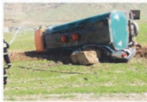
شکل ۱۲- واژگونی تانکر حمل سوخت به علت عدم رعایت نکات ایمنی