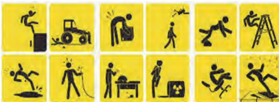
شکل ۵- اشکال خطر

■ خطر: شرایطی که می‌تواند منجر به سانحه یا رخداد شود. این شرایط قبل از حادثه را در برمی‌گیرد.