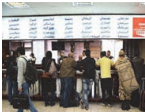
شکل ۲۰- نمونه‌هایی از باجه فروش بلیت