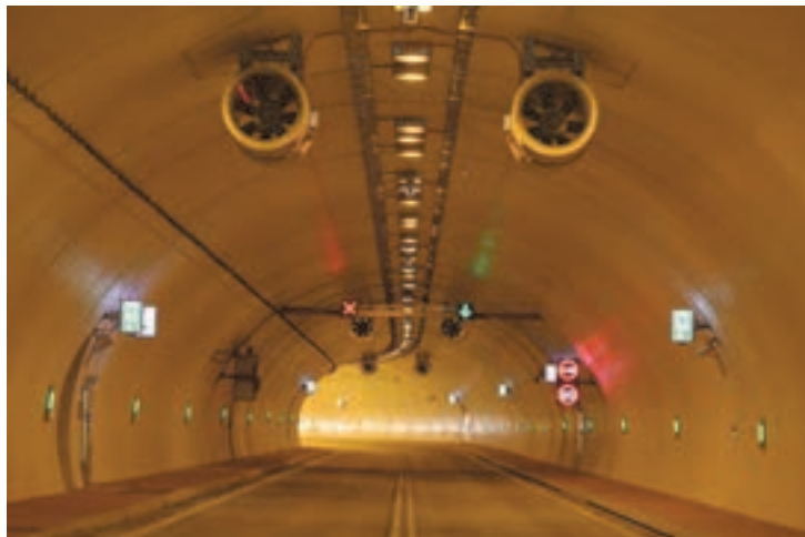
شکل ۱۸- تهویه‌های هوای نصب شده در تونل

■ تأسیسات ایمنی راه: این بخش شامل روشنایی و تهویه تونل‌ها، روشنایی تقاطع‌ها، یخ‌زدایی مسیر در فصول سرد و ... است.