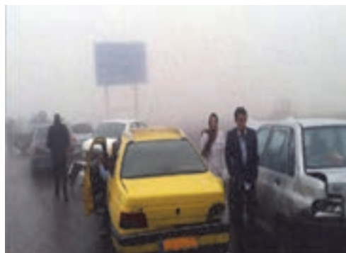
شکل ۸- مقایسه دو نمونه از شدت تصادف‌های ترافیکی

به تصاویر فوق نگاه کنید، شدت تصادف در کدام یک بیشتر است؟ چرا؟ گاهی تصادف ترافیکی منجر به جراحت می‌شود که جراحت نیز در بعضی مواقع منجر به فوت می‌شود و گاهی منجر به خسارت مالی می‌شود، بدون اینکه فردی در آن صدمه دیده باشد. میزان خسارت، جراحت مصدومان و تعداد فوت شدگان، شدت تصادف را مشخص می‌کنند.