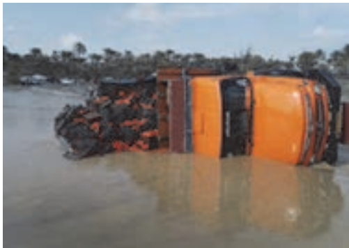
شکل ۱۳- واژگونی کامیون به علت حمل بار اضافه