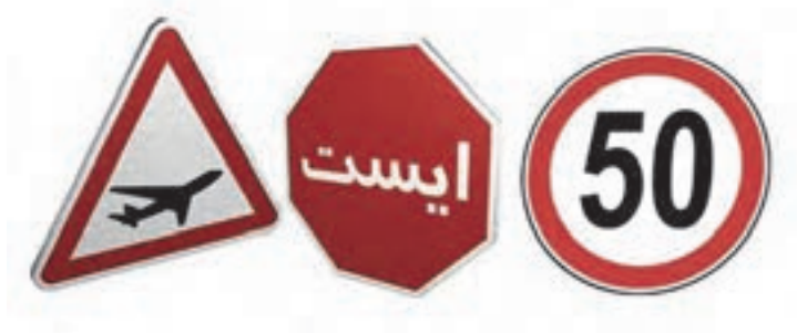
شکل ۱۵- علائم ایمنی راه

■ علائم و تجهیزات ایمنی راه: علائم افقی، عمودی و چراغ‌های راهنمایی به‌عنوان ابزار کنترل ترافیک و به‌منظور حرکت منظم و قابل پیش‌بینی ترافیک و در نتیجه فراهم شدن ایمنی راه، مورد استفاده قرار می‌گیرد. علائم انتظامی، اختارها و راهنمایی‌ها باعث کاهش تصادف و افزایش ایمنی می‌گردد. این علائم، با رنگ، اندازه و شکل خود پیامی به رانندگان انتقال می‌دهند که با رعایت آنها آمادگی و فرصت لازم برای واکنش راننده و در نتیجه ایمنی بیشتر فراهم می‌گردد. علائم افقی، عبارت است از خط‌کشی‌ها و علائم و نوشته‌هایی که روی سطح راه اجرا شده و قرار می‌گیرد. این علائم با رنگ‌ها و کیفیت‌های مختلف اجرا می‌شود. با افزودن ذرات شیشه بهتر دیده شدن آنها، به‌ویژه در شب، افزایش می‌یابد. علائم عمودی، کنار راه و یا بالای مسیر عبور نصب می‌شود.