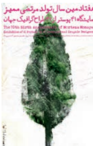
شکل ۳۱ - ۴ - طراحی برای پوستر