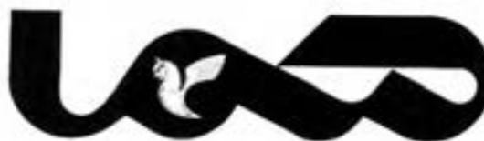
شکل ۴-۲- عنوان نشریه هما، طراح: مرتضی ممیز