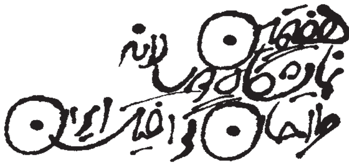
شکل ۱۶-۴- عنوان پوستر هفتمین نمایشگاه دوسالانه طراحان گرافیک - قبادشویا

این گونه فن ابداع و گزینش و تنظیم انواع حروف به عنوان یک تخصص مطرح شد و تایپوگرافی نام گرفت.