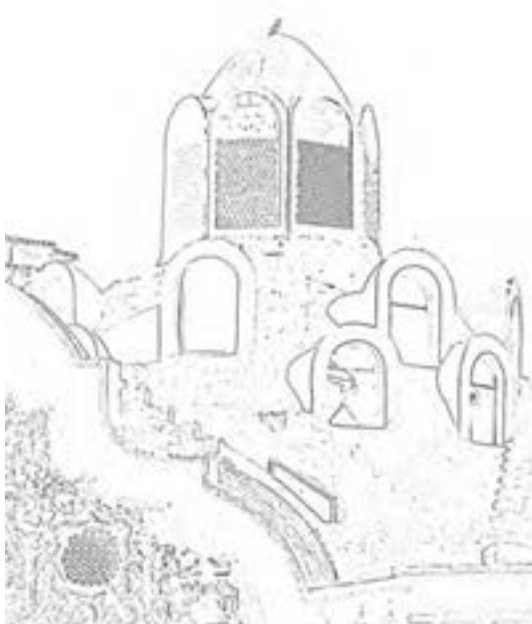
شکل ۳۳-۴- تصویر خانه بروجردی ها- معماری اسلامی- کاشان- که توسط نرم افزار طرح خطی از عکس گرفته شده است.