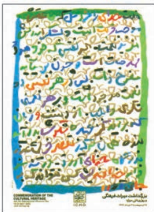
شکل ۴-۶- پوستر بزرگداشت میراث فرهنگی و روز جهانی موزه