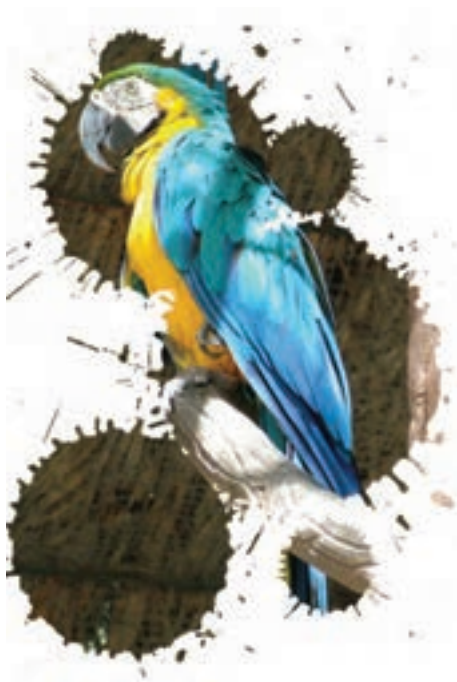
شکل ۳۲-۴- اثر گرافیکی بر روی عکس به وسیله برنامه نرم افزاری