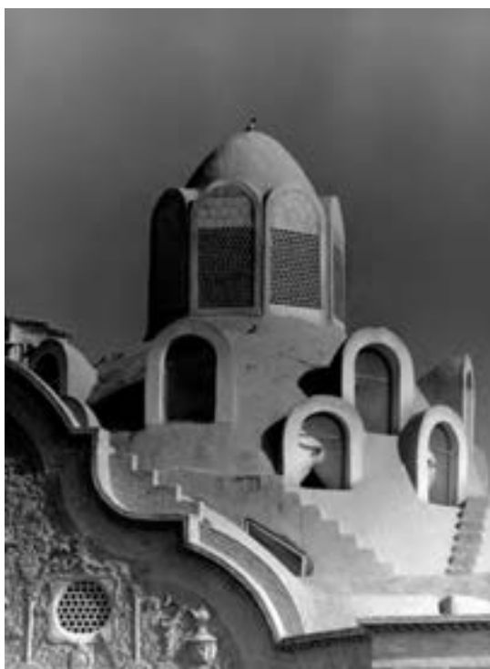
شکل ۳۴-۴- عکس از خانه بروجردی ها