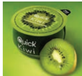
شکل ۸-۴- بسته‌بندی کیوی با استفاده از شکل میوه