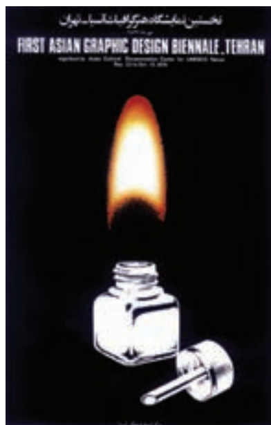
شکل ۴-۴- پوستر برای نخستین نمایشگاه هنر گرافیک آسیا ۷۰×۱۰۰ سانتی متر، طراح: مرتضی ممیز