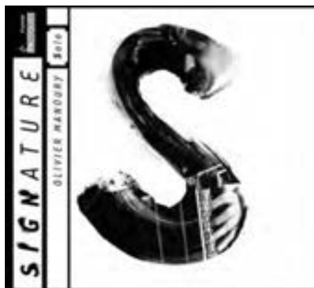
شکل ۲۹ - ۴ - طراحی برای لوح فشرده (CD)