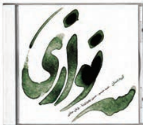
شکل ۲۸ - ۴ - طراحی برای لوح فشرده (CD)