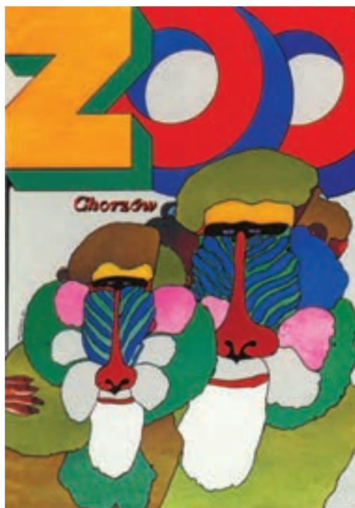
شکل ۴-۵- پوستر برای تبلیغ باغ وحش