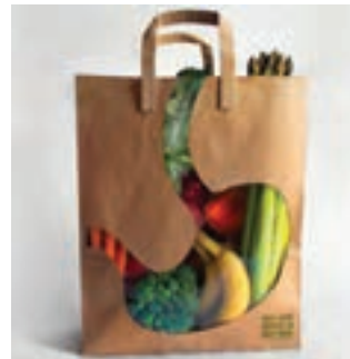
شکل ۷-۴- کیف دستی کاغذی مخصوص خرید میوه و سبزیجات با تأکید بر نقش میوه و سبزی‌ها در سلامتی انسان