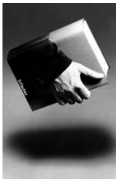
شکل ۳۰ - ۴ - طراحی برای پوشه