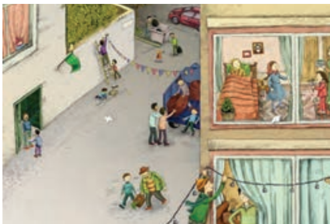
شکل ۵-۱- تصویرسازی برای جشن میلاد حضرت ولی عصر (عجل الله تعالی فرجه‌ه)

پس از انتخاب اتود نهایی، نوبت به انتخاب شیوه اجرا می‌رسد. در هر موضوع کاری، روش اجرا باید متناسب با محصول نهایی باشد. برای نمونه، استفاده از روش عکاسی در طراحی پوستر و یا محصولات بسته‌بندی شده مناسب به نظر می‌رسد. ممکن است در کار طراحی جلد و یا تصویرسازی، روش‌های بهتر دیگری نیز وجود داشته باشند.