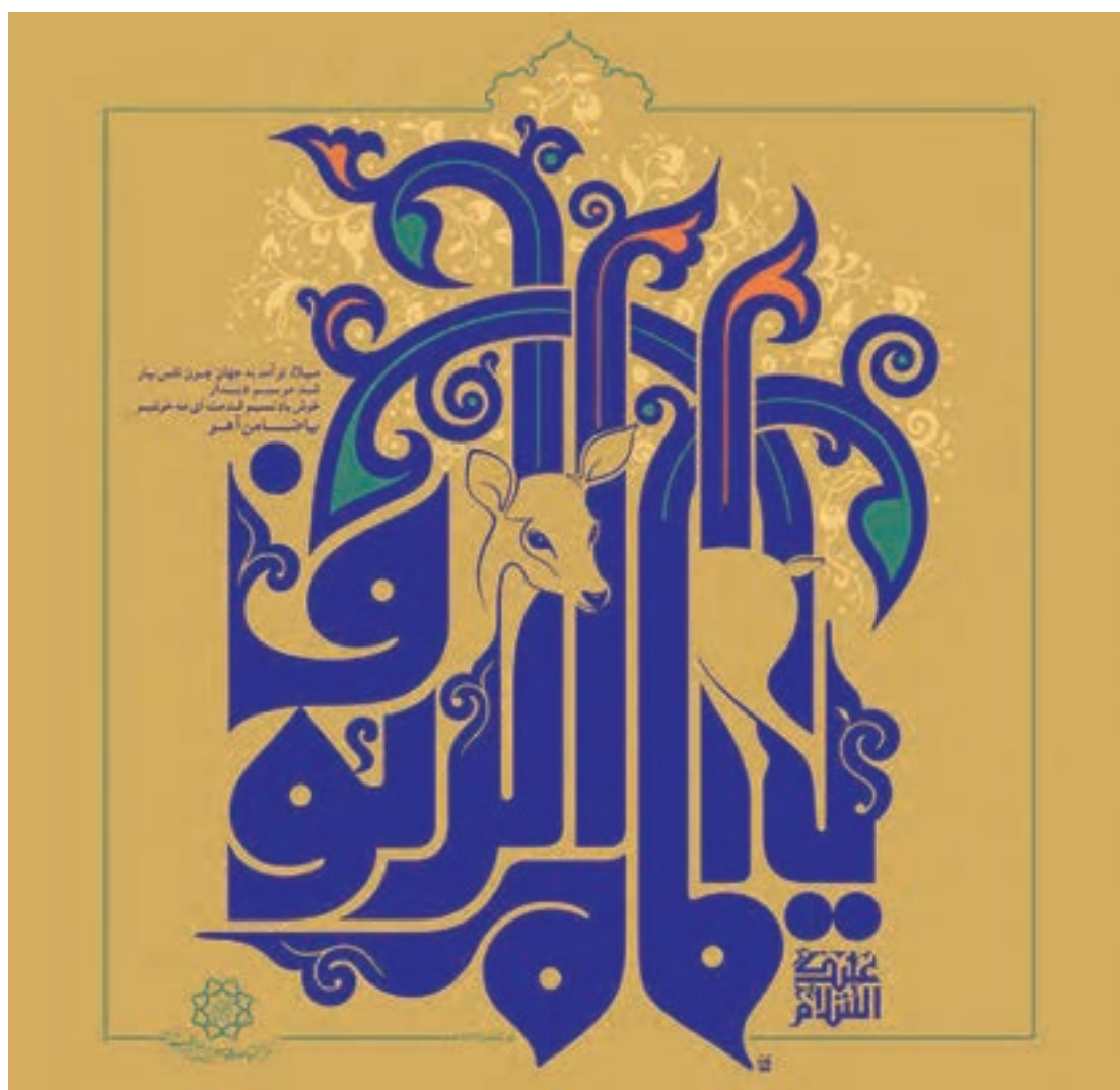
شکل ۱۹-۵- عنوان: «یا امام الرئوف»، اثر: مسعود نجابتی، برای میلاد حضرت امام رضا (علیه السلام) ضامن آهو