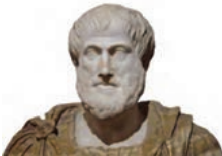
شکل ۷-۱- ارسطو

تربیت بدنی امری جهت‌دار و آماده‌سازی برای زندگی