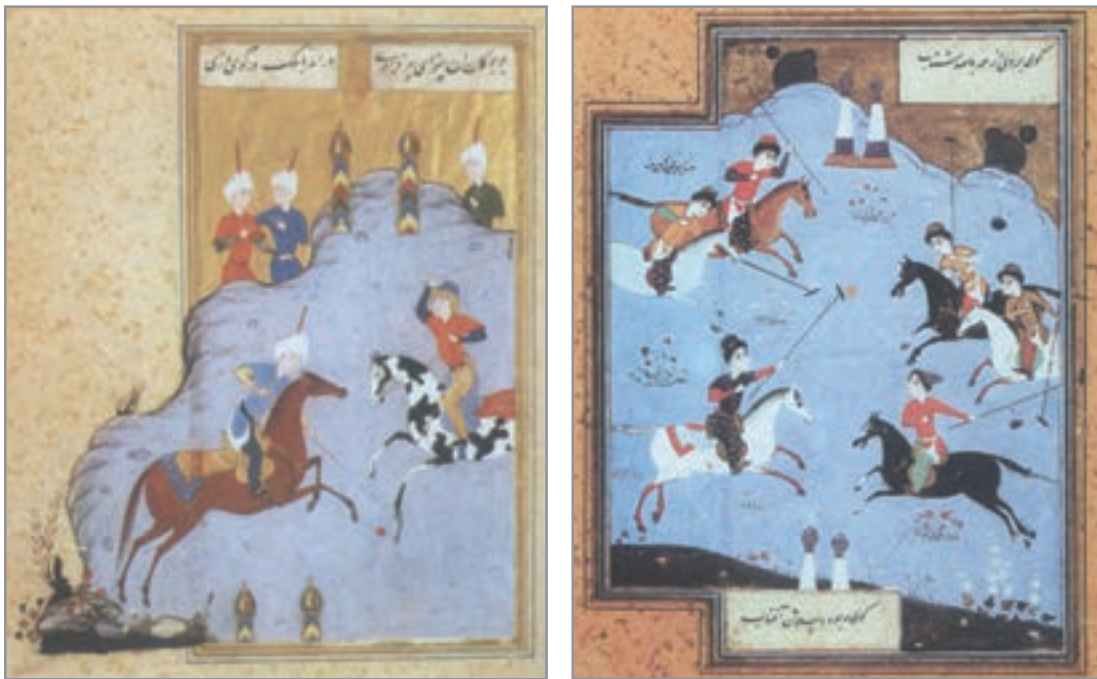
شکل ۱۵-۱- ورزش ایران در دوران پس از اسلام