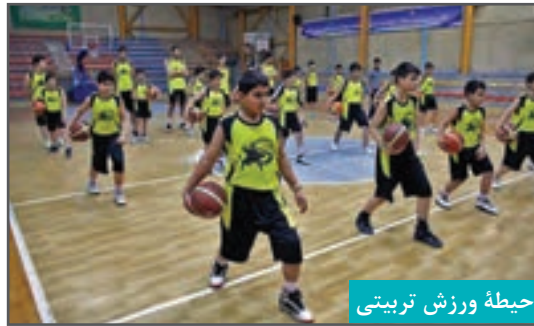
حیطه ورزش تربیتی