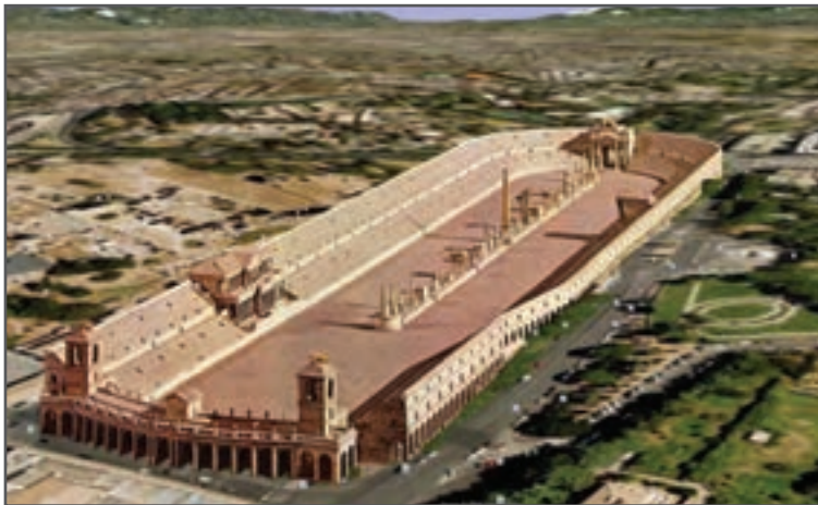
شکل ۱۲-۱- اماکن قدیمی ورزشی در روم باستان (ماکزیموس سیرک)