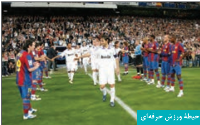
حیطه ورزش حرفه‌ای