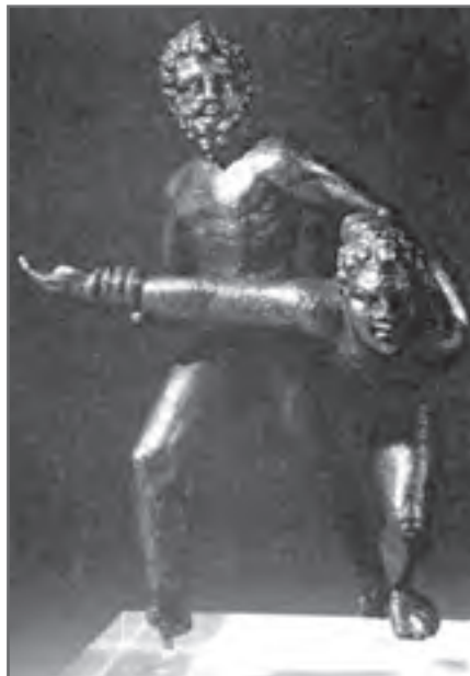
شکل ۱-۱۰- این تندیس به‌جا مانده از زمان بسیار دور، نشان‌دهنده نقش ورزش کشتی در فرهنگ آن دوران است.

از واژه ورزش، در دوره‌ها و قرون مختلف، برداشت‌های متعدد و متفاوتی شده است. با مطالعه تربیت بدنی و ورزش در تمدن‌های باستان متوجه می‌شویم که هر کدام با هدف خاصی برگزار می‌شده است. مثلاً در ایران باستان، ازابهرانی قسمت عمده‌ای از برنامه «جشن مهرگان» را به خود اختصاص می‌داده است. آموزش کشتی (شکل ۱-۱۰)، شنا و تیراندازی نیز اهداف نظامی داشته است. شکار نیز، برای رفع نیازهای غذایی و یا دفاع در برابر حمله حیوانات وحشی آموزش داده می‌شده است. در تمدن هند نیز، ورزش یوگا برای رهایی از شر و شور دنیا اجرا می‌شده است. در مجموع، می‌توان چنین نتیجه‌گیری کرد که، اولاً نوع فعالیت‌های ورزشی هر منطقه براساس فرهنگ، آداب و رسوم، شرایط اقلیمی و به‌ویژه نیازهای طبیعی آن منطقه، تنظیم شده است. ثانیاً بین فعالیت‌های بدنی و ورزشی و حرفه نظامی گری رابطه نزدیکی بوده است.