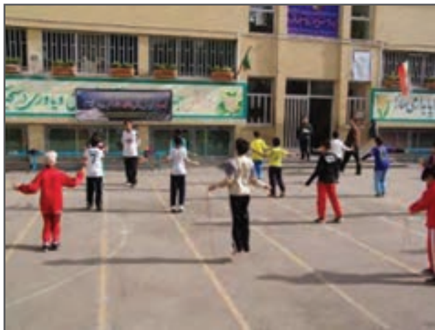
شکل ۱-۲- دانش آموزان در کلاس تربیت بدنی

براساس درک خود از تعاریف ورزش و تربیت بدنی، در مورد تفاوت های این دو با هم بحث و گفت و گو کنید و با راهنمایی معلم خود، نظرات یکدیگر را اصلاح نمایید.