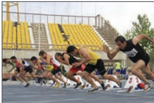
شکل ۵-۱- مسابقات قهرمانی با هدف کسب رکورد یا پیروزی بر حریفان