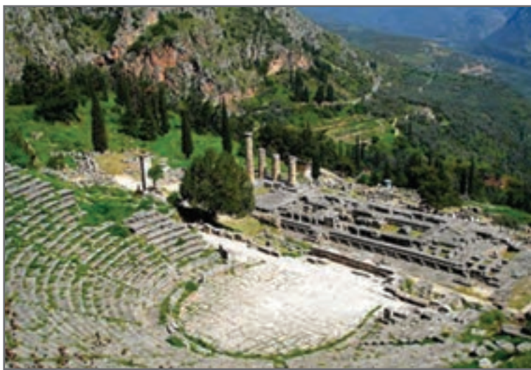
شکل ۱۱-۱. یکی از استادیوم‌های ورزشی ثنا که از دوران باستان به‌جا مانده است.

اماکن تمدن آتن عبارت بوده از مدارس کشتی به نام پالاسترا ۱ و استادیوم‌های ورزشی که عموماً خارج از شهر ساخته می‌شدند و در اغلب آنها «مدرسه کشتی» نیز وجود داشت (شکل ۱۱-۱). مدرسه نوجوانان مکان ورزشی دیگری بود که در آتن جدید، برنامه دو ساله‌ای برای تربیت بدنی تدارک دیده بود.