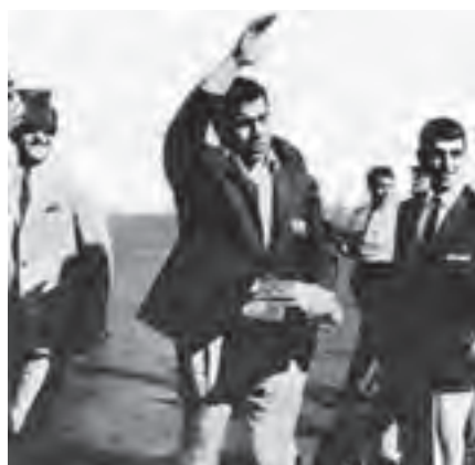
شکل ۱۶-۱- جهان پهلوان تختی اسطوره ورزشی

اسطوره‌های ورزشی، محدود به ورزش‌های باستانی نمی‌شوند، بلکه امروزه هم قهرمانانی هستند که می‌توانند سمبل تلاش، پشتکار و حتی مقابله با محدودیت‌های جسمانی باشند. نمونه‌هایی از این اسطوره‌های ورزشی