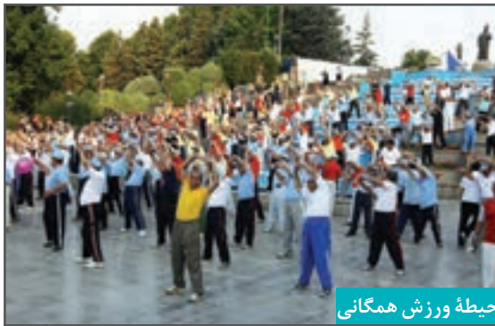
حیطه ورزش همگانی