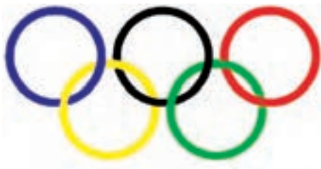
شکل ۱۹-۱. نماد المپیک