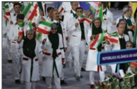
شکل ۱-۴- بازی‌های المپیک، رقابت‌های سازمان‌یافته با فلسفهٔ رقابت ملت‌ها با هدف اشاعهٔ ارتباطات