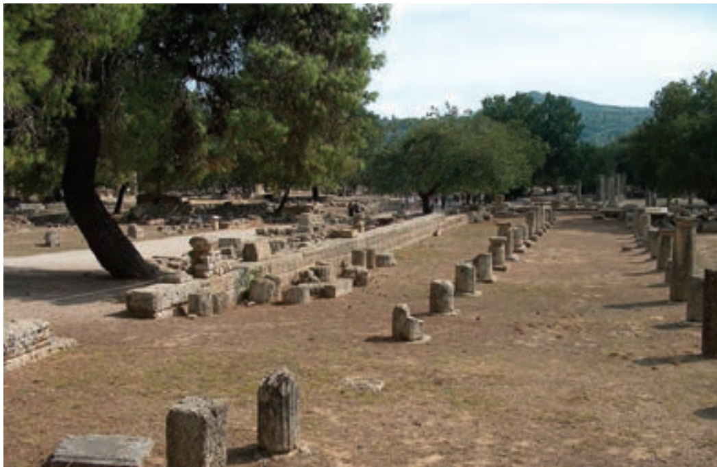
شکل ۱۷-۱- محل قدیمی المپیاد (المپس)

المپیا یا المپیاد نام محلی است که در کنار کوه «اولمپس» که از بلندترین کوه‌های یونان و معبد یونانیان بوده، واقع شده است. زمان بین دو جشن (دو دوره بازی) را المپیاد می‌نامیدند که این مدت چهار سال بود. مسابقات ورزشی به واسطه هم‌جوار بودن با این کوه‌ها (المپس)، به مرور زمان المپیاد نام گرفت (شکل ۱۷-۱). اولین دوره ۴ ساله بازی‌های المپیک ۱ در ۱۱۷۰ پس از میلاد در رشته‌های کشتی، بوکس، پنج‌گانه، اسب‌سواری و دو ماراتن انجام شد. در سال ۱۸۹۴ پیردوکوبرتن، یک معلم فرانسوی و عده‌ای دیگر، کمیته بین‌المللی المپیک ۲ را در لوزین پاریس بنیان‌گذاری کردند و دور جدید بازی‌های المپیک در ۹ رشته دوومیدانی، دوچرخه‌سواری، شمشیربازی، ژیمناستیک، تیراندازی، شنا، تنیس، وزنه‌برداری و کشتی در ۱۸۹۶ آن‌ها برگزار گردید. آنها معتقد بودند که ایجاد یک نظام ورزشی کاملاً رقابت‌آمیز، جوانان را به صلح و دوستی تشویق می‌نماید.