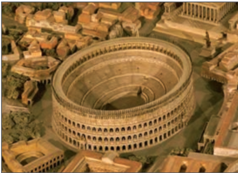
شکل ۱۳-۱- آمفی تئاتر کلوسئوم (فلاوین) رومیان