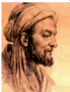
شکل ۸-۱- بوعلی سینا (یکی از فلاسفه ایرانی)

بزرگان مکتب اسلام، حضرت محمد ﷺ «الگوی فتوت» و حضرت علی علیه السلام : «نماد و سمبل فتوت»، حاصل جوانمردی و فتوت را در چهار صفت: عفت، شجاعت، حکمت و عدالت، بیان کرده‌اند.