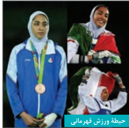
حیطه ورزش قهرمانی