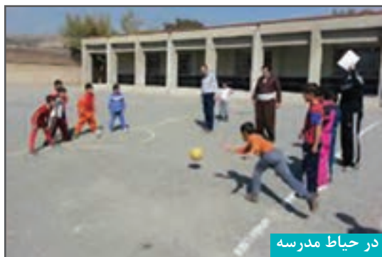
در حیاط مدرسه

بازی می‌تواند در جهت پر کردن اوقات فراغت ۱ مورد استفاده قرار گیرد.