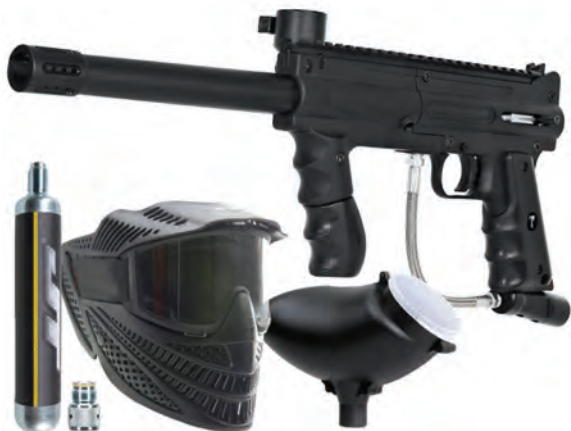
لوازم مکانیکی پینت بال

هاپر (یا لودر) به قسمت بالای بدنه مارکر متصل می‌شود و توپ‌های رنگی را یا از طریق جاذبه یا به‌طور الکترونیکی با چرخاندن چرخ‌دنده به درون مارکر می‌فرستد.