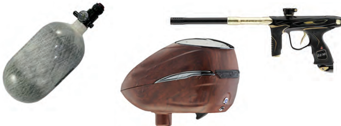
لوازم الکترونیکی پینت بال

هاپر (یا لودر) به قسمت بالای بدنه مارکر متصل می‌شود و توپ‌های رنگی را یا از طریق جاذبه یا به‌طور الکترونیکی با چرخاندن چرخ‌دنده به درون مارکر می‌فرستد.