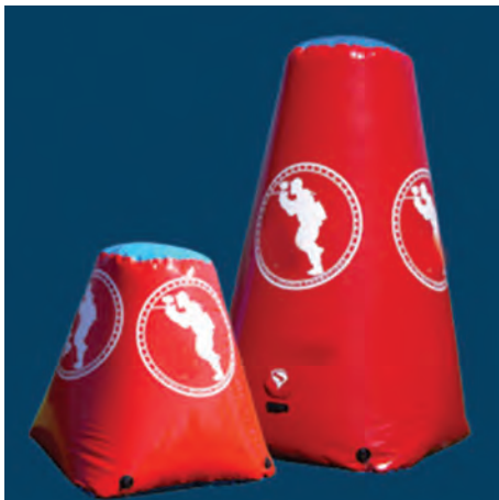
تمپل و تمپل مایا

حال شما چه در این زمین‌ها بازی کنید و چه در زمین‌های سناریویی، یادگیری اصول اولیه بازی در بانکرهای مختلف و آشنایی با ایده کلی نحوه بازی در هر شکل از پینت بال به شما کمک می‌کند.