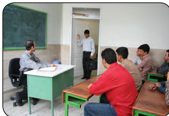
دیر رسیدن به مدرسه