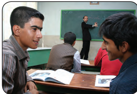
توجه نکردن به درس