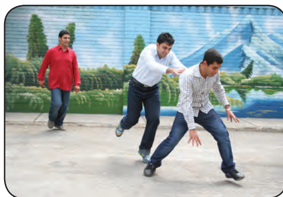
رفتار نامناسب در حیاط مدرسه