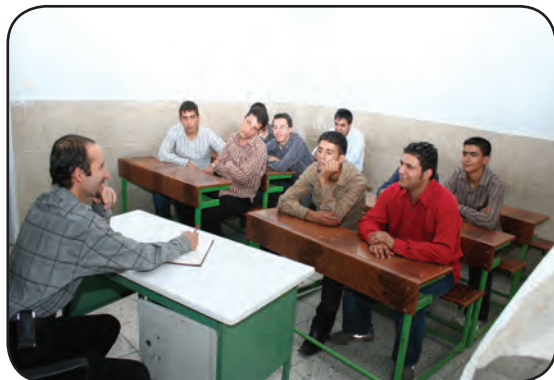
دقت کردن به درس

با توجه به عبارتهای سمت راست، برای تصویرهای سمت چپ، مانند نمونه یک عبارت بنویسید.