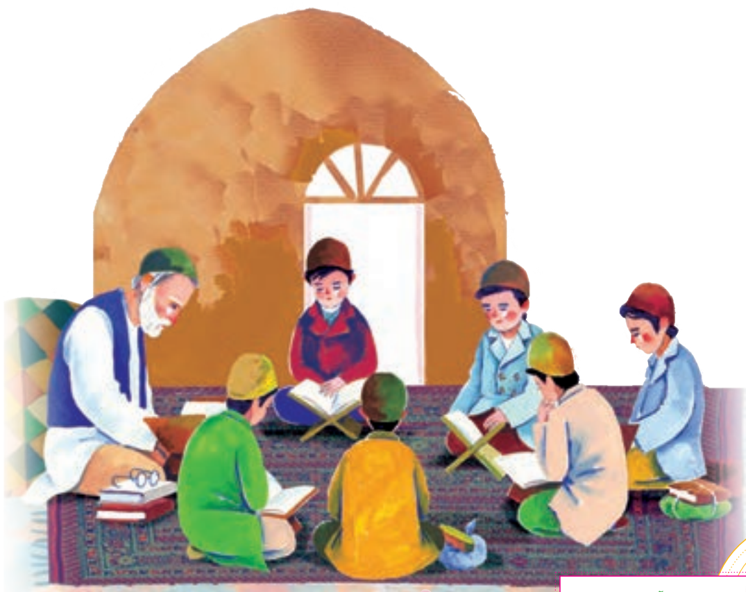
انس با قرآن در خانه

۵- هُدًى لِلنَّاسِ وَ بَيِّنَاتٍ مِنَ الْهُدَىٰ وَالْفُرْقَانِ