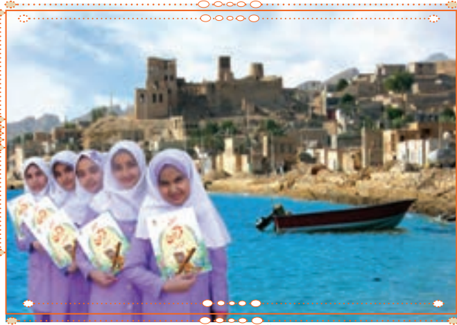
انس با قرآن کریم در استان بوشهر

با راهنمایی آموزگار خود پس از آوردن قرآن کریم از دفتر مدرسه، آن را به صورت تصادفی باز کنید و از روی آن بخوانید.