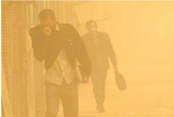
شکل ۲- گردوغبار در شهر اهواز - استان خوزستان

- سؤال چه چیز ، بر ماهیت هر پدیده یا مسئله، دلالت دارد؛ «چه چیزی رخ داده است؟» (وجود ریزگردهای بیش از حد مجاز در هوا).