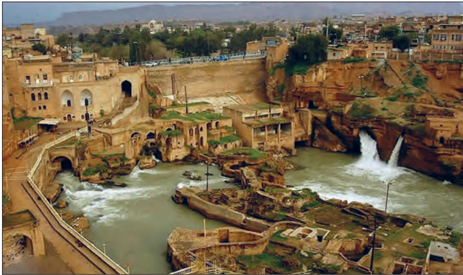
شکل ۱- سازه‌های آبی شوشتر (استان خوزستان) از بزرگ‌ترین مجموعه‌های صنعتی شناخته شده در عصر پیش از انقلاب صنعتی در جهان است و از سوی سازمان یونسکو (شاهکار نبوغ و خلاقیت) نامیده شده است.

طی سال‌های گذشته، مطالبی دربارهٔ محیط پیرامون خود و سایر مکان‌ها خوانده‌اید. اطلاعات مربوط به کرهٔ زمین، مانند زیستگاه‌های مختلف، آب و هوا، رودها و کوه‌ها و حتی مسائل مربوط به آداب و رسوم و سنت‌ها به ما کمک می‌کند که دانش ما از محیط پیرامون و سایر مکان‌ها افزایش یابد. آیا شناخت محیط در جهت بهبود کیفیت زندگی انسان نقشی داشته است؟