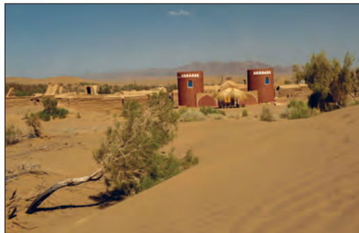
کویر مصر - اصفهان