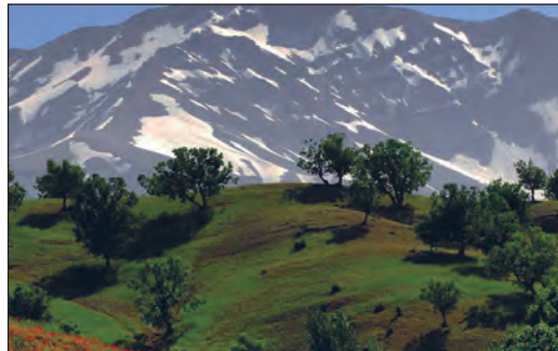
زردکوه - چهارمحال بختیاری