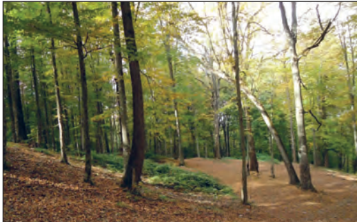
جنگل گلستان - استان گلستان

عملکرد مثبت و منفی انسان را در هر یک از نواحی زیر بررسی کنید و جدول را کامل نمایید.