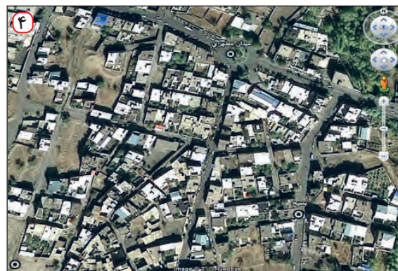
تصویر ماهواره‌ای شهر تفرش - استان مرکزی