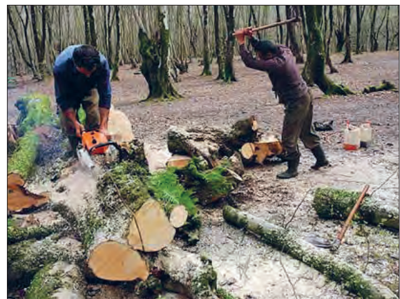
شکل ۷- قطع بی رویه درختان جنگل - مازندران

به نظر شما کدام یک از این عملکردها تعادل محیط را در مدت طولانی حفظ می کند؟ از آنجا که جغرافیا روابط متقابل انسان را با محیط، مطالعه و بررسی می کند، بنابراین شناخت توان ها و ظرفیت های محیطی بدون دانش جغرافیا ممکن نیست؛ پس جغرافیا علمی برای زندگی بهتر است.