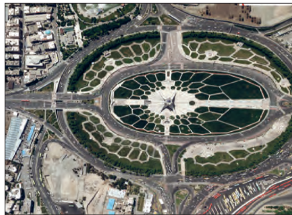
شکل ۳- میدان آزادی - تهران ۱۳۹۵