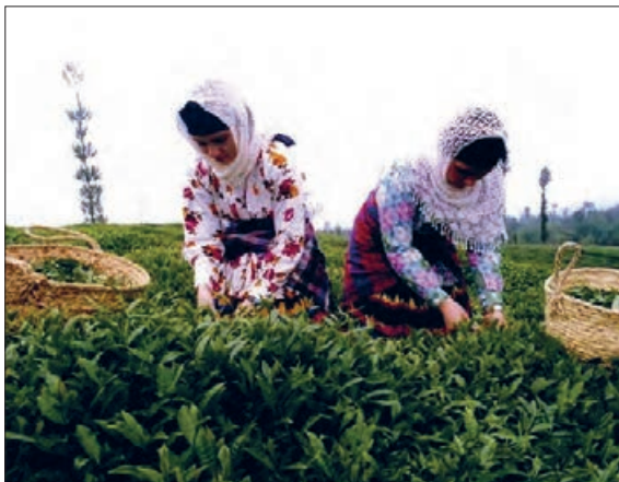
شکل ۸- کشاورزی و رفع نیازها - برداشت چای - لاهیجان - گیلان