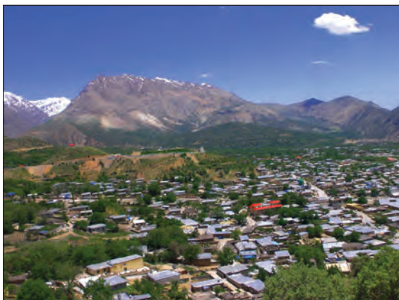
شکل ۹- شهر کوهپایه ای سی سخت - کهگیلویه و بویراحمد

دید ترکیبی یعنی: مطالعه همه جانبه و جامع پدیده‌ها با تمام ویژگی‌های آن در یک مکان