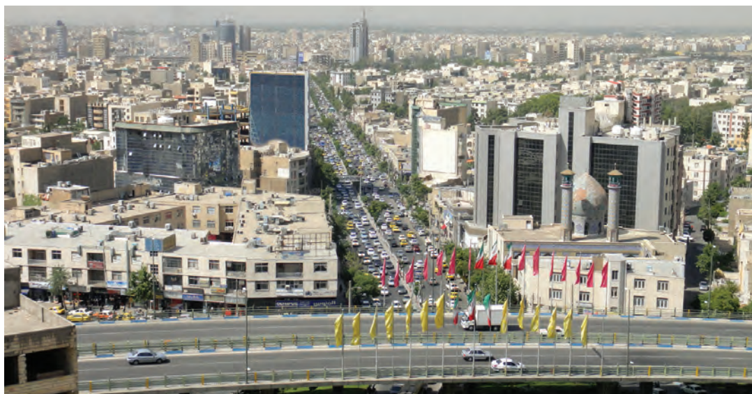
شکل ۳- شهر کرج - استان البرز

عوامل مؤثر در افزایش جمعیت شهر کرج در دهه اخیر چیست؟