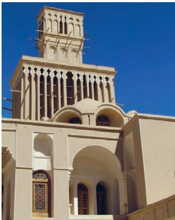
شکل ۵ - بادگیر دوطبقه ابرکوه - استان یزد