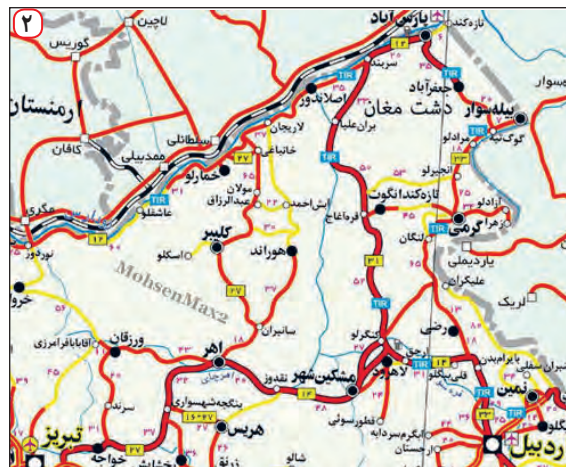
نقشه استان اردبیل