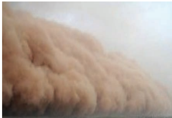
شکل ۱- توفان گردوغبار - دهلران - استان ایلام

- سؤال چرا ، به علت وقوع پدیده می‌پردازد. «چرا این پدیده به وجود آمده است؟» (تداوم خشکسالی در سال‌های اخیر).