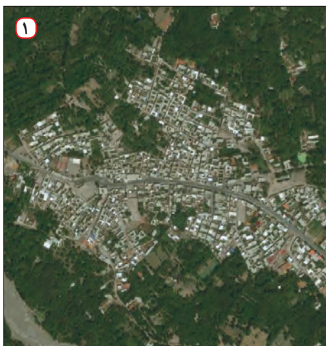
عکس هوایی روستای قاضی جهان - آذربایجان شرقی

● پژوهشگر به سالنامه آماری یک دهه مراجعه می‌کند و تغییرات جمعیتی شهر کرج را مورد مطالعه قرار می‌دهد. او با کمک عکس‌های هوایی و ماهواره‌ای، رشد فیزیکی شهر کرج را طی یک دهه بررسی می‌کند.