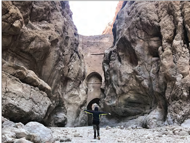
شکل ۶- سد شاه عباسی (طبس، خراسان جنوبی) قدیمی ترین و بزرگ ترین سد قوسی جهان است که یکی از نمونه های عالی خلاقیت، دوران بخشی و سخت کوشی ایرانیان است.

محیط جغرافیایی از تعامل بین محیط طبیعی و محیط انسانی به وجود می آید.