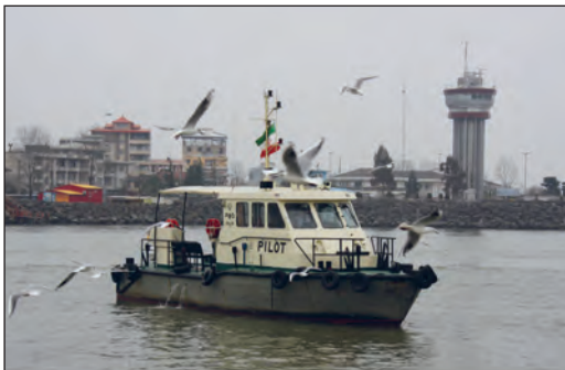
ساحل بندر انزلی - گیلان