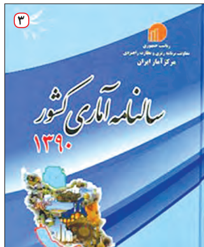
سالنامه آماری کشور