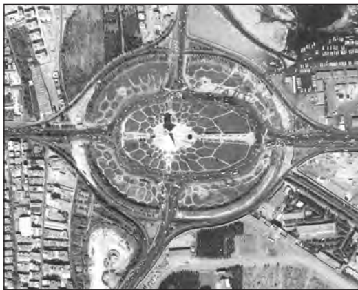
شکل ۴- میدان آزادی - تهران ۱۳۶۵

در هر مکان، پدیده‌های مختلفی هستند که بر یکدیگر تأثیر گذاشته و به نوبه خود از هم تأثیر می‌پذیرند؛ به‌طور مثال یک روستا را در نظر بگیرید که خاک، آب، سرمایه و نیروی انسانی آن بر نوع اشتغال آن اثر می‌گذارد و بالعکس. این روند تأثیرگذاری و تأثیرپذیری به‌صورت جریانی پیوسته در مکان ادامه دارد و سبب تغییر شکل مکان‌ها می‌شود. به تصاویر زیر دقت، و برداشت خود را از آنها با سایر هم‌کلاسی‌های خود مطرح کنید، نظر آنان را جویا شوید و با یکدیگر مقایسه کنید.