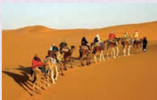
کویر مصر - اصفهان