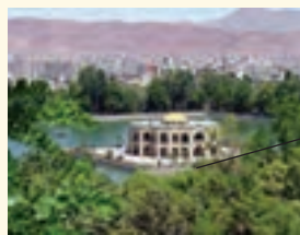
ایل گلی از جاذبه های تاریخی - فرهنگی آذربایجان شرقی است.