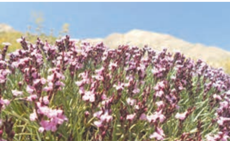
شکل ۲۶- منطقه حفاظت شده دنا - کهگیلویه و بویراحمد

اراضی‌ای که از نظر حفاظت دارای ارزش استراتژیک است و به منظور حراست، ترمیم و احیای حیات جانوری و گیاهی و جلوگیری از انهدام تدریجی آنها انتخاب می‌شوند. این مناطق که نسبتاً وسیع هستند برای فعالیت‌های تفرجگاهی و گردشگری براساس مقررات و محدودیت‌های تنظیم شده مورد استفاده قرار می‌گیرند.