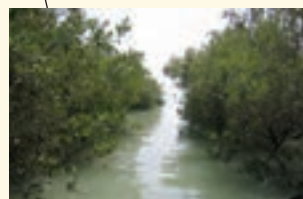
جنگل های حرّای هرمزگان از جاذبه های ارزشمند ایران است و تحت حفاظت هستند.