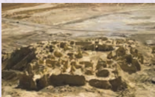
شهر سوخته - سیستان و بلوچستان