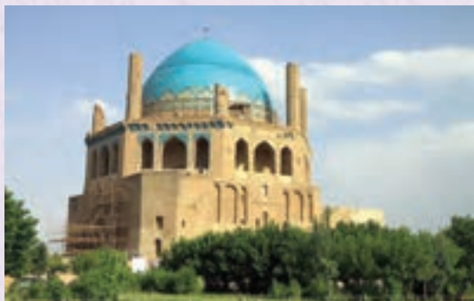
گنبد سلطانیه - زنجان

کشور ما، ایران، مکان‌های زیادی برای گردش دارد. برماست که در دوران زندگی خود از آنها دیدن کنیم و لذت ببریم.