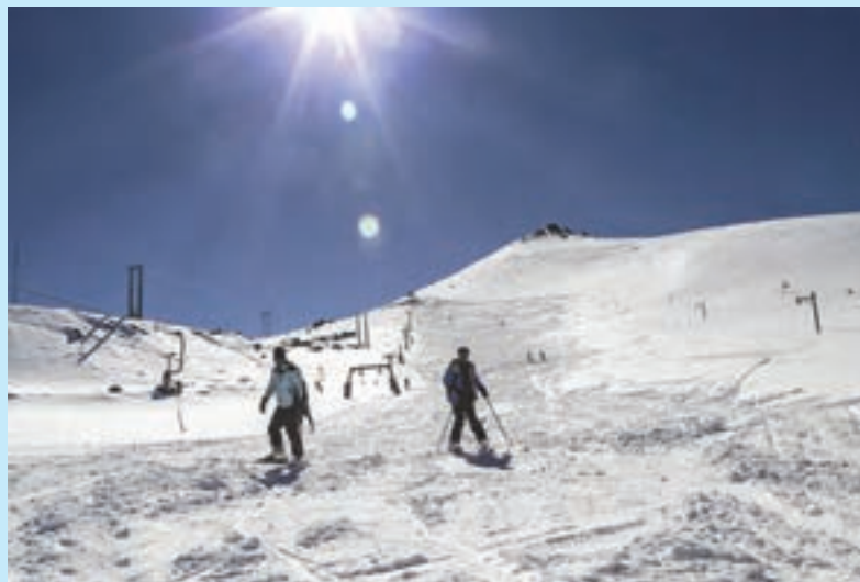
شکل ۱۹- اسکی روی برف - کوه‌رنگ چهارمحال و بختیاری

شامل انواع اسکی روی برف، کوه، شن، ماسه و نظایر آن (در تپه‌های ماسه‌ای بیابان‌ها و سواحل دریاها) است.