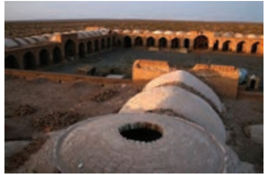
شکل ۶- کاروان سرای دیر گچین در قم - قدیمی‌ترین و مادر کاروان سراهای ایران