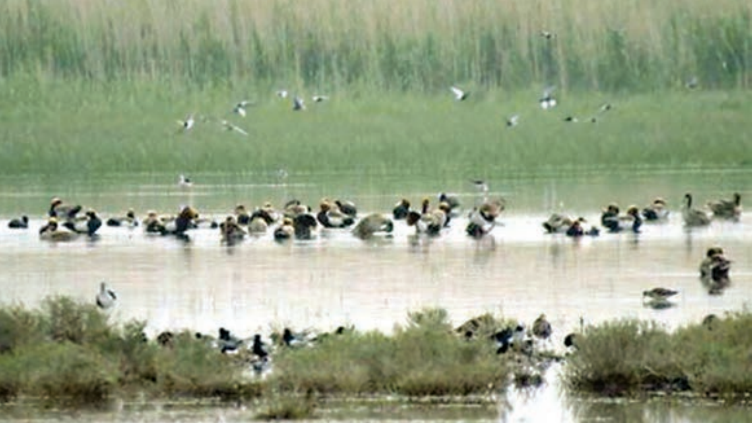
شکل ۱۵- تالاب کانی برازان - مهاباد - آذربایجان غربی