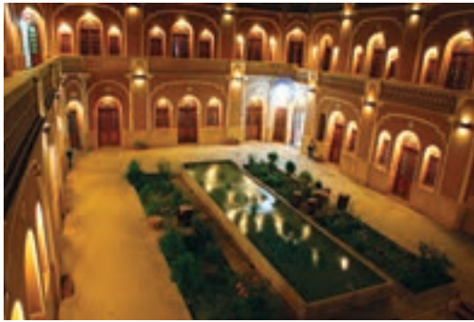
شکل ۷- کاروان سرای بازسازی شده مشیر یزد

امروزه با بازسازی برخی از این کاروانسراها آنها را به محل اقامت مسافران تبدیل نموده‌اند.