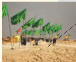
تعداد زیادی از هم وطنان برای بازدید از مناطق دفاع مقدس به خوزستان و مناطق غربی ایران سفر می کنند. (راهیان نور)