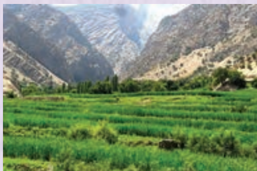
شکل ۳۰- روستای شیوند- ایذه خوزستان

شما چه اقدامات دیگری را پیشنهاد می‌کنید؟ در جای خالی بنویسید.