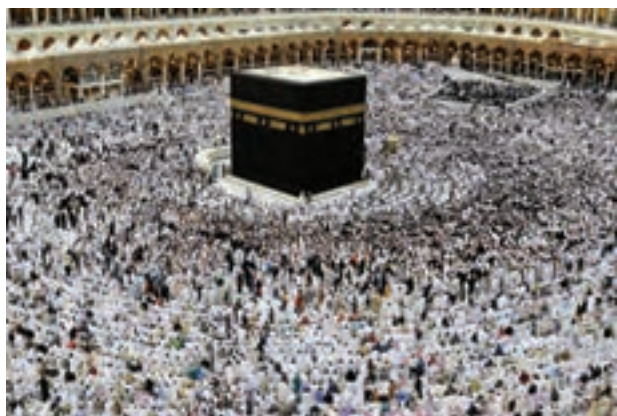
شکل ۹- کعبه قبله مسلمانان