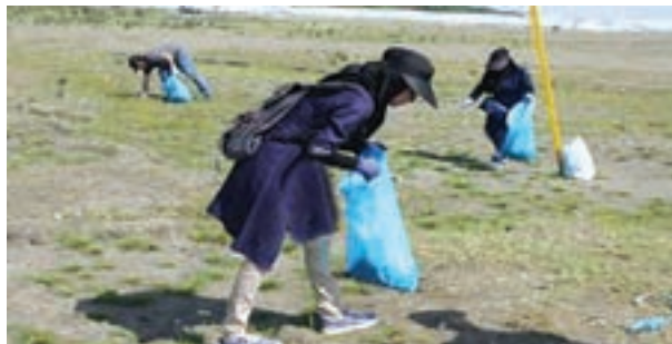
شکل ۲۸- جمع‌آوری زباله توسط گردشگران - ساحل دریای خزر