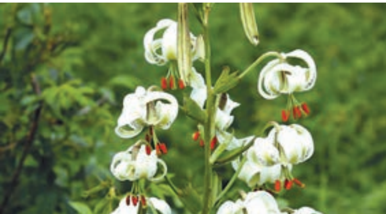
شکل ۲۵- سوسن چلچراغ - گیلان

پدیده‌ها یا مجموعه‌های گیاهی و جانوری به نسبت کوچک، جالب، کم‌نظیر، استثنایی و غیرقابل جایگزین که دارای ارزش‌های حفاظتی، علمی، تاریخی یا طبیعی هستند.