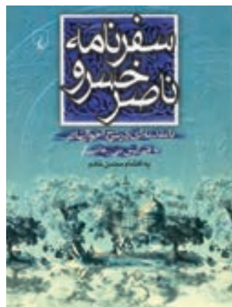
شکل ۱۰- سفرنامه ناصر خسرو