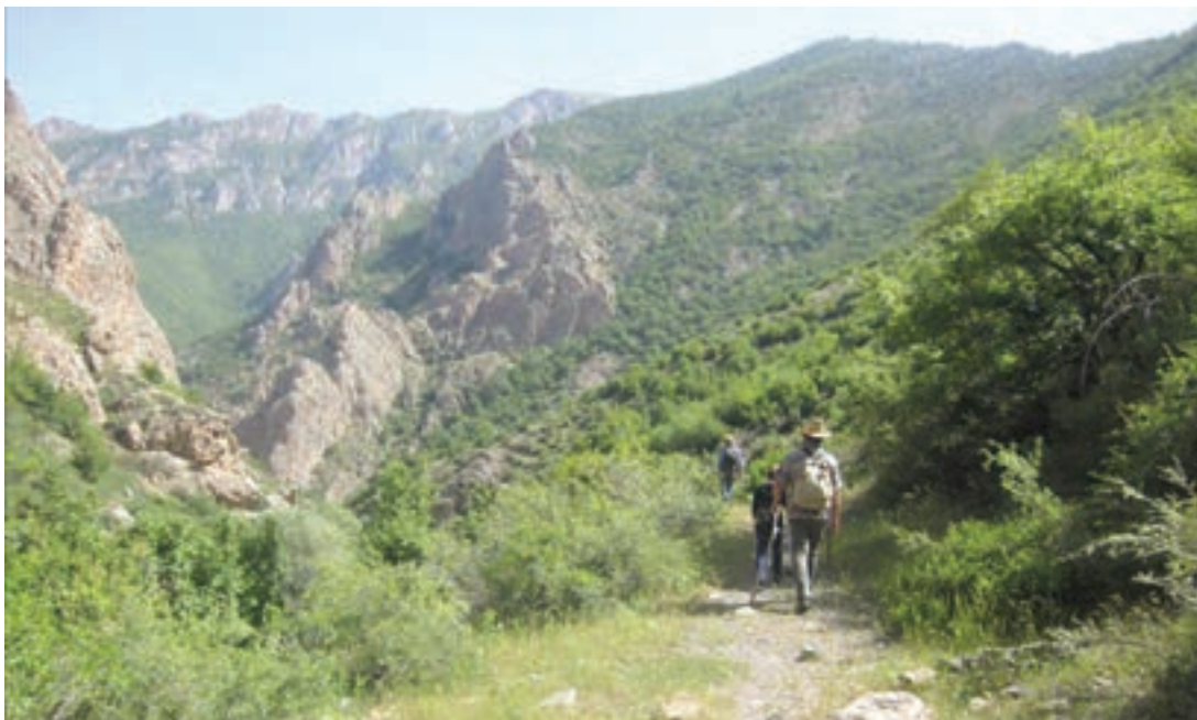
شکل ۱۶- منطقه رودبارک - سمنان

شاید درک ساده ای از بوم گردشگری تنها وقت گذرانی و انجام هر فعالیتی در طبیعت باشد. به طور مثال آيا شکار، آفرود* و موتورسواری بر روی رمل های بیابان، تاب بستن به درختان و تردد ماشین در جاده های جنگلی انبوه و دست نخورده می تواند نوعی از فعالیت های بوم گردشگری باشد؟