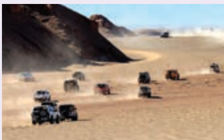
شکل ۲۳- خودروهای آفرود در دشت لوت

میراث جهانی بیابان لوت در جنوب شرقی ایران، به عنوان اولین اثر طبیعی ایران در چهلمین اجلاس میراث جهانی یونسکو در سال ۱۳۹۵ به ثبت رسید. این میراث جهانی دارای نمونه‌هایی از درجات عالی پدیده‌های طبیعی است که اهمیت زیبایی‌شناختی، طبیعی و استثنایی بالایی دارد.