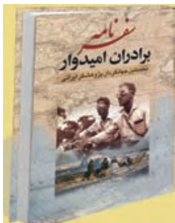
شکل ۱۱- سفرنامه برادران امیدوار