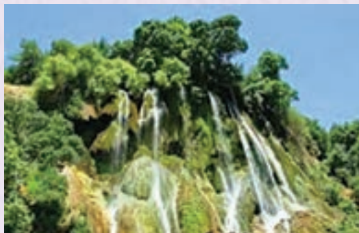
آبشار بیشه - لرستان