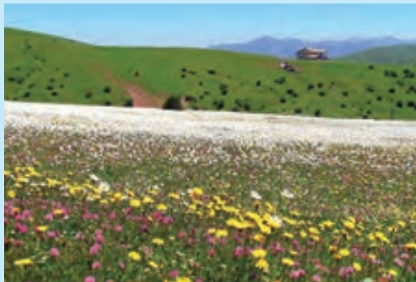
شکل ۲۱- منطقه گردشگری فندقلو - اردبیل

شامل گردشگری در فضاهای محیط زیستی برای درک و شناخت بهتر تنوع زیستی و استفاده از شرایط آب و هوایی است.