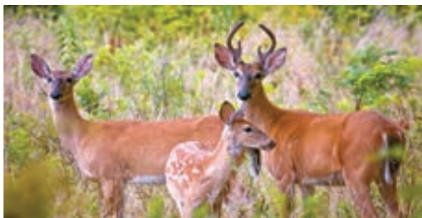
شکل ۲۷- پناهگاه حیات وحش - (دشت ناز - ساری)

مناطق از انواع زیستگاه‌های نمونه‌اند که برای حمایت از جمعیت گونه‌های حیات وحش که اهمیت ملی دارند، انتخاب می‌شوند. این مناطق، محیط‌های مناسبی برای فعالیت‌های آموزشی و پژوهشی محسوب می‌شوند. فعالیت‌های گردشگری کنترل شده و در ابعاد محدود در پناهگاه‌ها مجاز است.