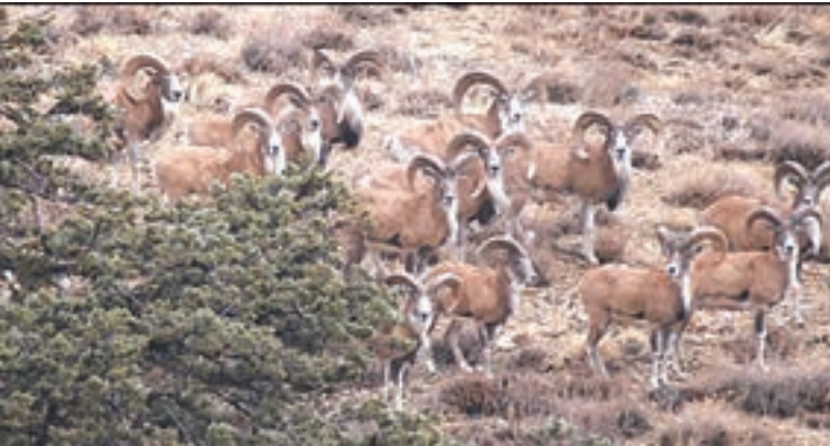
شکل ۲۴- پارک ملی گلستان

گردشگری در پارک‌های ملی با رعایت قوانین و مقررات سازمان حفاظت محیط‌زیست و در مناطق مشخص شده انجام می‌شود.