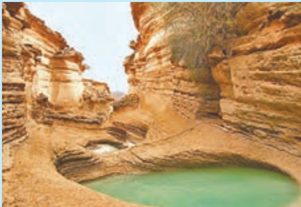
شکل ۱۸- ژئوپارک قشم - هرمزگان