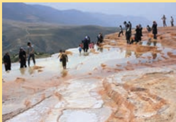
شکل ۱۴- ورود گردشگران به داخل چشمه ها

متأسفانه گردشگران بدون توجه به اصول و مقررات حفاظت از بوم سازگان (اکوسیستم) به راحتی با کفش به داخل چشمه می روند. این در حالی است که به دلیل شرایط و موقعیت خاص این چشمه نباید به آن وارد شد. چرا که بلورهایی که به زیبایی در طول هزاران سال تشکیل شده اند در چشم بهم زدن از بین می روند. ایجاد یک مسیر مناسب برای گردشگران در این مکان بسیار ضروری است.