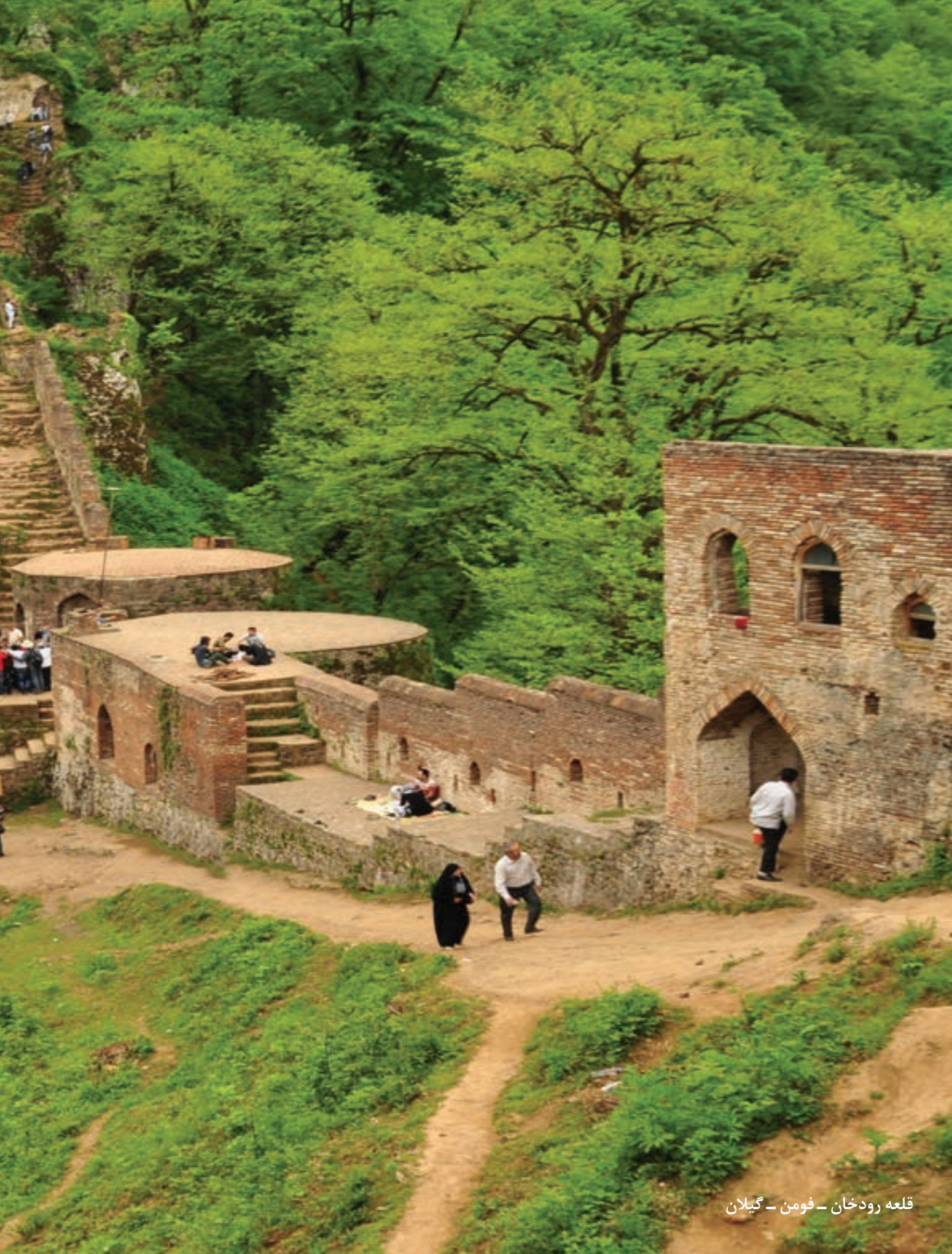
قلعه رودخان - فومن - گیلان