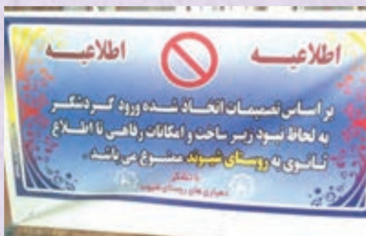
شکل ۳۱- اطلاعیه مردم شیوند برای گردشگران

منطقه شیوند در چهل کیلومتری شمال شهرستان ایذه خوزستان قرار دارد که به واسطه آثار تاریخی و جاذبه‌های طبیعی هر ساله تعداد زیادی از گردشگران از این منطقه بازدید می‌کنند.