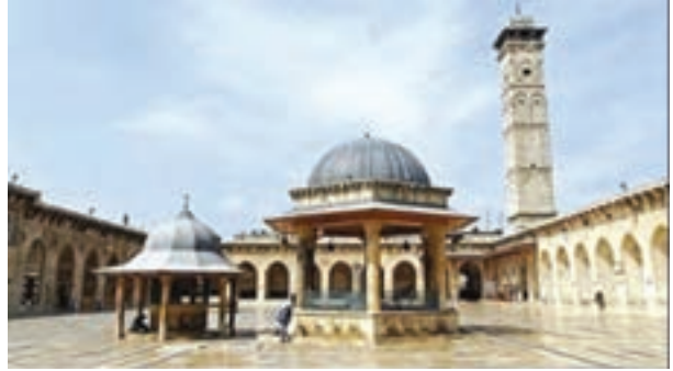
شکل ۴- تخریب آثار تاریخی در سوریه