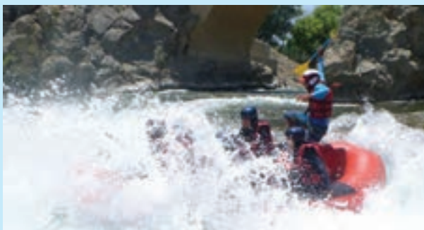
شکل ۲۰- قایقرانی در رودهای خروشان کردستان