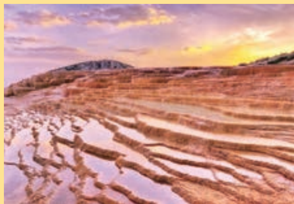
شکل ۱۳- چشمه های تراورتنی باداب سورت