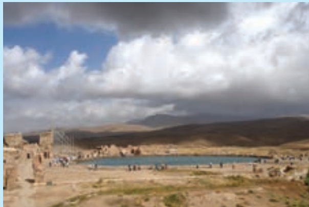
شکل ۲۲- تخت سلیمان - تکاب - آذربایجان غربی

استفاده از عناصر و حس طبیعت به منظور سلامت، تمرکز و تعادل جسمانی، روانی و روحی است.