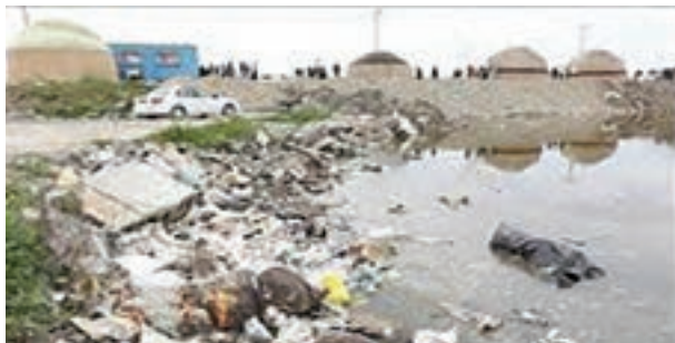
شکل ۲۹- زباله‌های به‌جا مانده از سفر گردشگران - ساحل دریای خزر

گردشگری مسئولانه یعنی همان‌طور که ما وقتی به مهمانی می‌رویم، خانه میزبان خود را آلوده یا تخریب نمی‌کنیم پس باید همین رفتار را هنگام گردشگری نیز رعایت کنیم. اگر چه بابت سفرمان هزینه پرداخت می‌کنیم، اما این موضوع باعث نمی‌شود که به میزبان بی‌احترامی کنیم یا خانه او را خراب کنیم. در تمامی کشورها میان گردشگران، جوامع میزبان، جاذبه‌های گردشگری و محیط زیست، ارتباطی متقابل و پیچیده وجود دارد. از طریق ارتباط بیشتر با زندگی مردم محلی و درک مسائل فرهنگی، اجتماعی و محیط زیستی، گردشگران لذت بیشتری می‌برند. مسئولیت‌پذیری هنگام گردشگری نشانه سطح فرهنگی و تربیتی یک جامعه است.