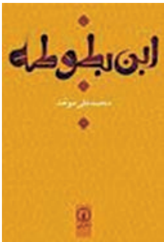
شکل ۱۲- سفرنامه ابن بطوطه