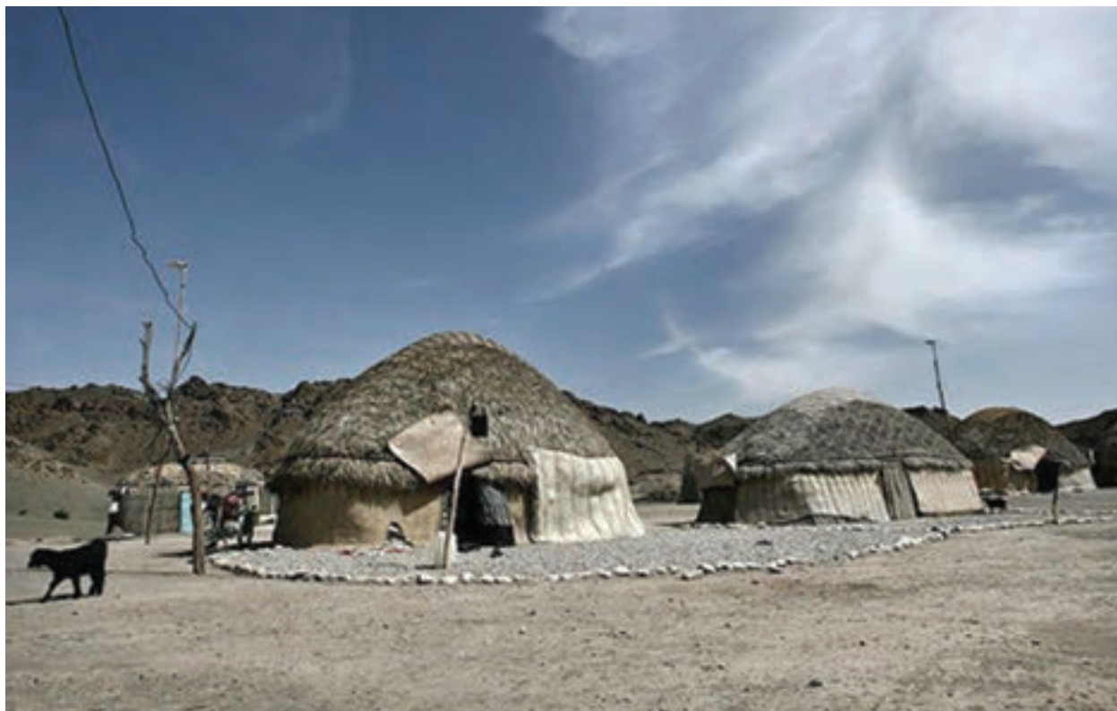
شکل ۱۷- مهمان پذیرهای کبری در قلعه گنج کرمان - نوعی از اقامتگاه های سازگار با محیط زیست

انواع زیرساخت ها در بوم گردشگری مورد استفاده قرار می گیرند. اقامتگاه های سازگار با محیط زیست که با مواد قابل بازیافت و انواع روش های تأمین آب و انرژی همسو با ملاحظات محیط زیستی ساخته می شوند و مسیرهای دسترسی به مناطقی برای پرنده نگری، پیاده روی، قایق رانی و بازدید از جاذبه های محلی در فضای باز را دارند.