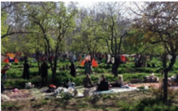
شکل ۸- خانواده‌های ایرانی در دامن طبیعت

آیا در نزدیکی محل زندگی شما کاروان‌سراییی وجود دارد؟ با دوستان خود درباره آن تحقیق و در کلاس ارائه کنید.