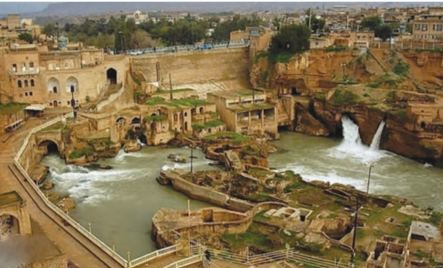
شکل ۵- سازه‌های آبی - تاریخی، شوشتر، خوزستان

شهرستان شوشتر در جنوب ایران، به واسطه وجود سازه‌های آبی - تاریخی و سایر اماکن فرهنگی و توجه مسئولان در حال حاضر با ظرفیت‌سازی لازم به یکی از اهداف گردشگری ایران تبدیل شده است.