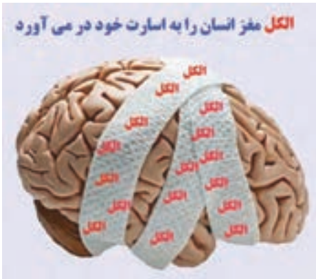
شکل ۵. حتی نوشیدن مقدار اندک مشروب، کاهش اندازه و وزن مغز و از دست رفتن برخی از توانایی‌های فکری فرد را در پی دارد.

الکل عملکردهای سیستم اعصاب مرکزی را تحت تأثیر قرار داده و آثار خود را به صورت عدم تعادل در حرکت، اختلال در تکلم، کاهش تعداد تنفس و کاهش ضربان قلب و فشار خون نشان می‌دهد. با افزایش اختلال در سیستم اعصاب مرکزی، کارکردهای حیاتی به شکل قابل توجهی تحت تأثیر قرار می‌گیرند. در موارد شدید، ممکن است شخص دچار کاهش هوشیاری (کما) و حتی مرگ شود.