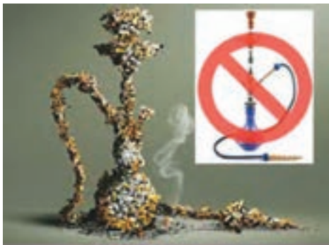
شکل ۲. ضرر قلیان معادل ۱۰۰ تا ۲۰۰ نخ سیگار یا بیشتر است.

آن نیز در فرد مصرف‌کننده ایجاد وابستگی می‌کند (شکل ۲). فرد مصرف‌کننده قلیان، با استنشاق مقادیر بسیار زیادی دود، حیات زیستی خود را در مواجهه با مقادیر زیادی مواد شیمیایی سرطان‌زا و گازهای خطرناک مثل منواکسیدکربن، فلزات سنگین و ترکیبات شیمیایی سرطان‌زای منتشره قرار می‌دهد. به‌ویژه، تنباکوه‌های میوه‌ای به دلیل افزودنی شیمیایی و مواد مضر به آنها می‌توانند باعث سرطان، انواع بیماری‌های خطرناک و کشنده، آلرژی، آسم و حساسیت شوند.