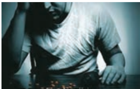
شکل ۱. وابستگی به مواد

• وابستگی جسمانی ، وضعیتی است که در آن، بدن فرد نسبت به موادمخدر تحمل نشان می‌دهد و فرد برای دستیابی به همان آثار مطلوب و دلخواهی که از مصرف مواد انتظار داشته، مجبور می‌شود بیشتر از مرتبه‌های