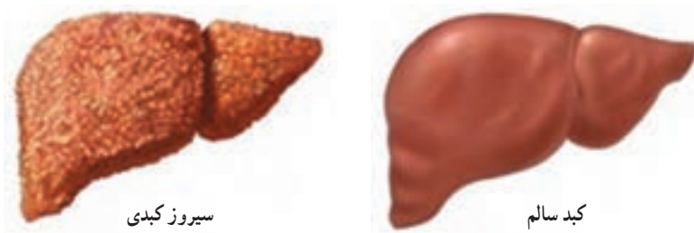
شکل ۶. کبد سالم و ناسالم

یکی از شایع‌ترین آثار بلندمدت مصرف مشروبات الکلی، بیماری سیروز کبدی و سرطان است (شکل ۶). در این بیماری کبد کالری‌های اضافی بدن را تبدیل به چربی کرده و در خود ذخیره می‌کند؛ وضعیتی که به آن «کبد چرب» می‌گویند به دلیل مصرف مداوم الکل و نبود زمان کافی، این چربی نمی‌تواند به دیگر مکان‌های ذخیره‌سازی بدن منتقل شود و سلول‌های پر از چربی کبد سبب می‌شوند که کبد کارکرد خود را از دست بدهد.