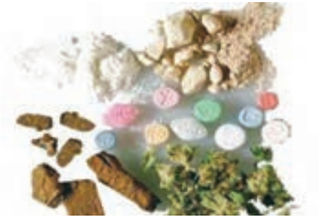
شکل ۳. مواد اعتیادآور

اکنون در جهان بیش از ده نوع ماده مخدر طبیعی و بیش از هزار نوع ماده مخدر صنعتی که آثار منفی ویران‌کننده‌تری دارند، تولید می‌شود که هر کدام از آنها بر سلامت جسم و روان فرد مصرف‌کننده اثرات مضر و متفاوتی به‌جامی‌گذارند.