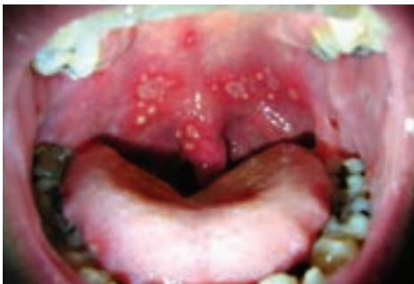
شکل ۳. بیماری دهانی ناشی از مصرف قلیان

دراثر استفاده مشترک از قلیان بیماری‌های منتقله از طریق دهان و دستان فرد آلوده، سلامت افراد دیگر را تهدید می‌کند. از جمله این آلودگی‌ها می‌توان به آگزمای دست، انتقال عفونت‌هایی از قبیل بیماری‌های دهانی، سل، ویروس تبخال و هلیکوباکتری (عامل زخم معده) و ... اشاره کرد (شکل ۳).