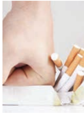
شکل ۱. سیگار دروازه ورود به اعتیاد است.