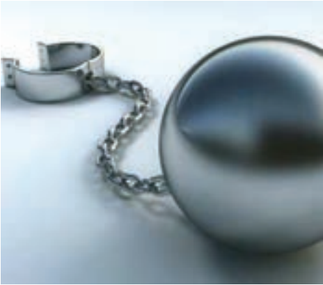
شکل ۲. سیر اختلالات مصرف مواد مخدر معمولاً به سمت وابستگی حرکت می‌کند.

«اختلالات مصرف مواد حالت خفیف‌تر از وابستگی به یک ماده است و منظور این است که اگرچه فرد نسبت به مواد اعتیاد ندارد ولی آن را علی‌رغم مشکلاتی که برایش ایجاد می‌کند، مصرف می‌کند.» پیشگیری از اختلالات مصرف مواد به دلایل زیر دارای اهمیت زیادی است :